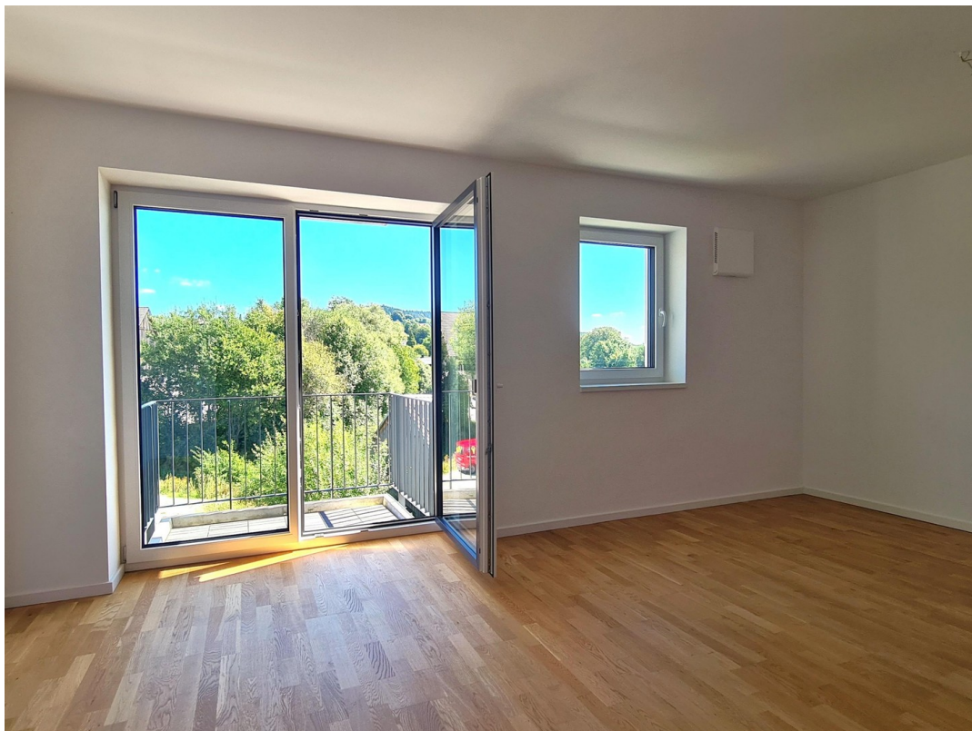
Balkon mit Aussicht ins Grüne