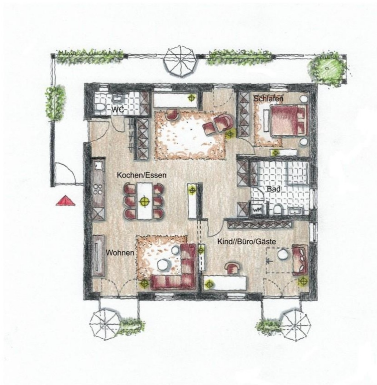
3-Zi Loft Wohnung