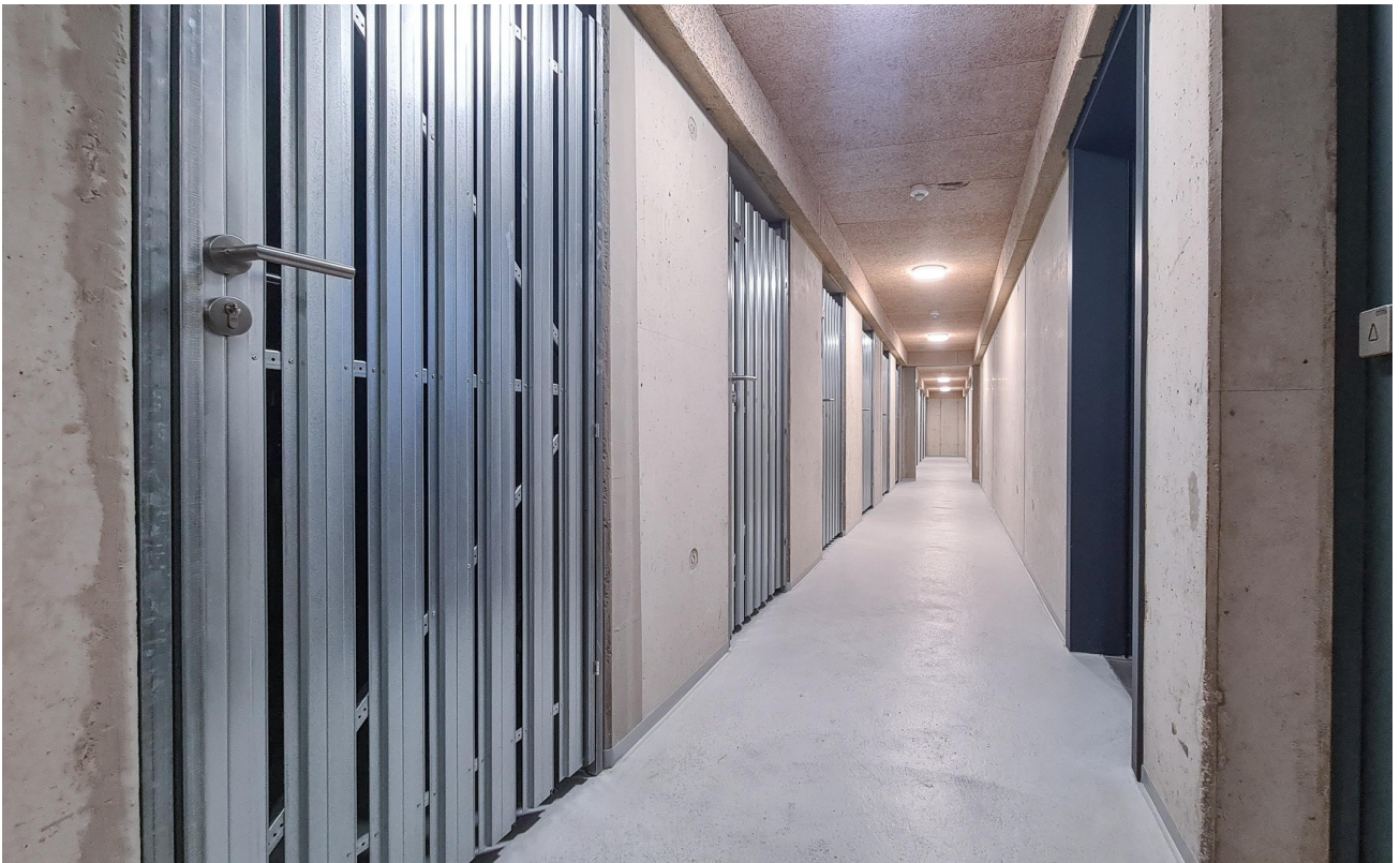
Trockene, große Kellerräume