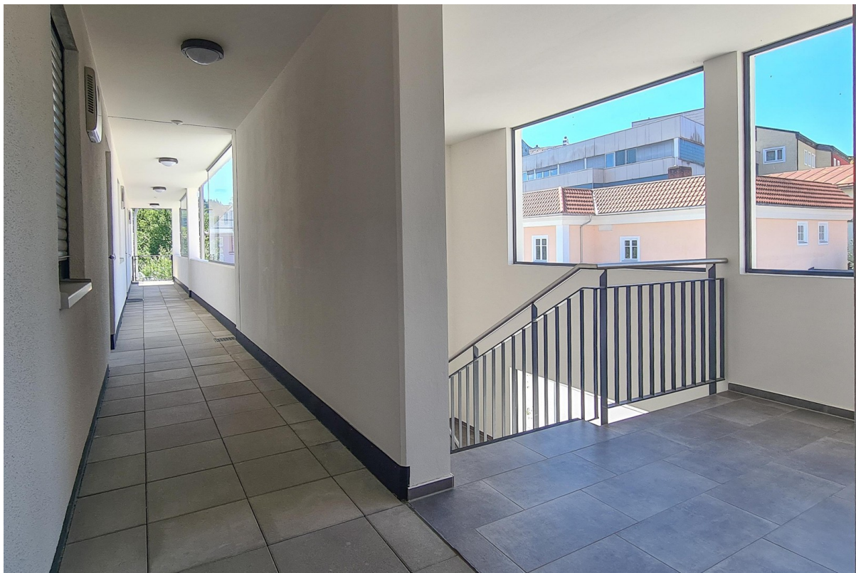
Treppenhaus und Laubengang