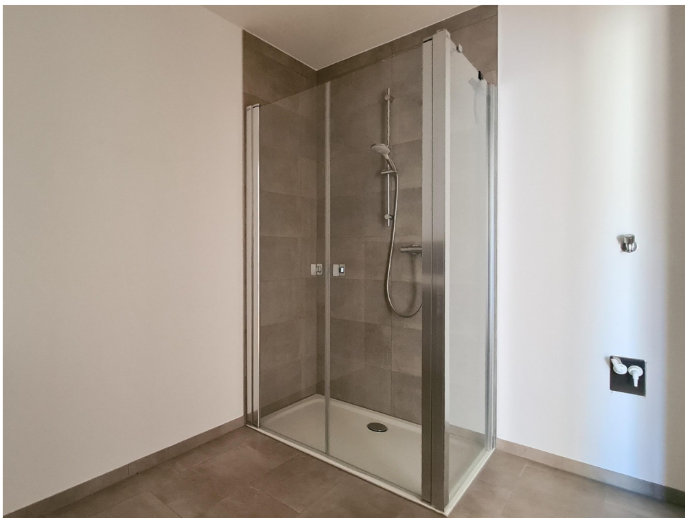
Dusche und Waschmaschine