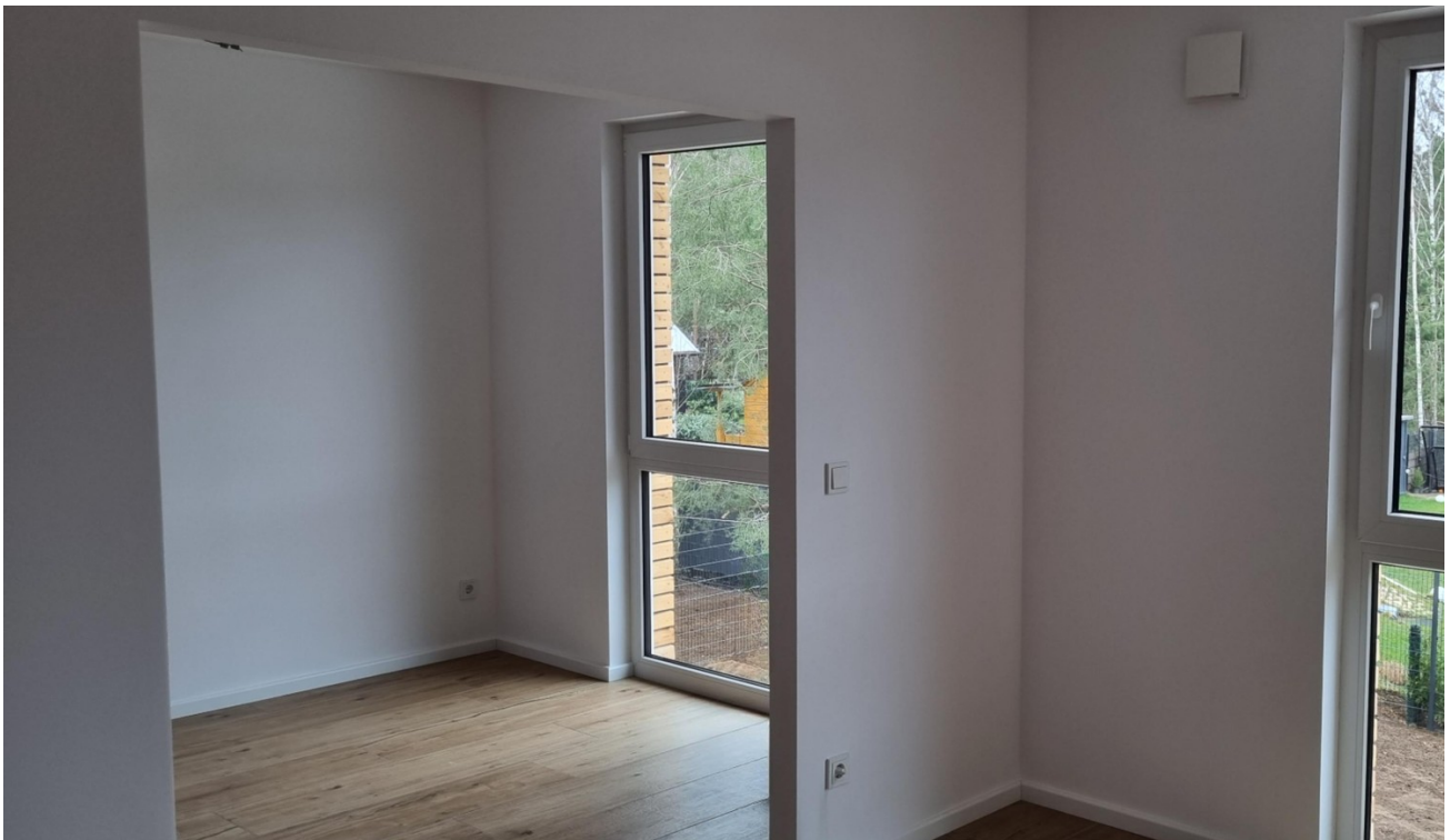
Master bedroom mit Umkleide