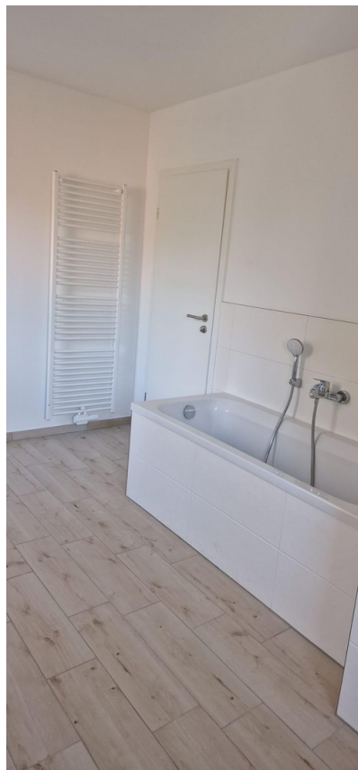
Bad OG mit Dusche und Wanne