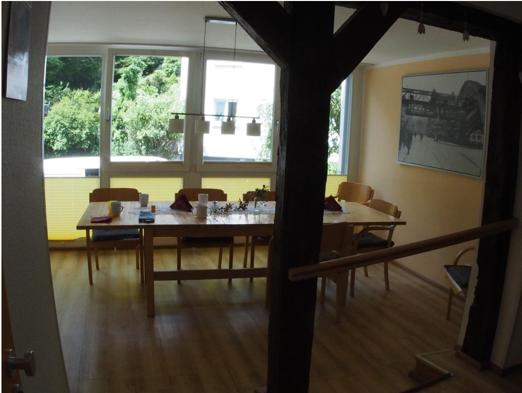
Aufenthalt Allgemein WHG