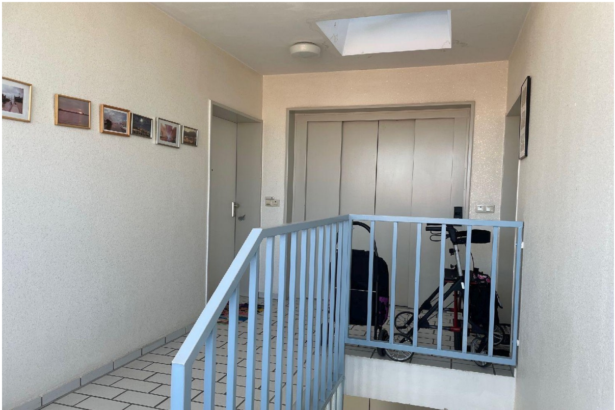
Treppenhaus mit Aufzug