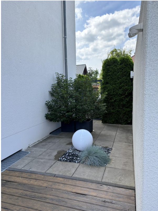
Zuwegung Garten und Wohnung