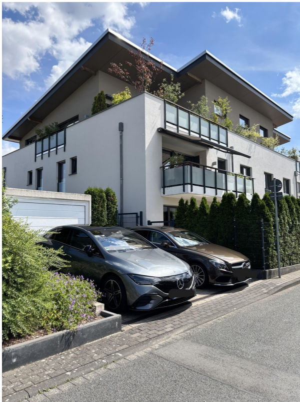
Stellplätze und Garage