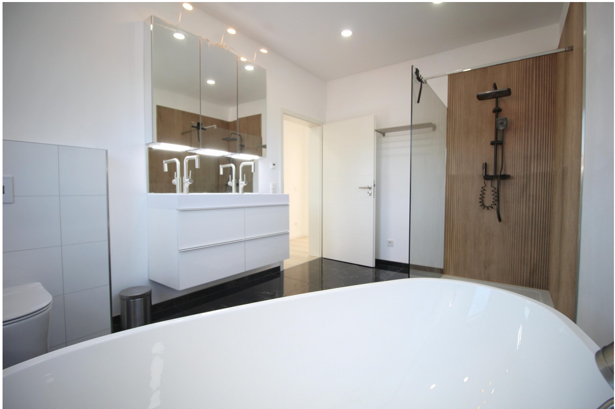
Badezimmer im OG