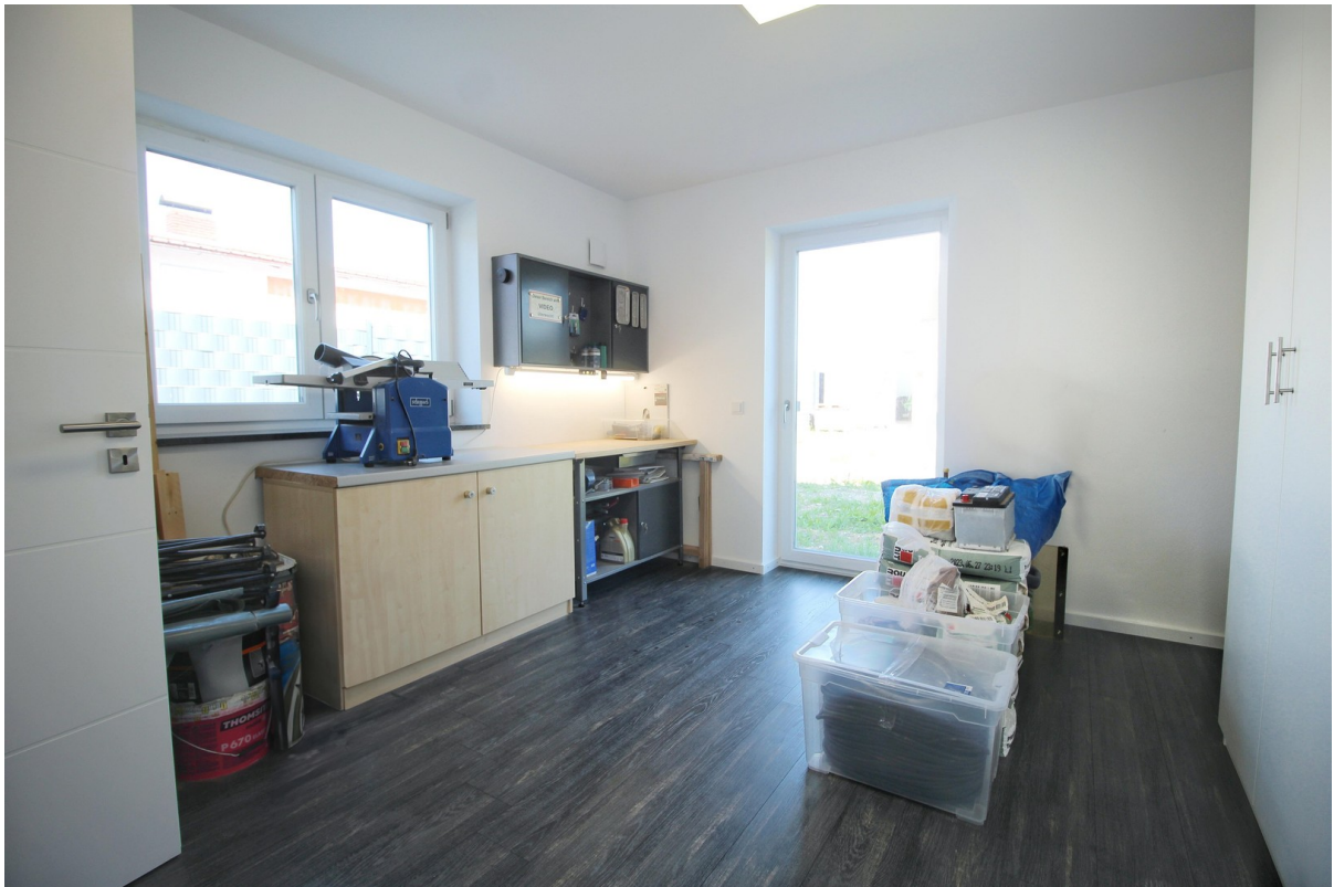
Zimmer 1 im EG