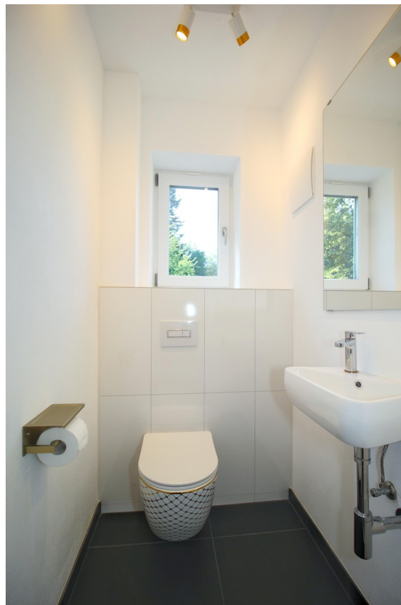
Gäste-WC im EG