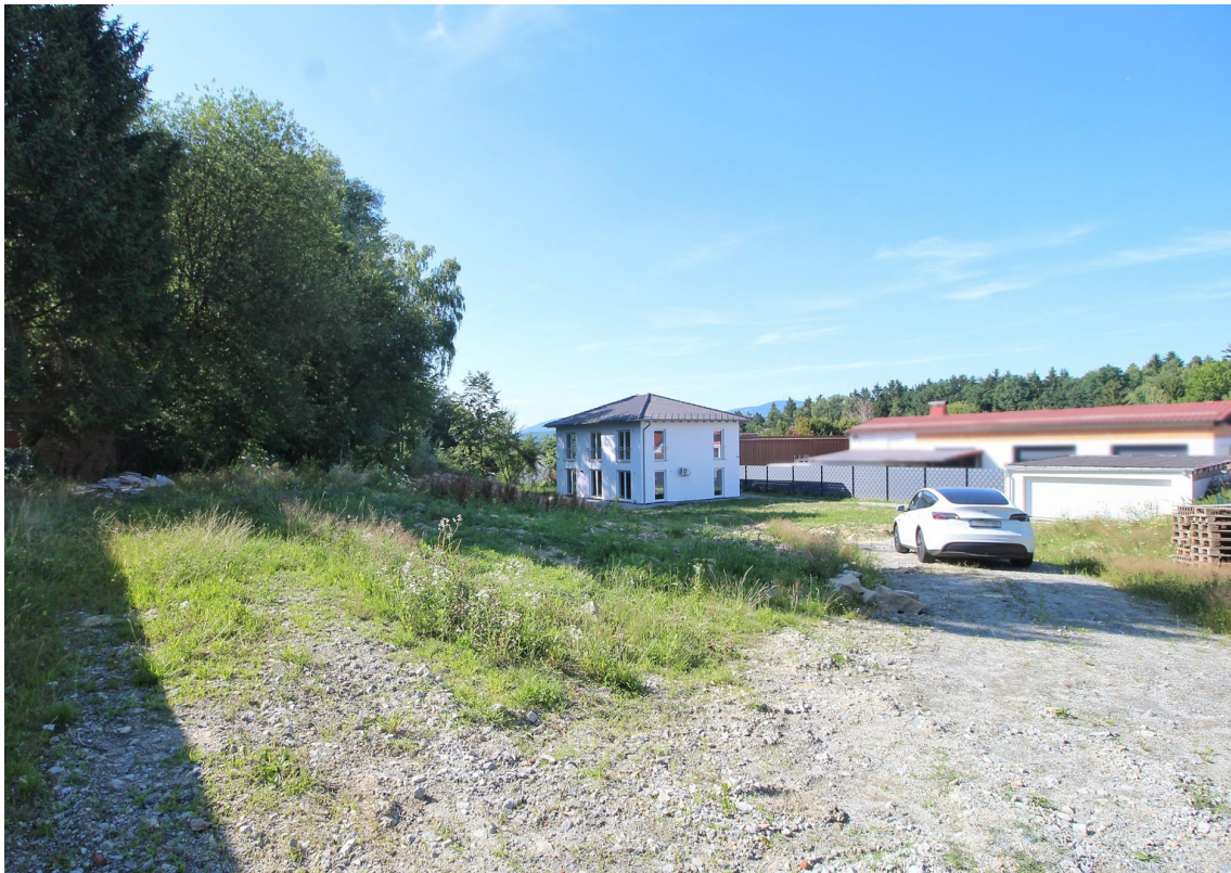
Blick über das Grundstück