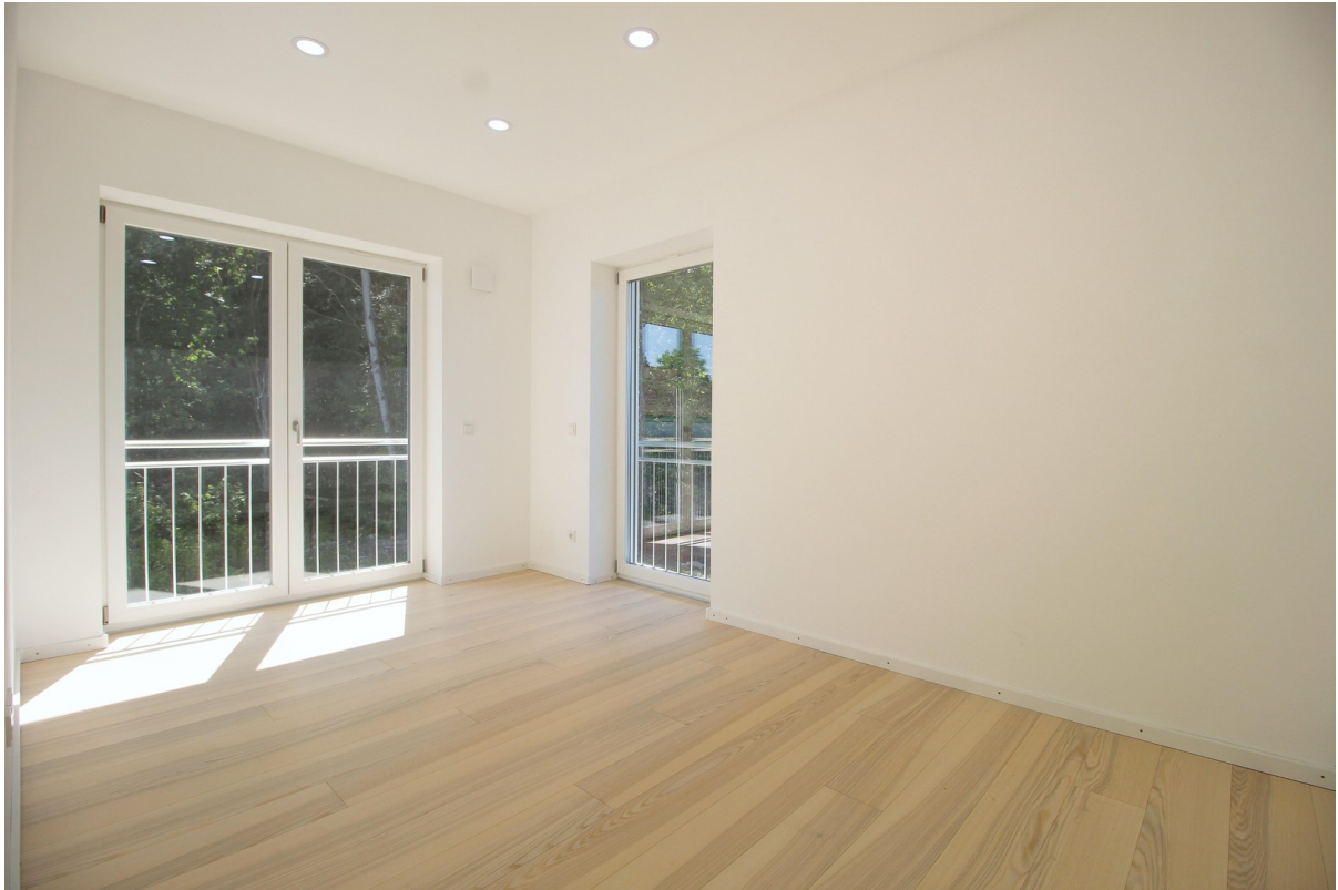
Zimmer 1 im OG