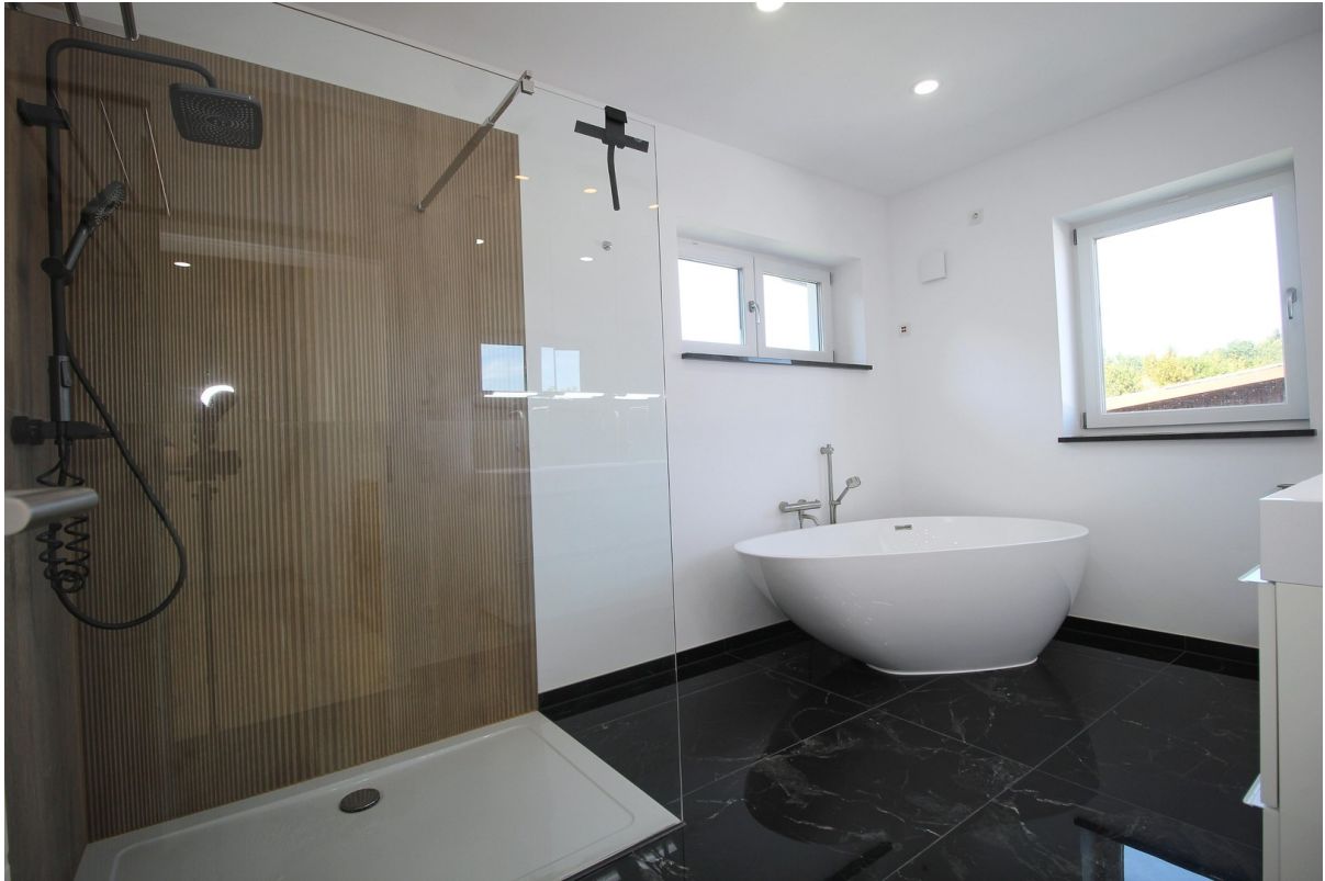
Badezimmer im OG