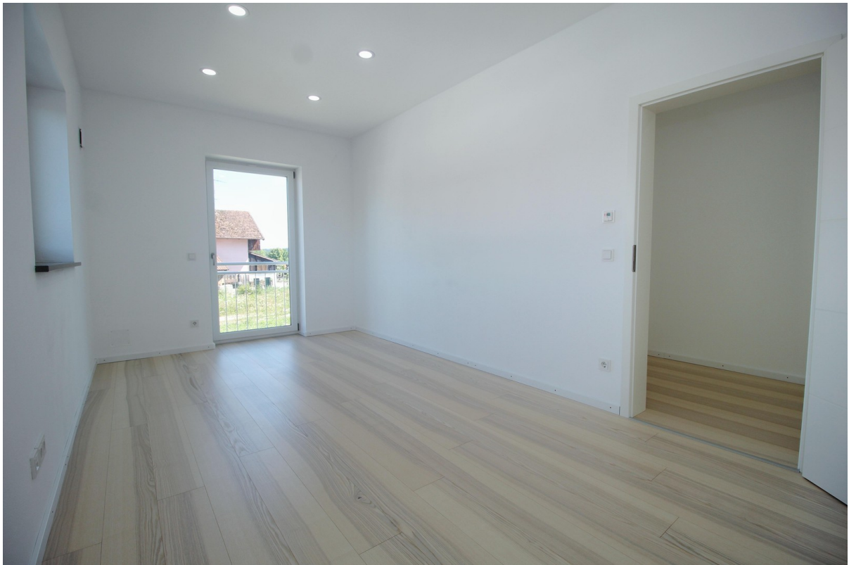
Zimmer 2 im OG