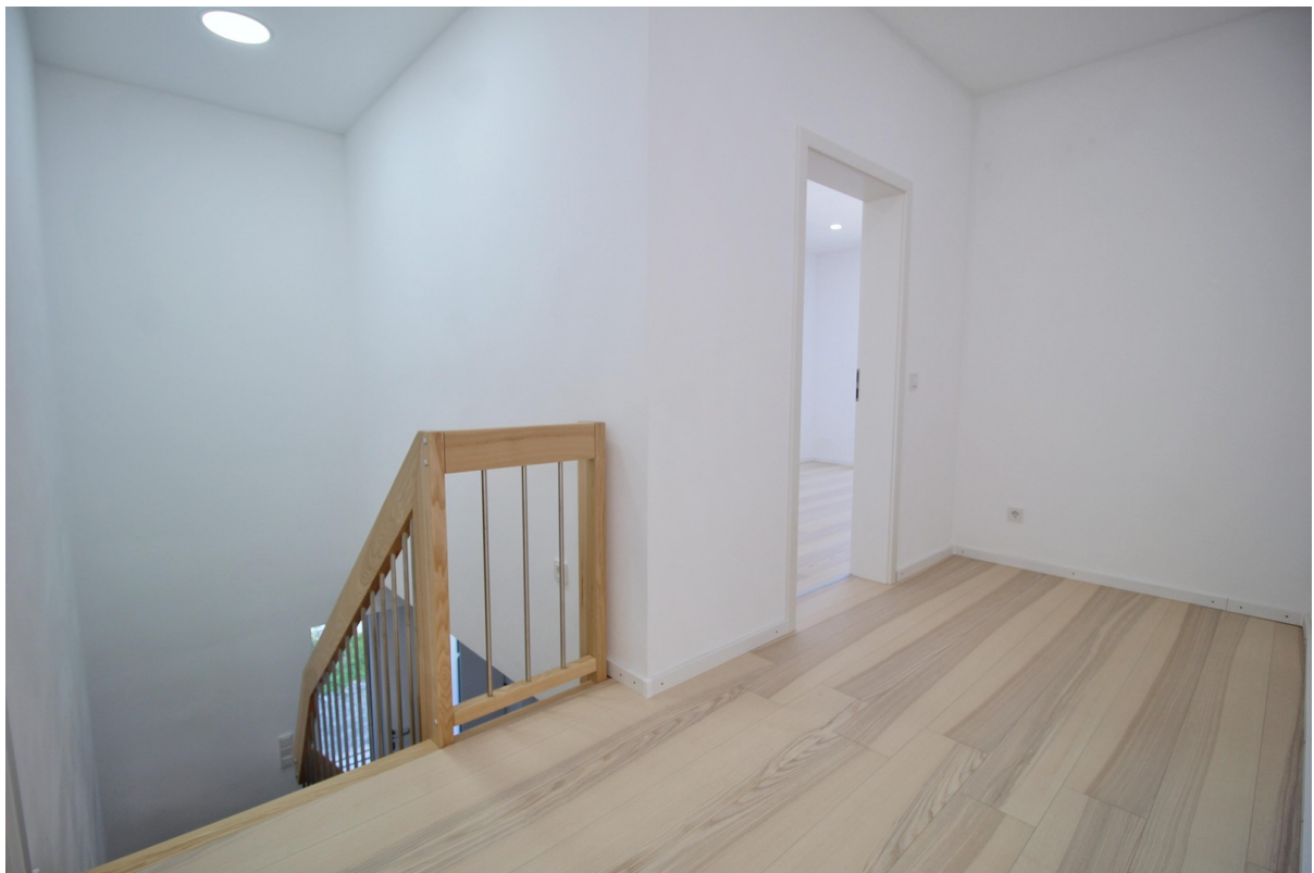
Flur im OG