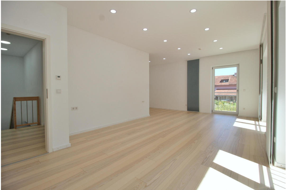
Schlafzimmer im OG