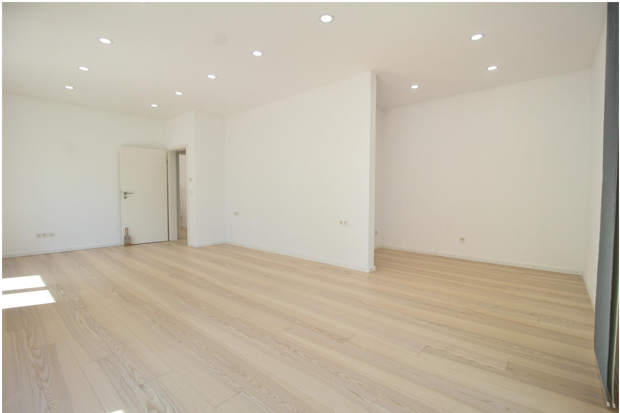
Ankleidebereich im OG