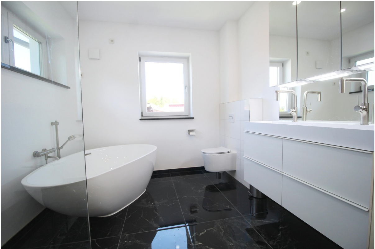
Badezimmer im OG