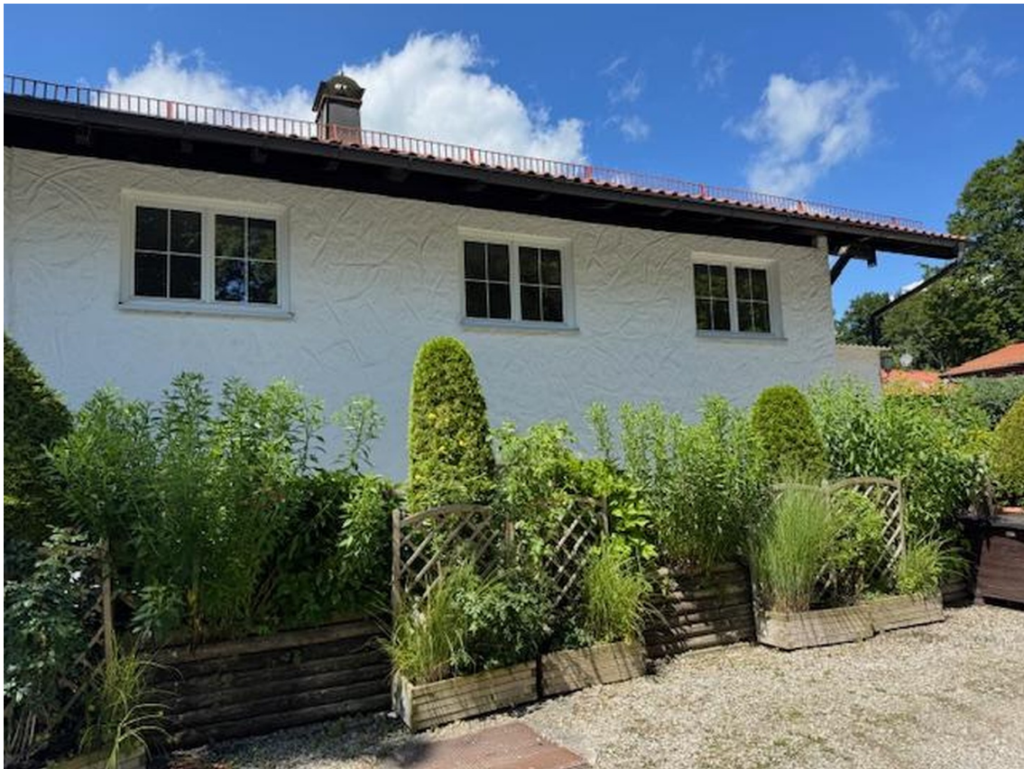
Ansicht von Osten