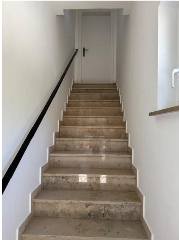
Zugang zum OG