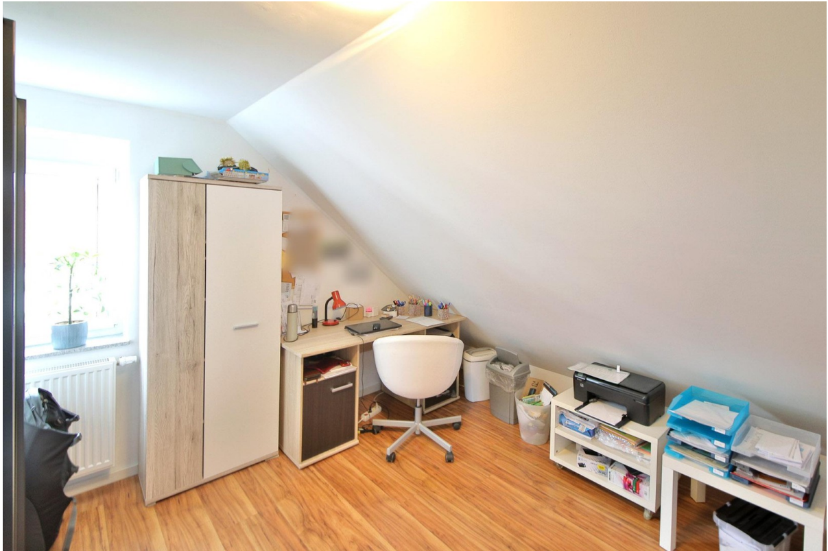
Kinder- / Arbeitszimmer