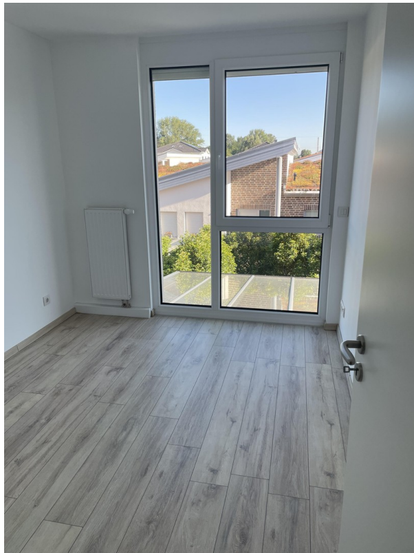
1. OG Zi. 1