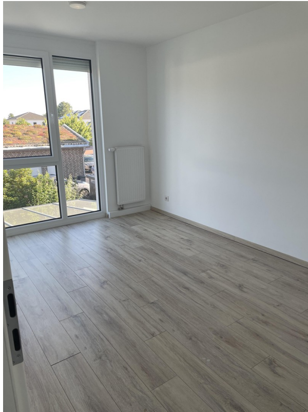
1. OG Zi. 2