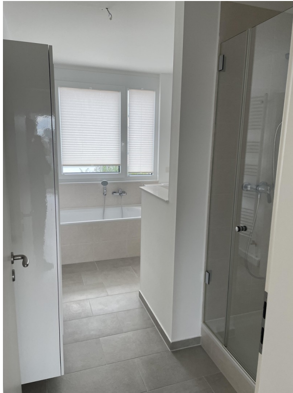
Bad 1. OG