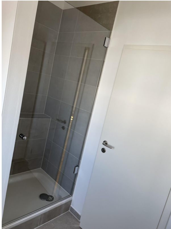
Bad 2. OG