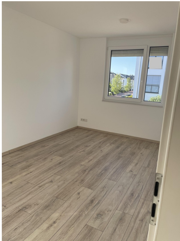
1. OG Zi. 3