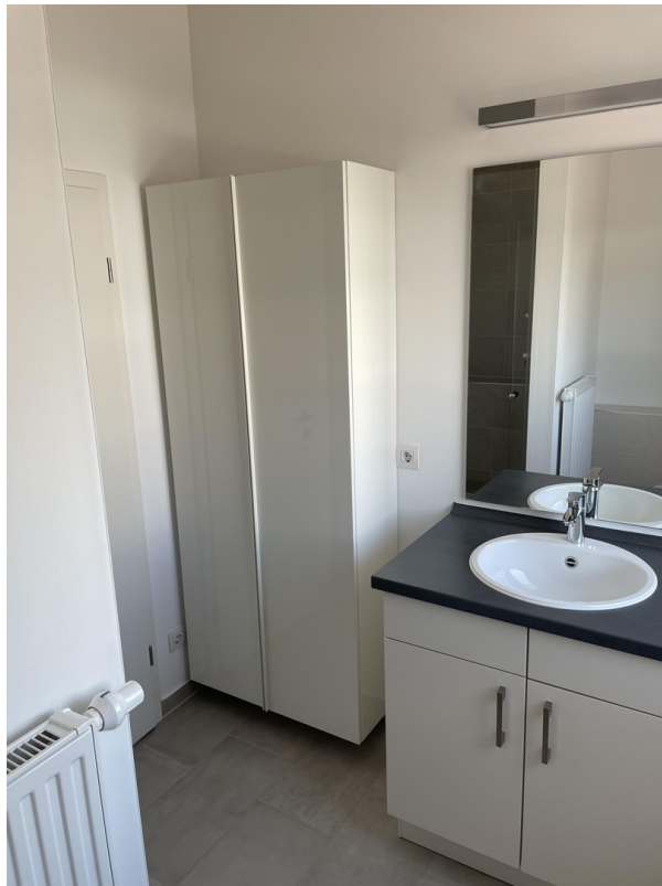
Bad 2. OG