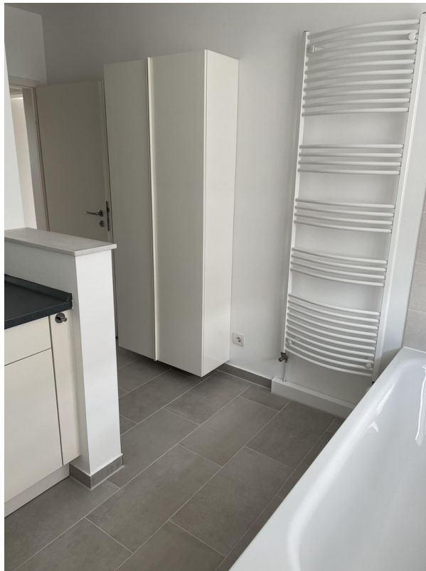
Bad 1. OG