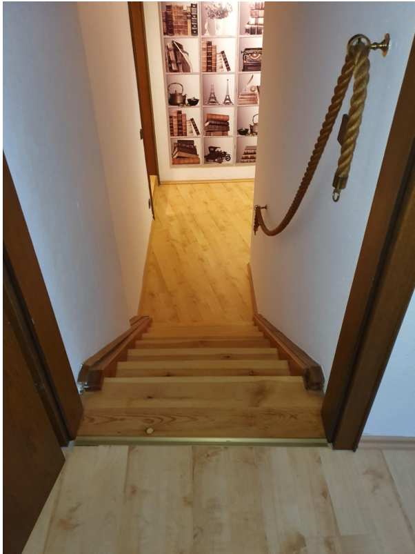
Abgang von Arbeitszimmer