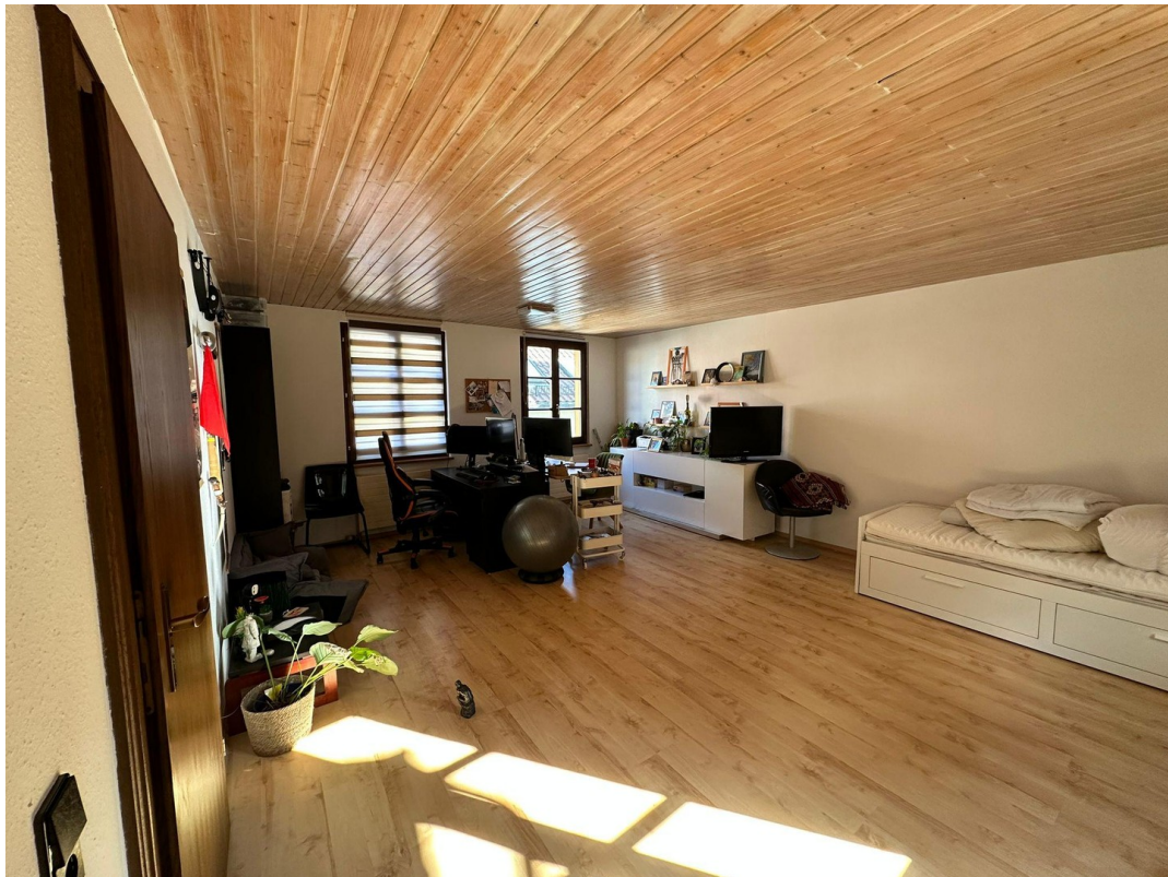
Arbeitszimmer / Gästezimmer