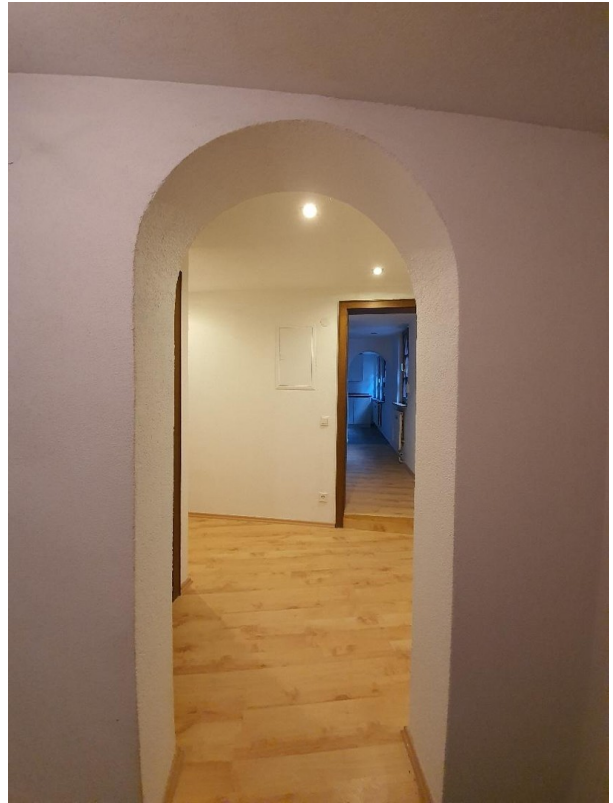
Flur mit Waschmaschinenraum