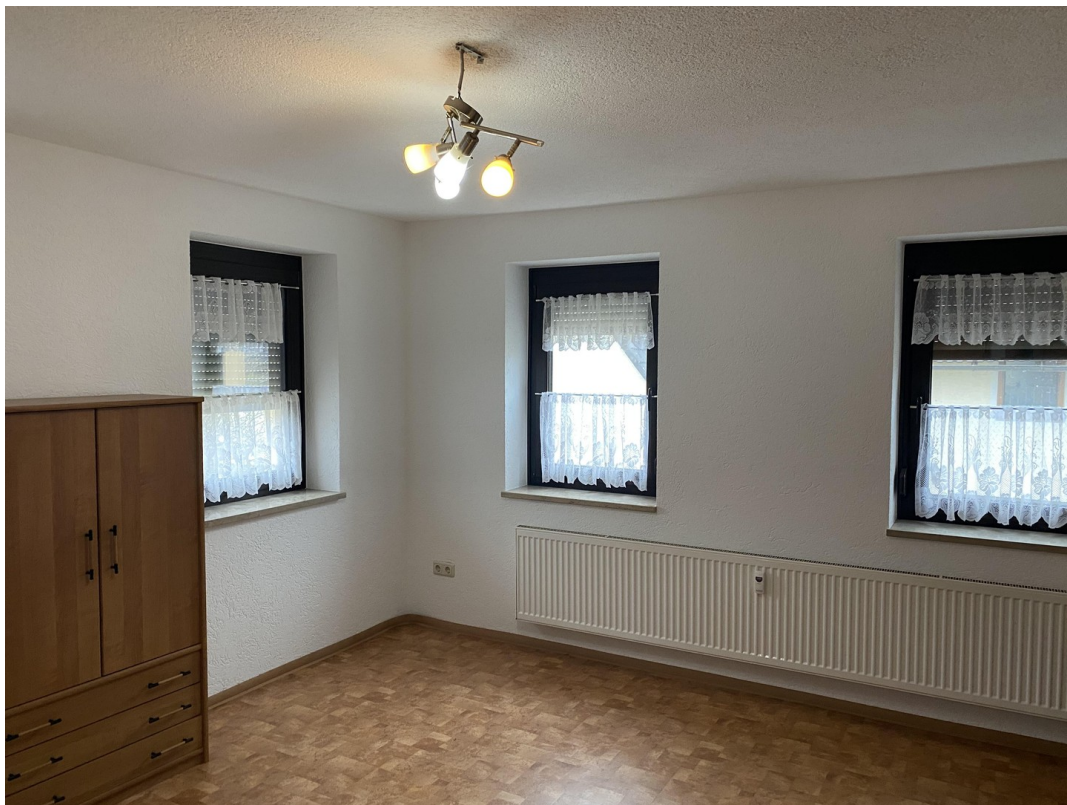
2. Wohnung OG Wohnzimmer