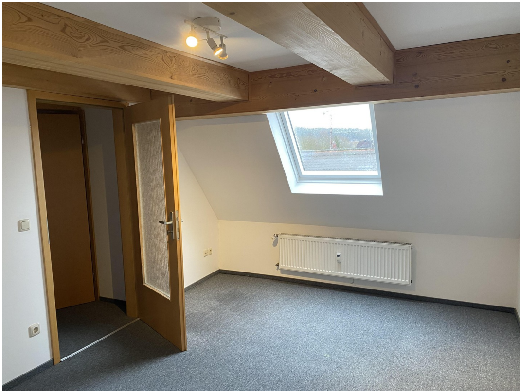
1. Wohnung OG Kinderzimmer