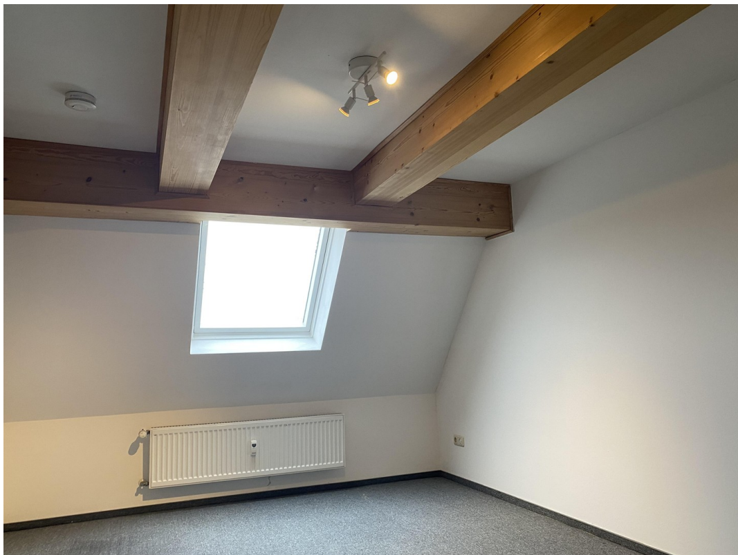
1. Wohnung OG Kinderzimmer