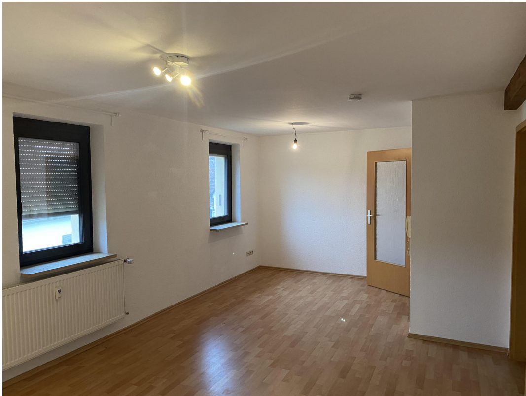
1.Wohnung OG (90qm) Wohnzimmer