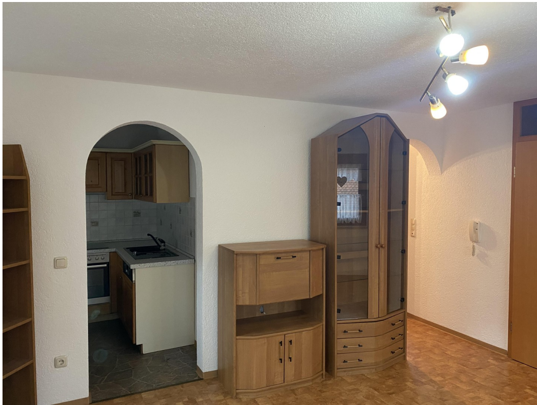
2. Wohnung OG 50qm Wohnzimmer