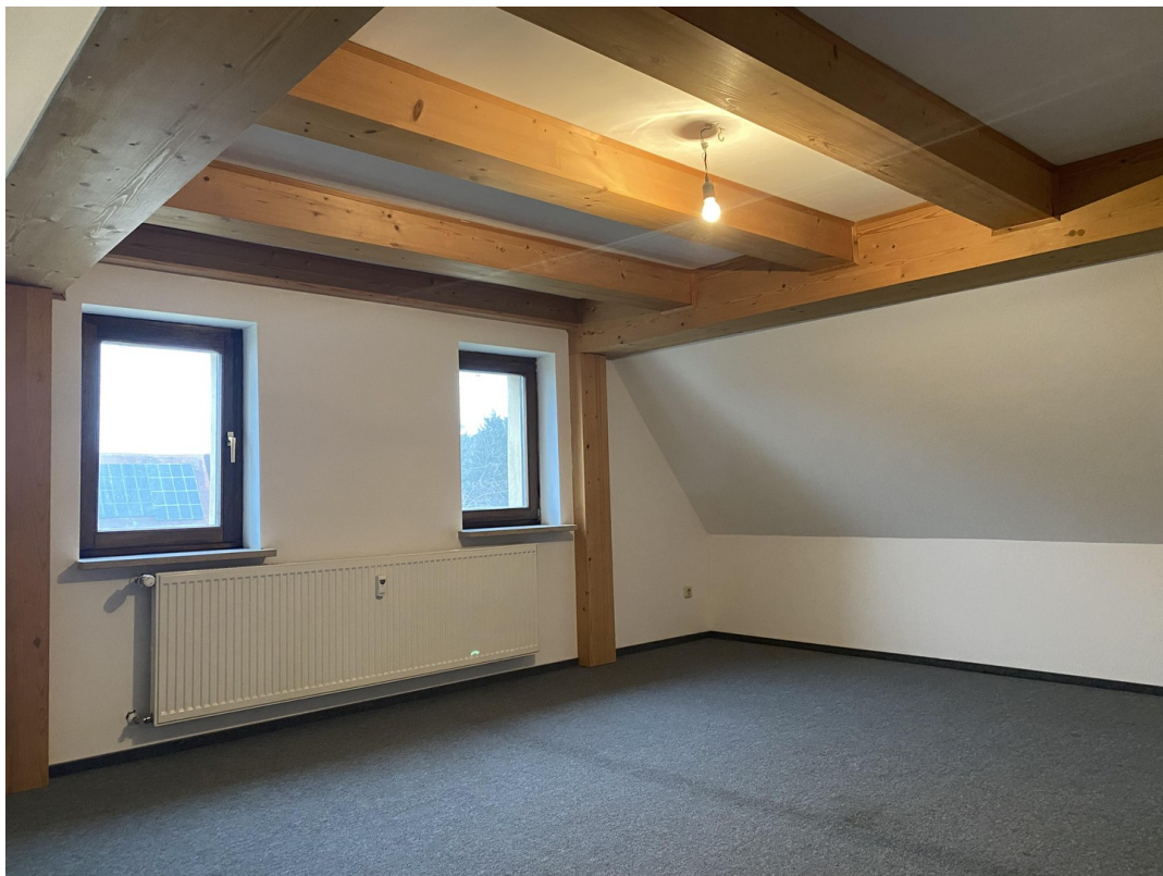
1. Wohnung OG Schlafzimmer