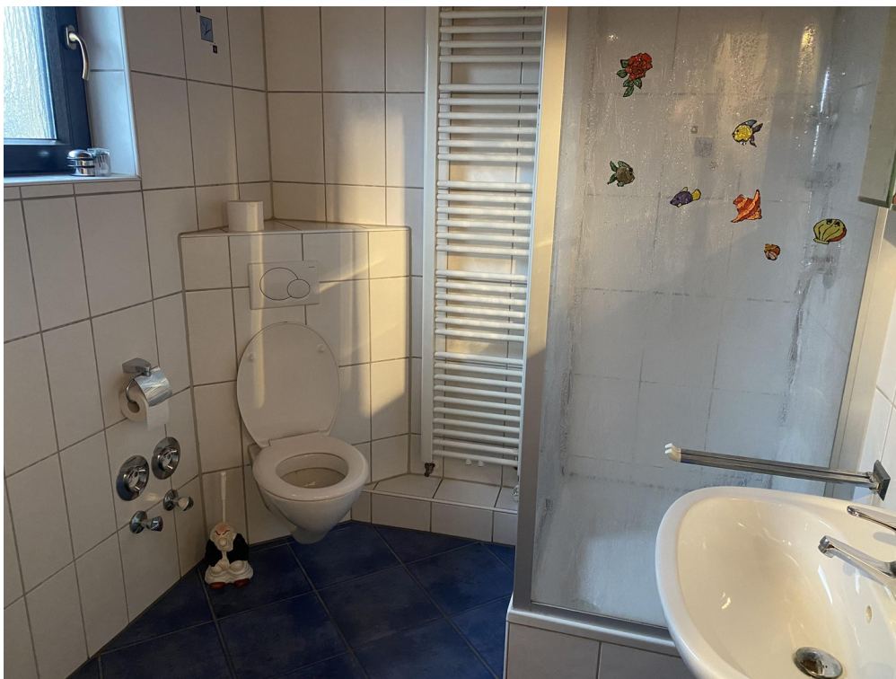
2. Wohnung OG Bad