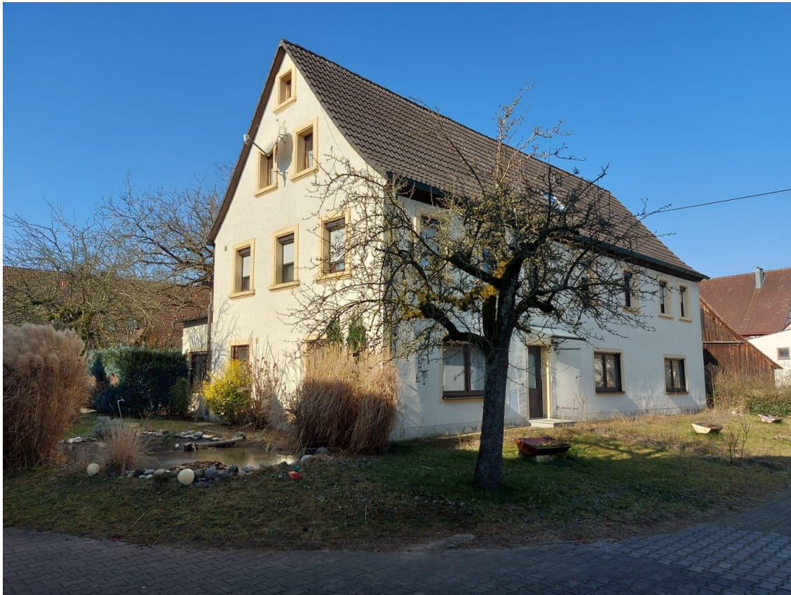
Hausansicht - Süd/Ost