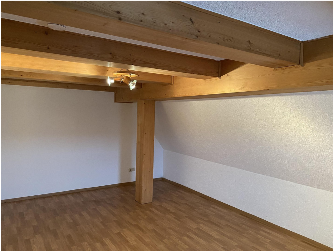
2. Wohnung OG Schlafzimmer