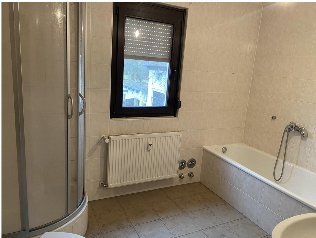
1.Wohnung OG Bad