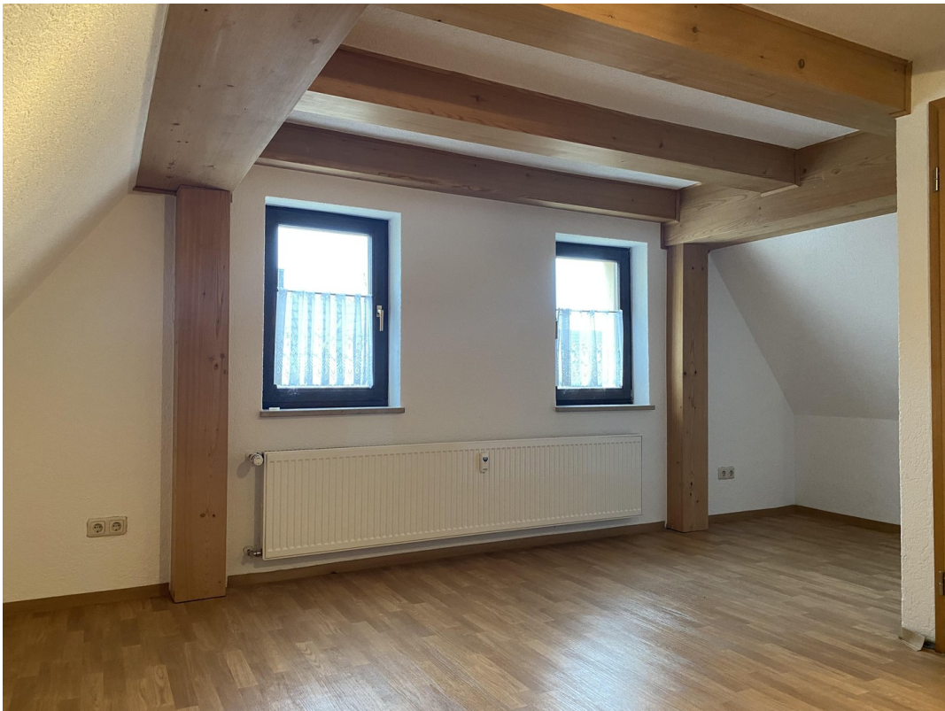
2. Wohnung OG Schlafzimmer