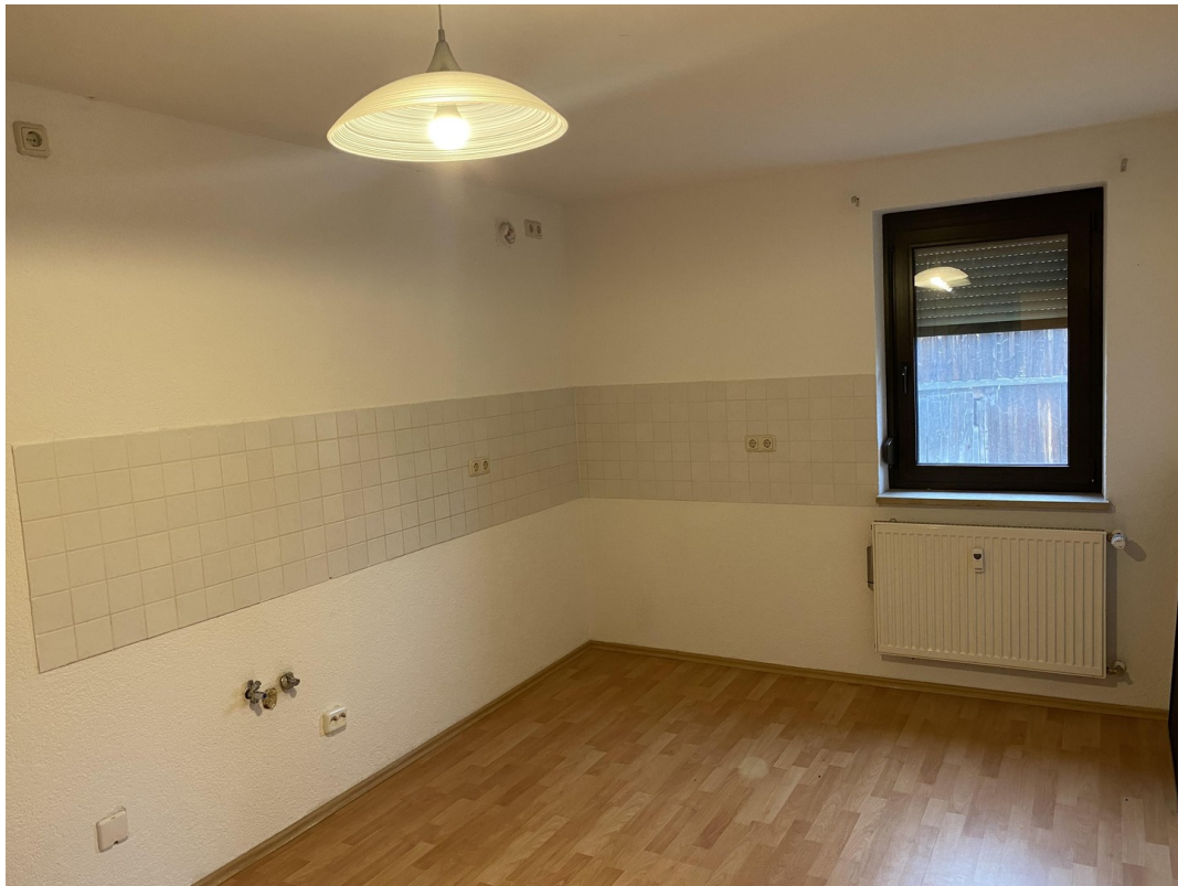
1. Wohnung OG Küche