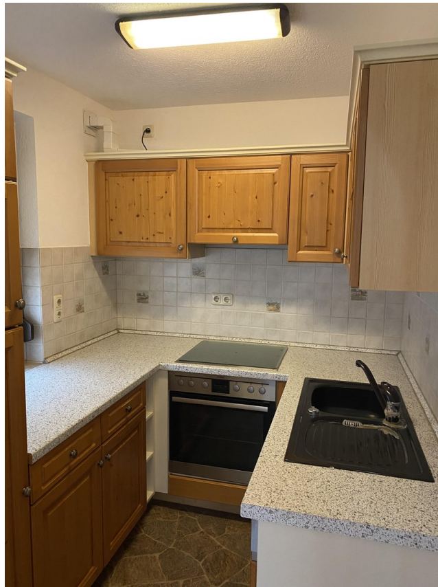
2. Wohnung OG Küche