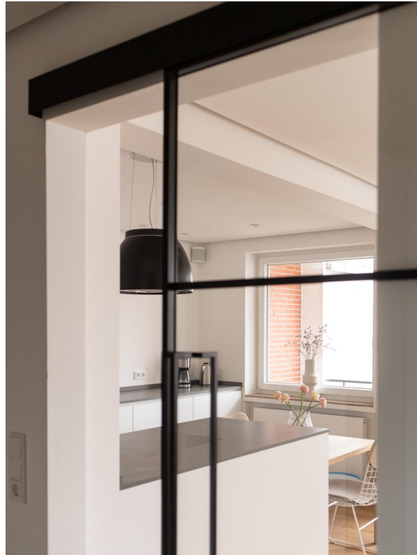
Glastür ins Wohnzimmer