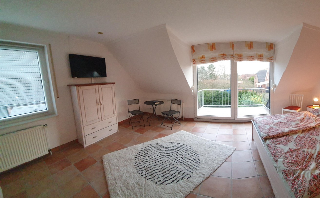
Elternschlafzimmer mit Balkon