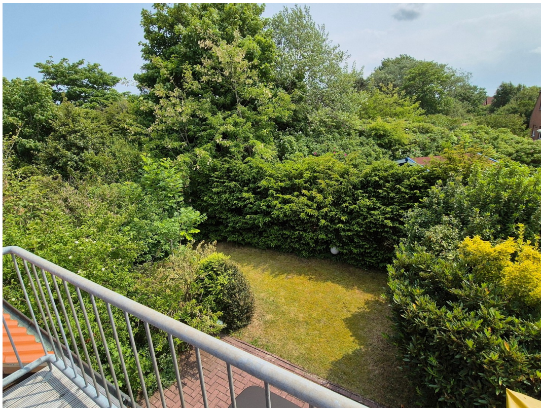
Gartenansicht vom Balkon