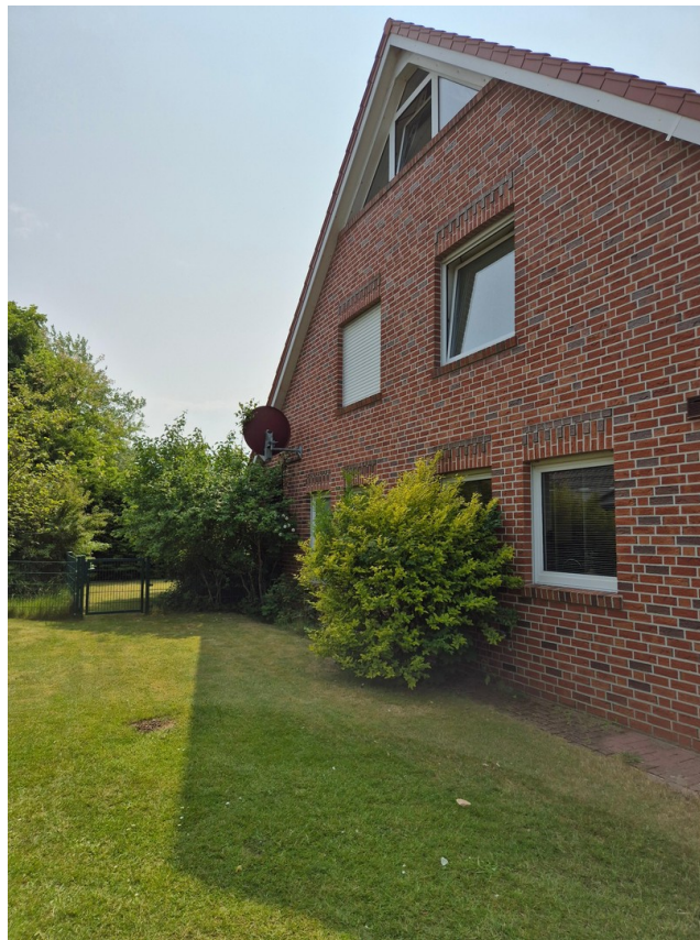
Seitenansicht mit Zugang zum G