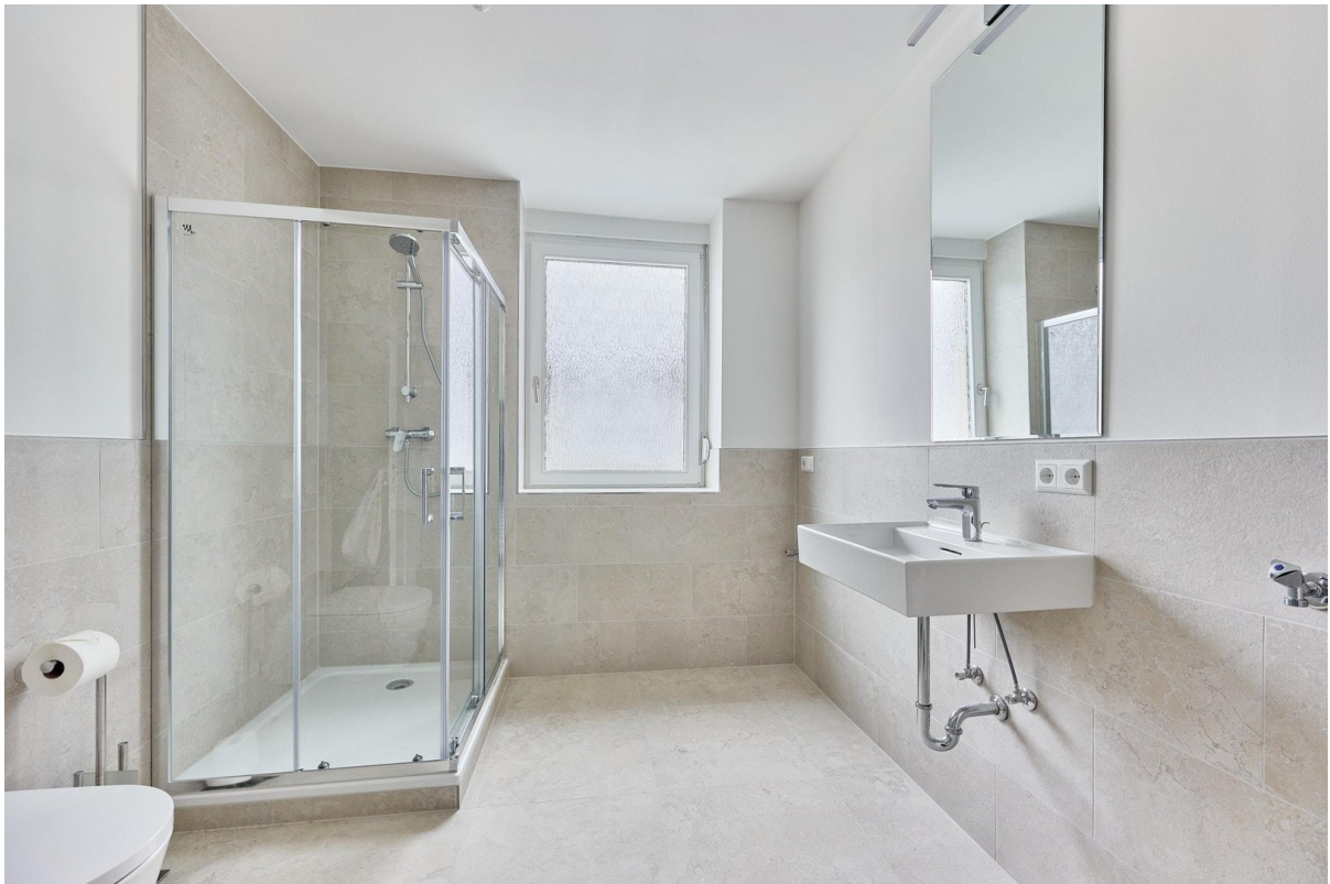
Tageslichtbad mit Handtuchheiz