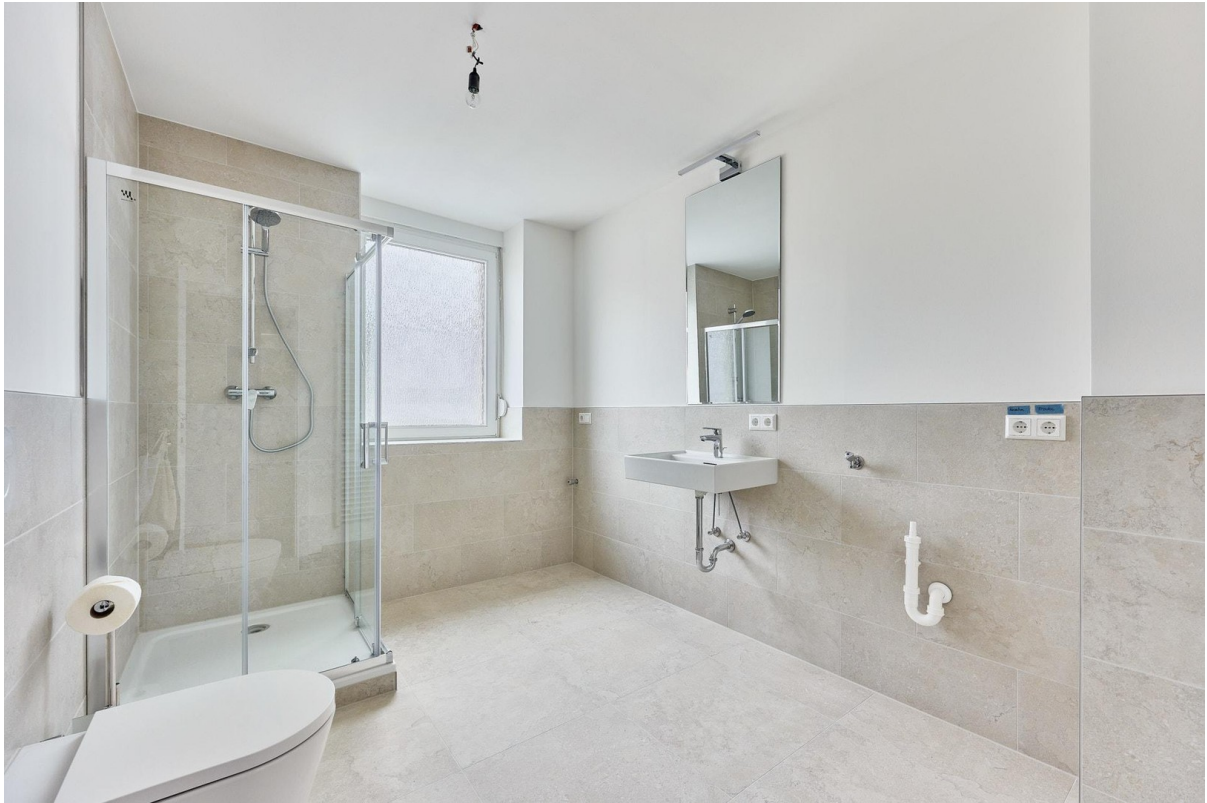
Tageslichtbad mit Handtuchheiz