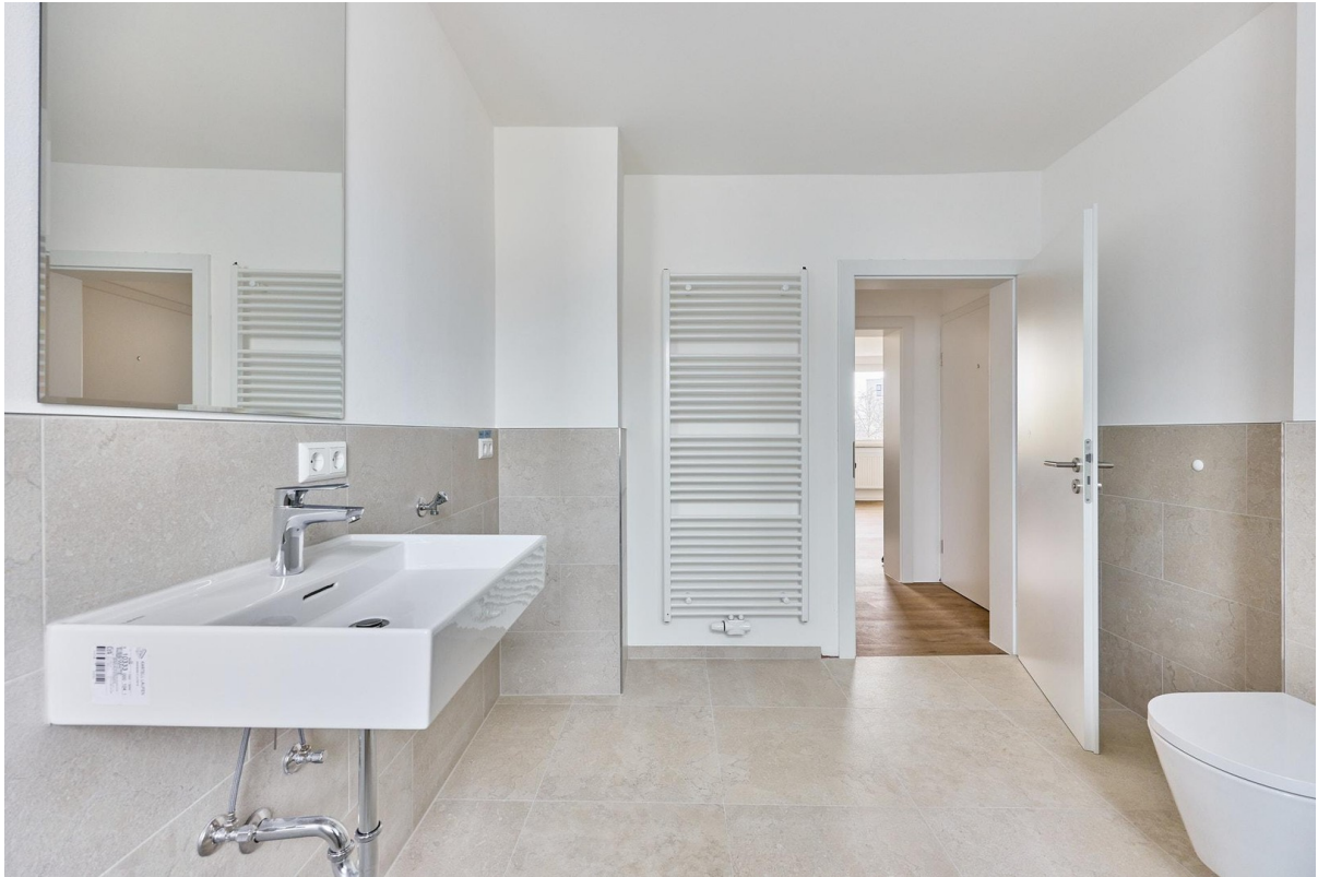
Tageslichtbad mit Handtuchheiz