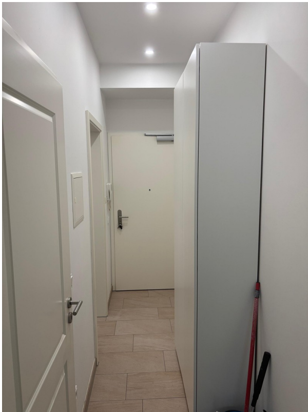
Flur mit Gardarobenschrank