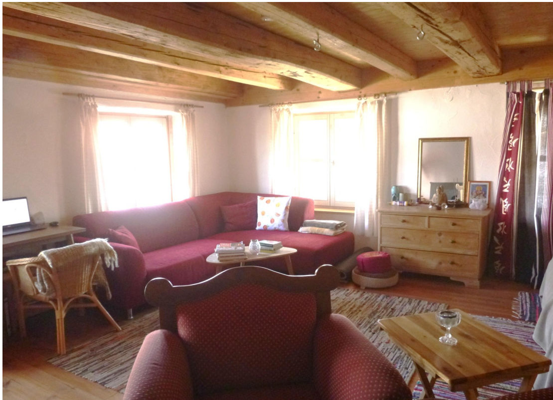
Zimmer, 1. Stock