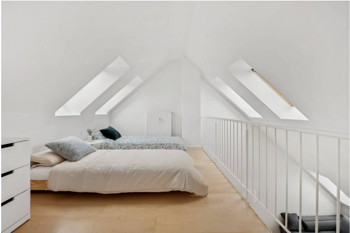
Galerie mit 2 Einzelbetten