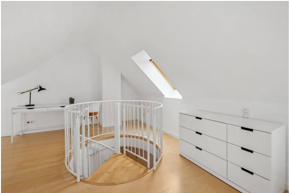
Galerie mit Treppe