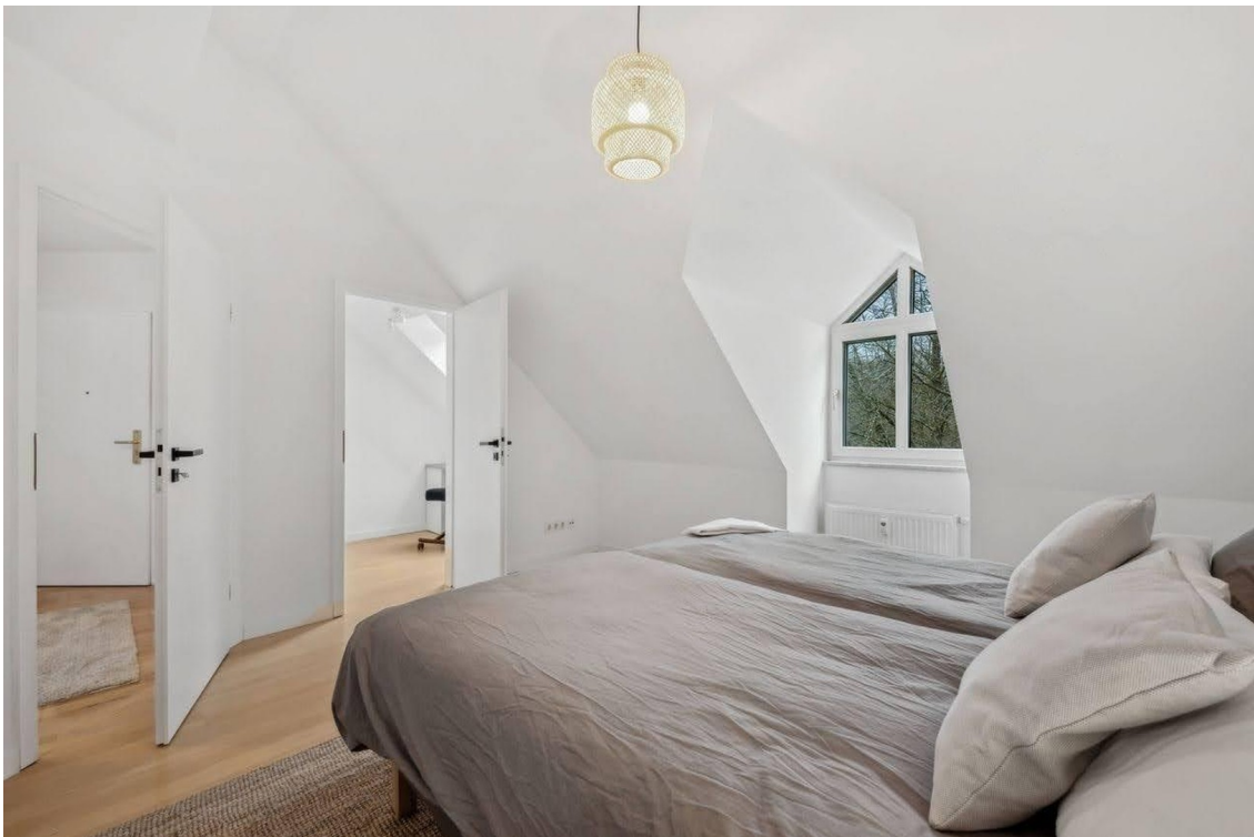
Schlafzimmer mit Fenster