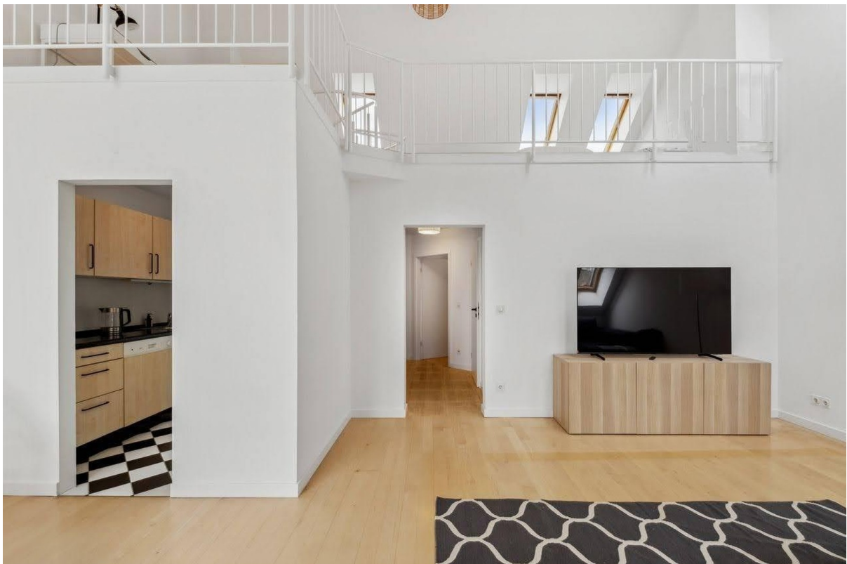
Wohnzimmer mit TV