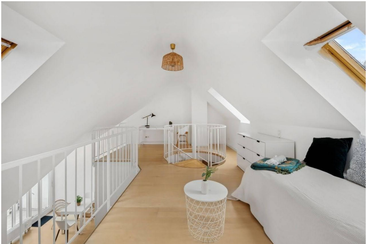
Galerie mit Arbeitsplatz