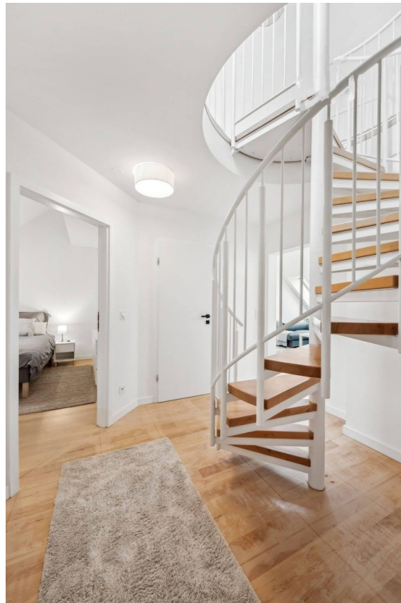
Flur mit Gallerietreppe