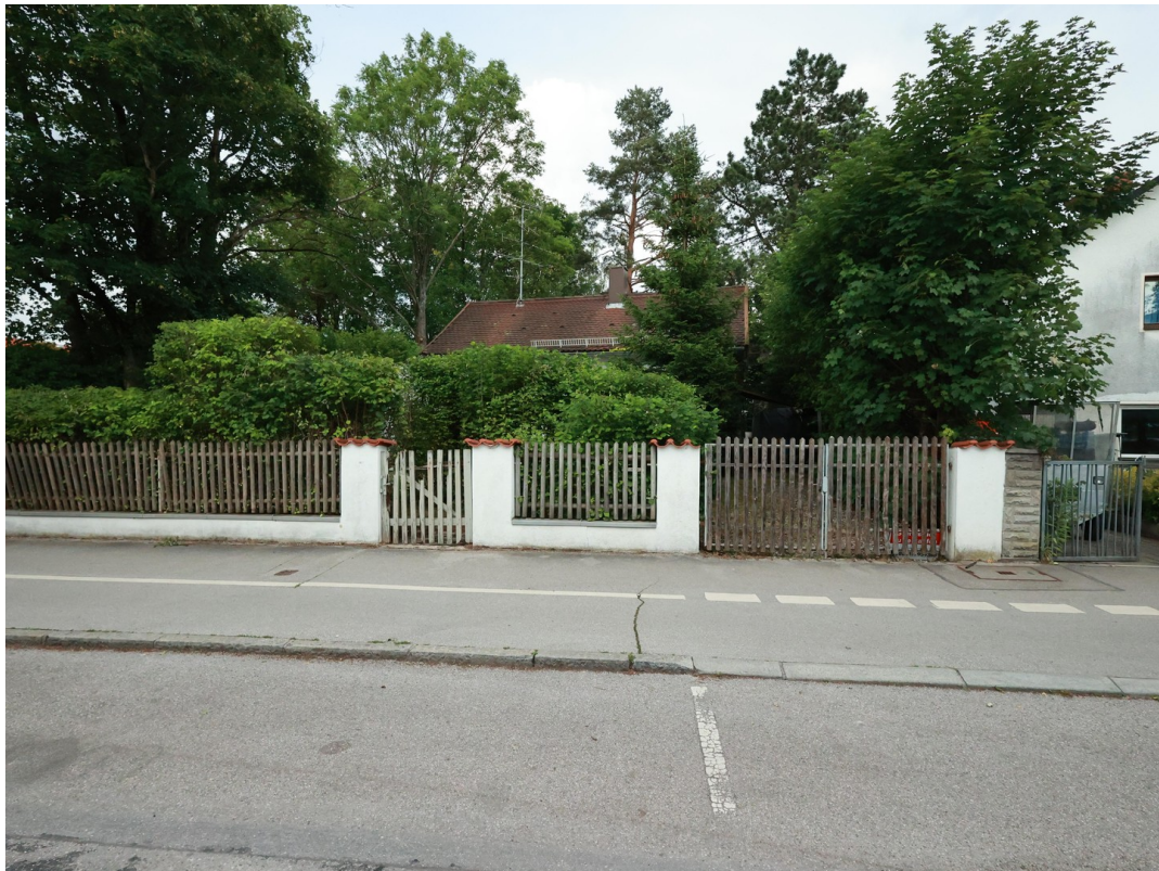
Ansicht von der Straßenseite