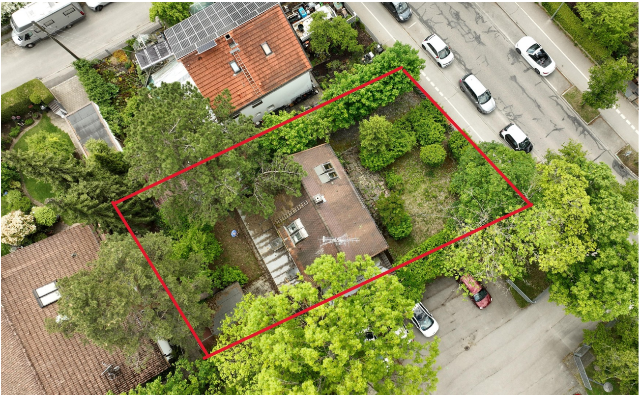
Neubau nach § 34 BauGB möglich