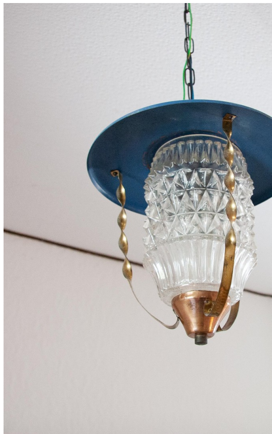
Detail Diele OG