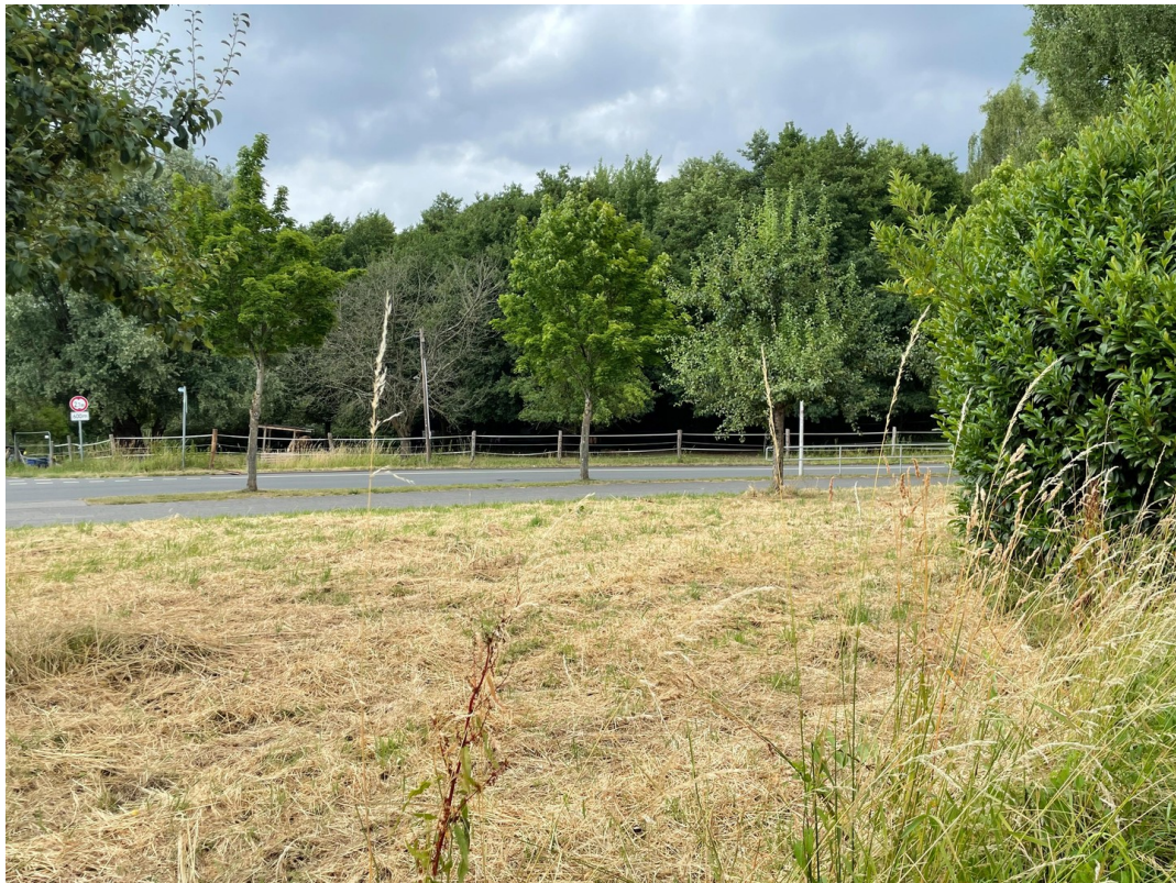
Hinter dem Haus