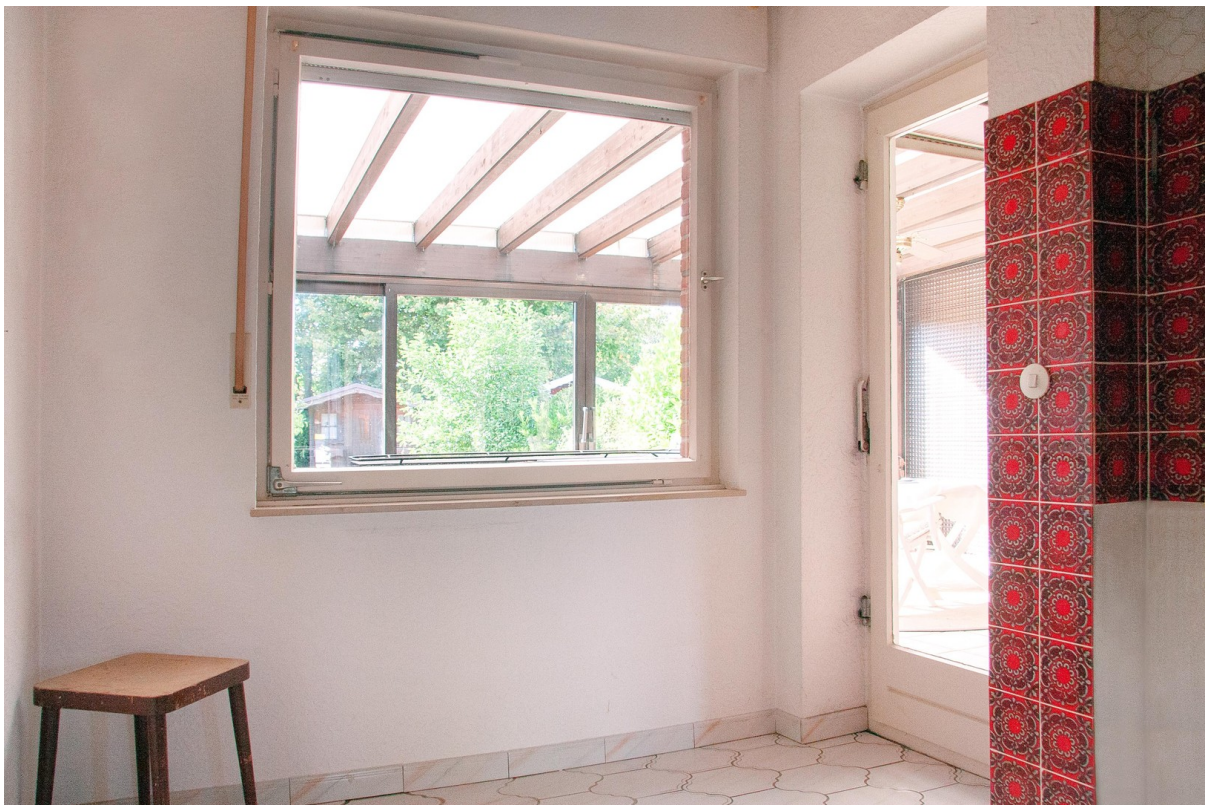
Küche - Blick Wintergarten