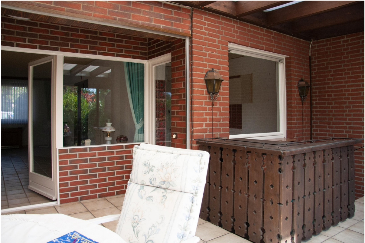
Wintergarten - Blick WZ/Küche