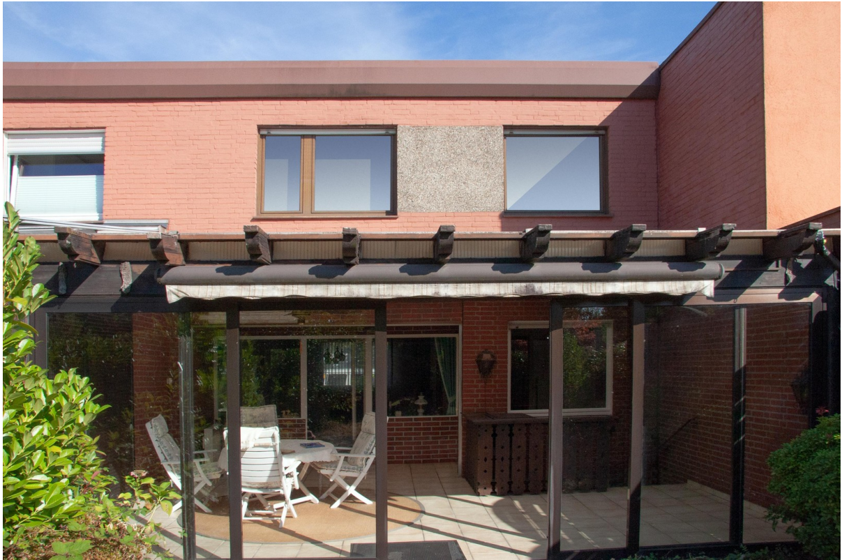
Blick aus dem Garten