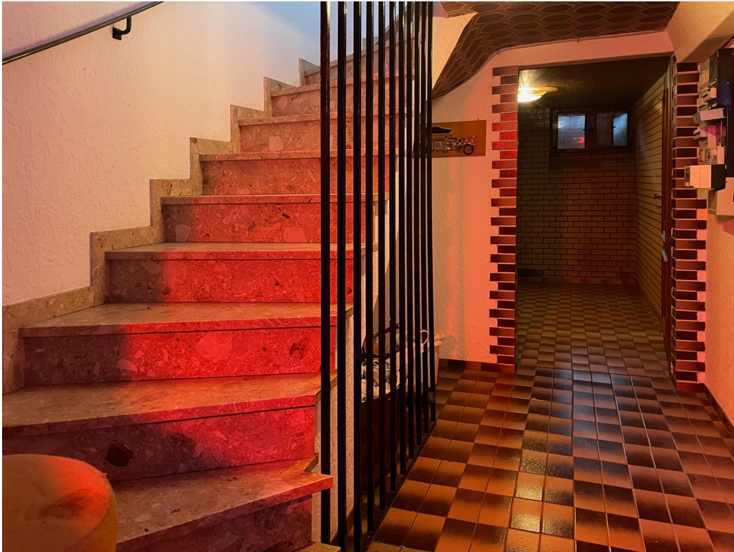
Keller-Diele – Blick v.d. Bar