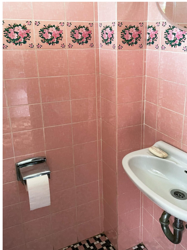
Detail Gäste WC