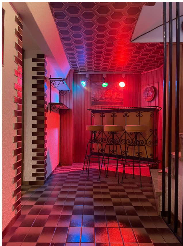
Keller-Diele mit Bar