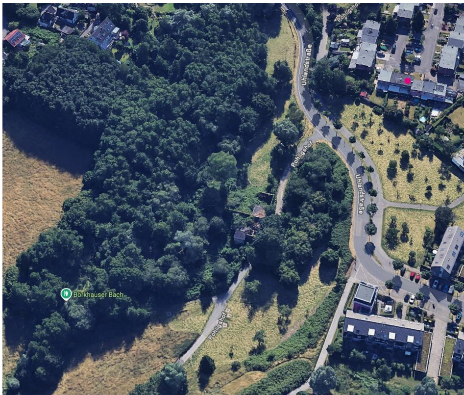
Objektlage mit Freizeitwert