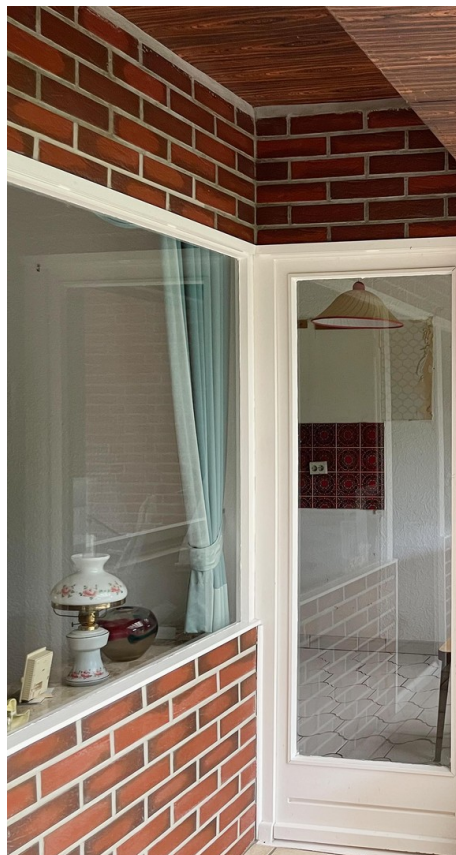
Blick vom WG in die Küche