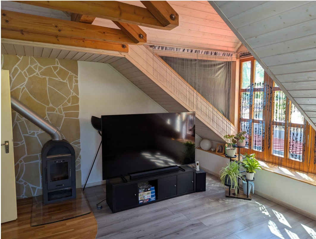
Wohnzimmer mit Kaminofen