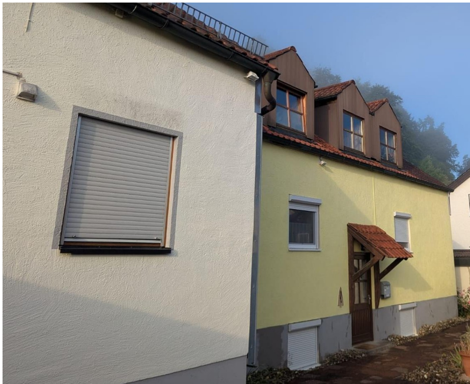
Eingang im Hinterhof