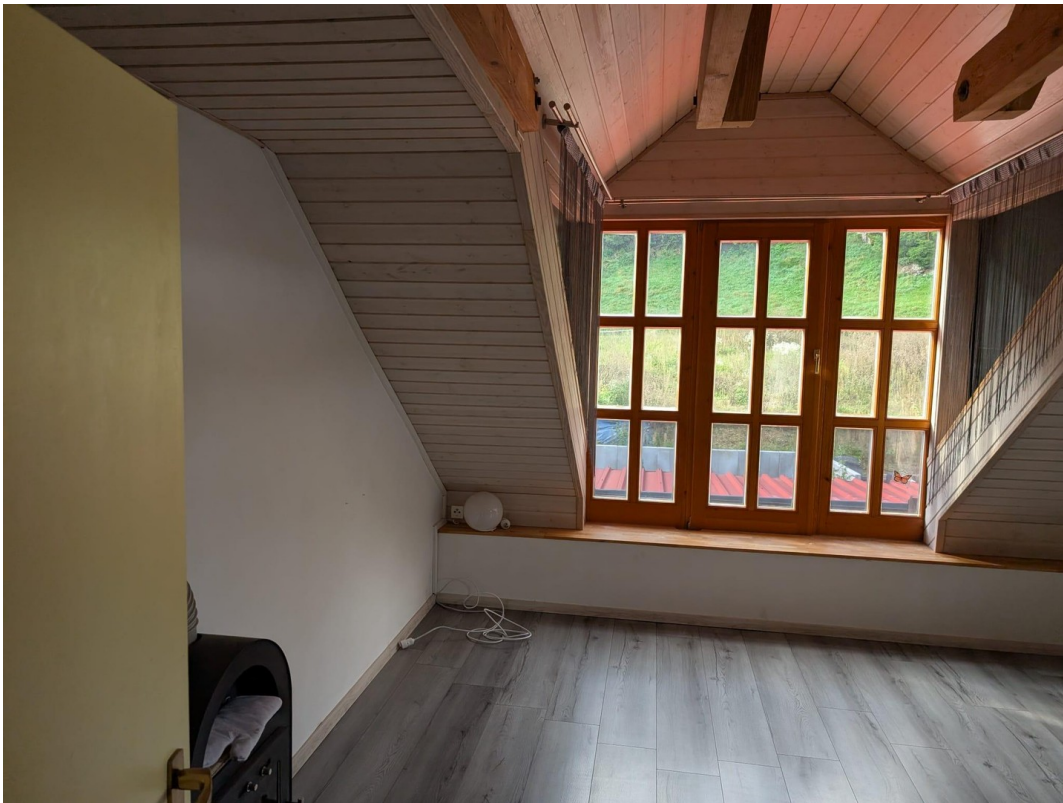
Wohnzimmer mit großer Gaube