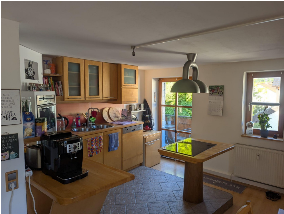
Küche mit Herd