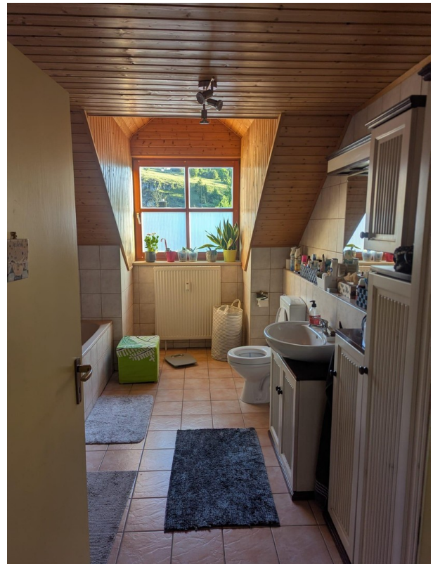
Badezimmer mit Einbauschränken