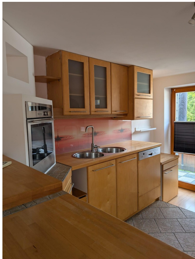
Küche mit Einbauschränken