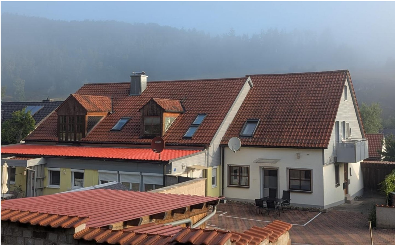
Außenansicht - Süd