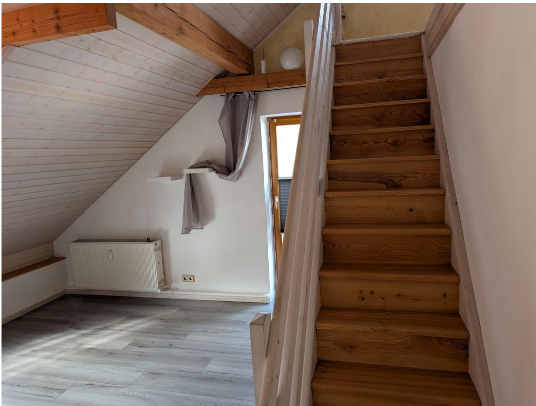
Wohnzimmer Treppe zur Galerie