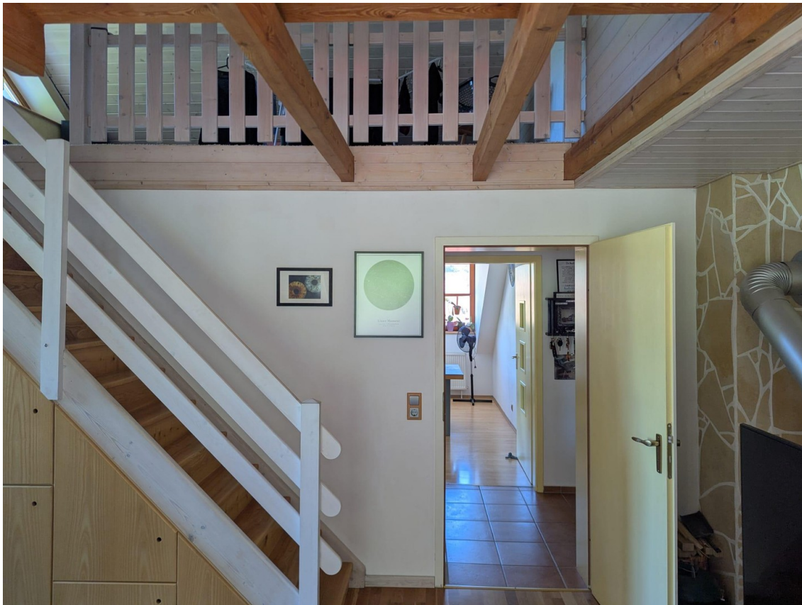
Wohnzimmer mit Galerie