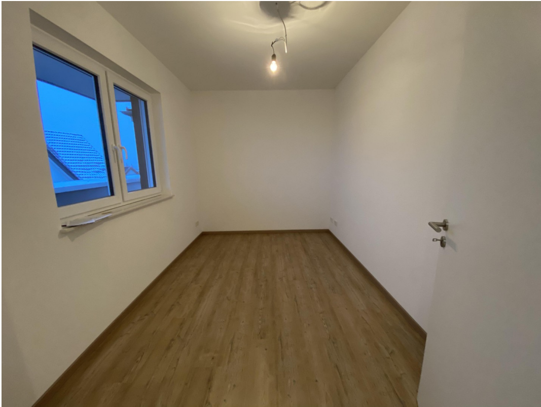
Kinderzimmer oder Büro