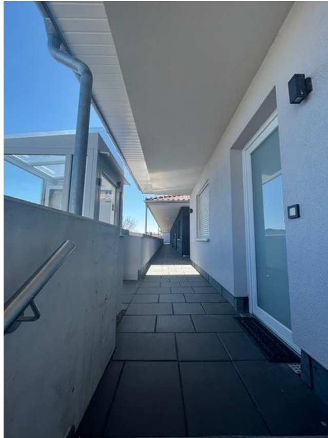
Laubengang zu den Wohnungen