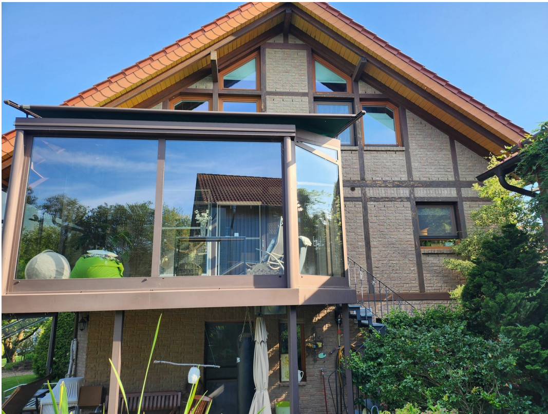
Wintergarten im Süden