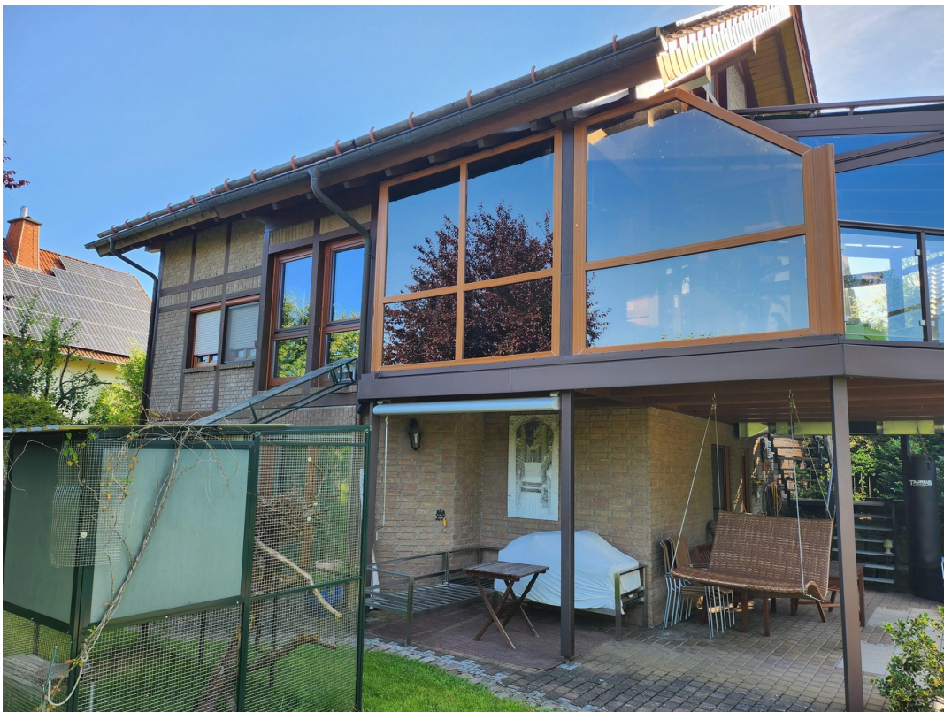
Südwest, unten Schiebetüren