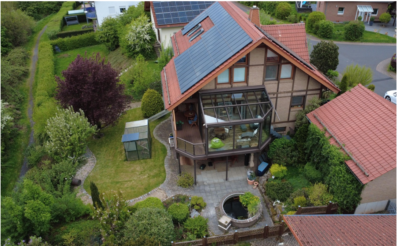
Südansicht mit Wintergarten