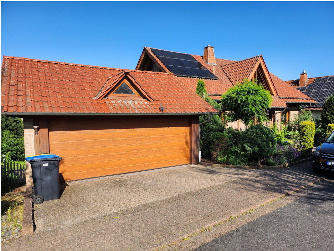
Einfahrt vom Osten