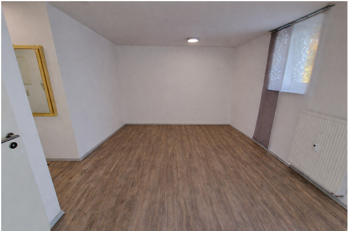
Wohn- und Schlafbereich