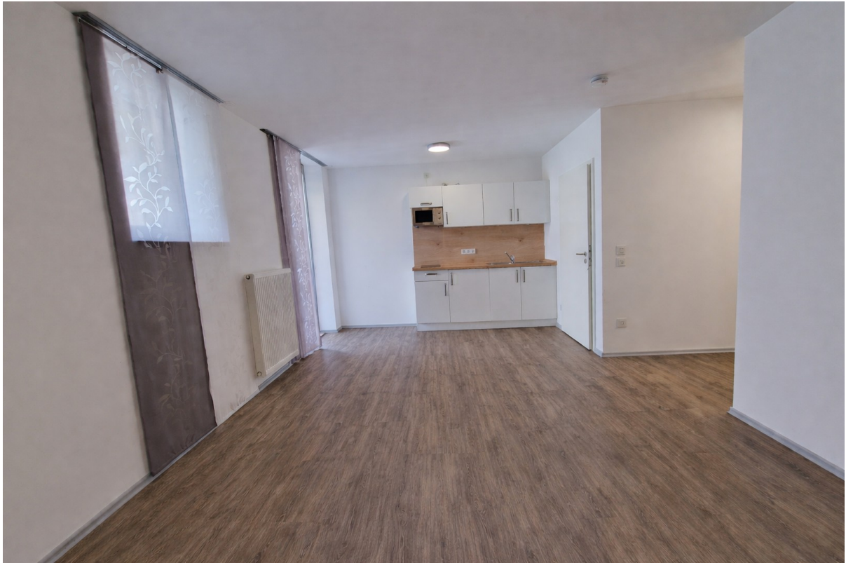
Küche und Wohnbereich