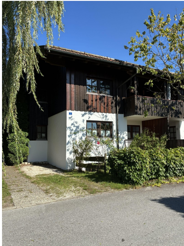
Westseite Wohnung Außenansicht