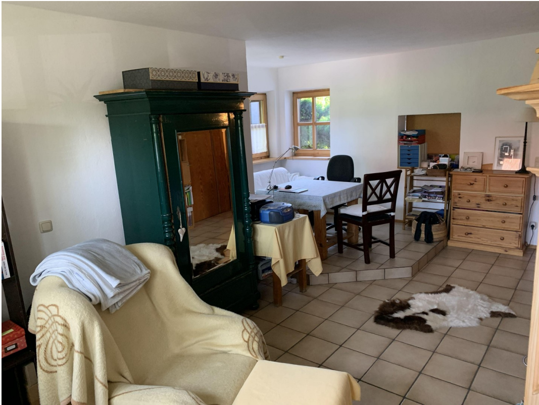
Wohnraum mit Erker