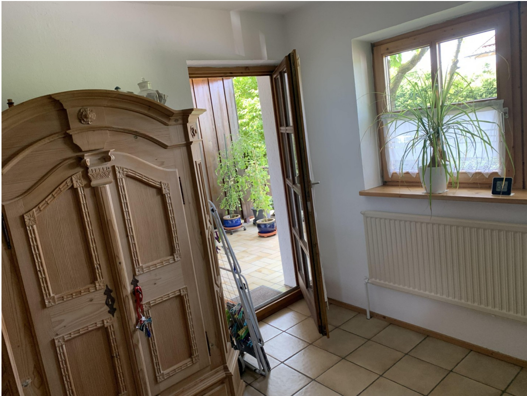
Ausgang zur Terasse