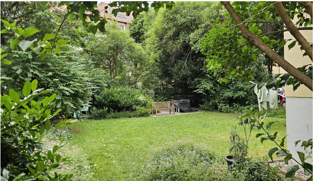
Garten des Hauses