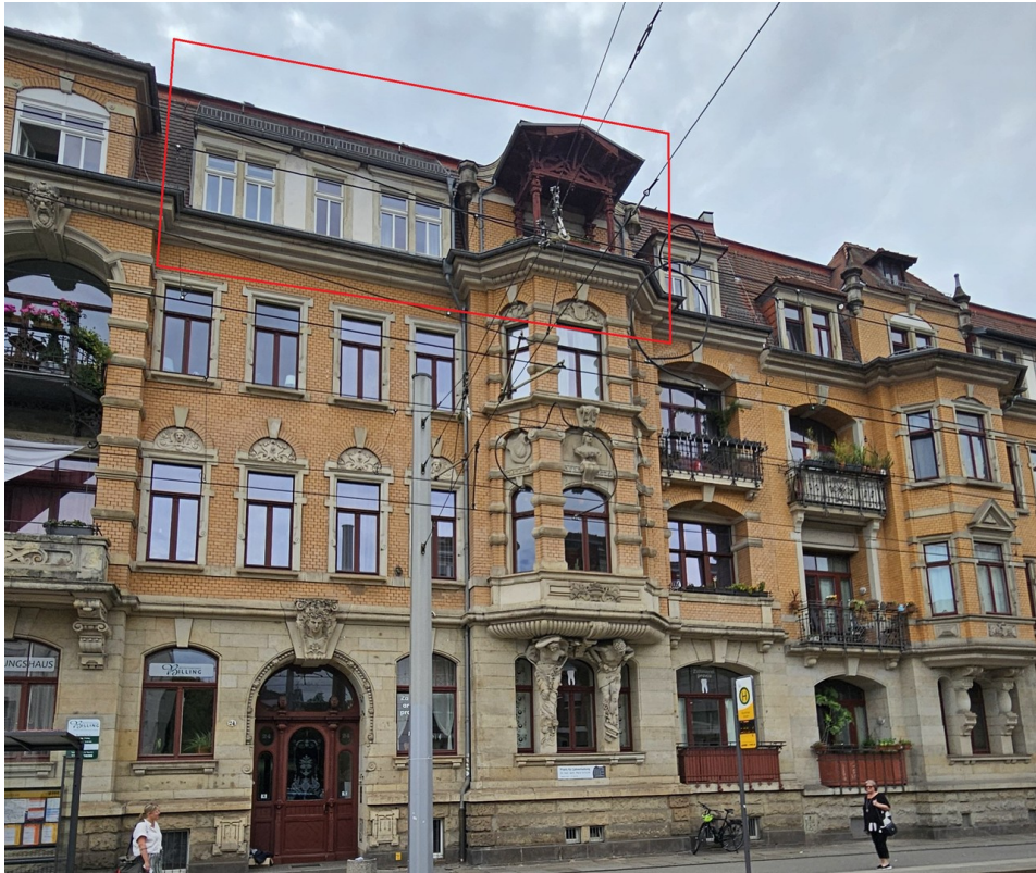
Lage Wohnung im Haus