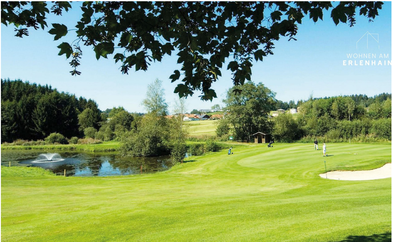
Freizeit - Golf