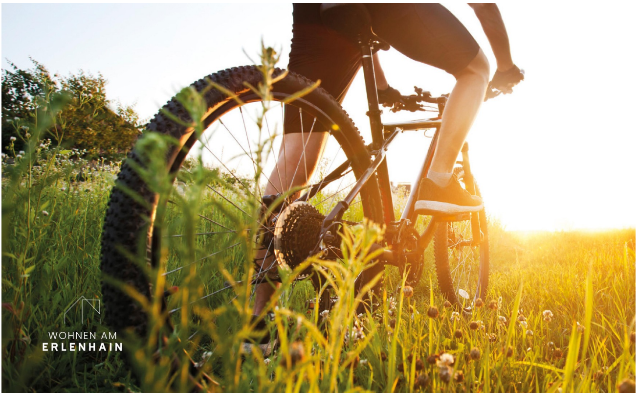
Freizeit - Radsport