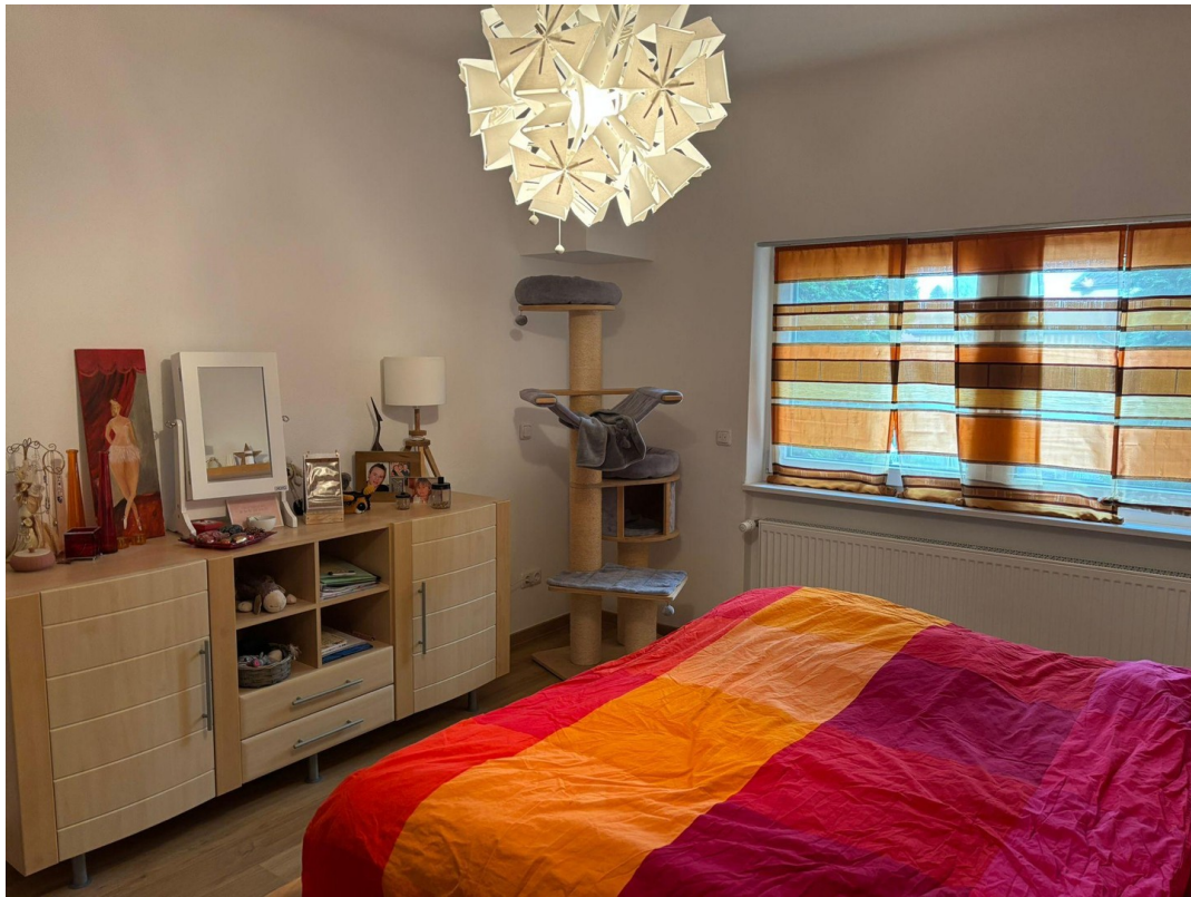
Zimmer Kind Teil 2