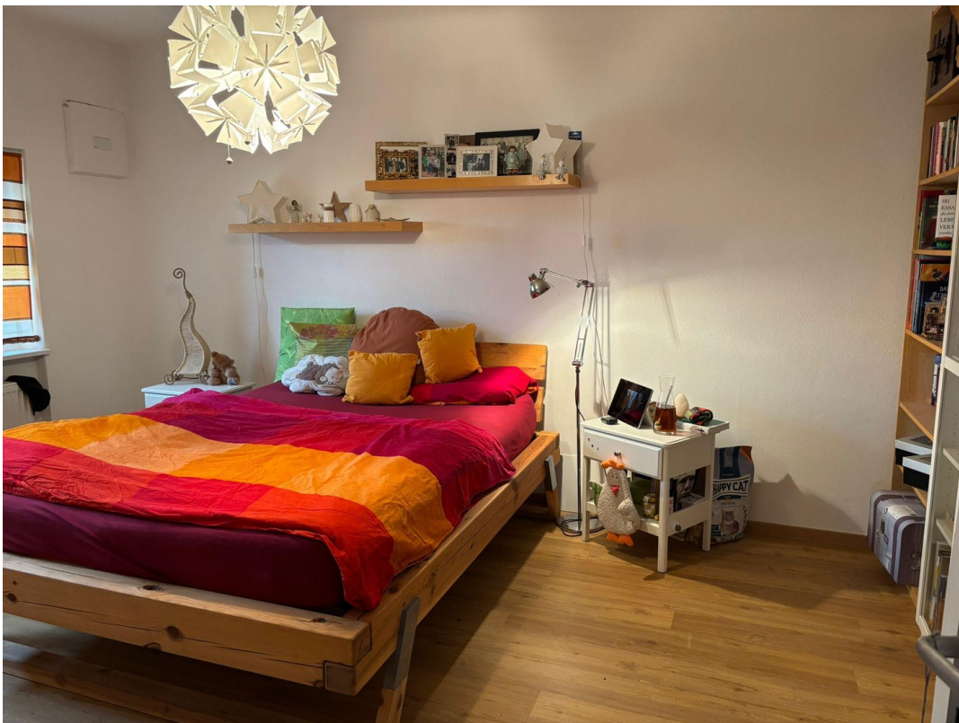
Zimmer Kind als Schlafzimmer