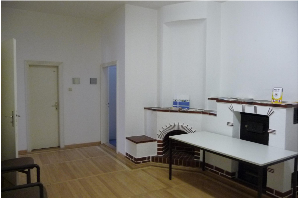
2. Stock Eingang/Flur