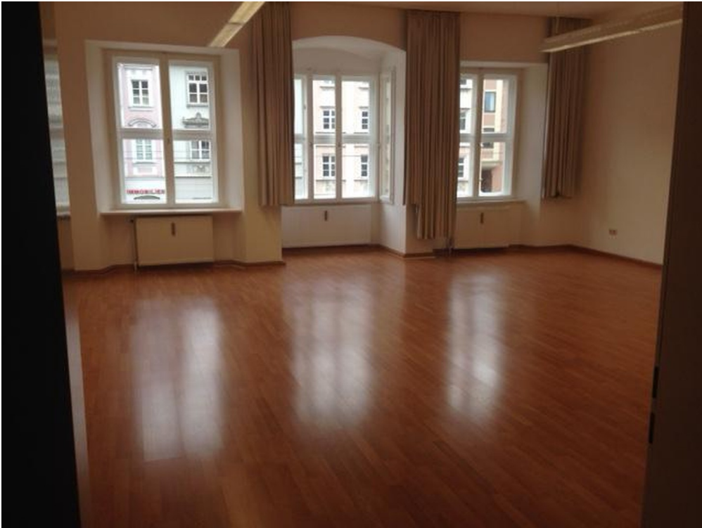
1. Stock Raum 2