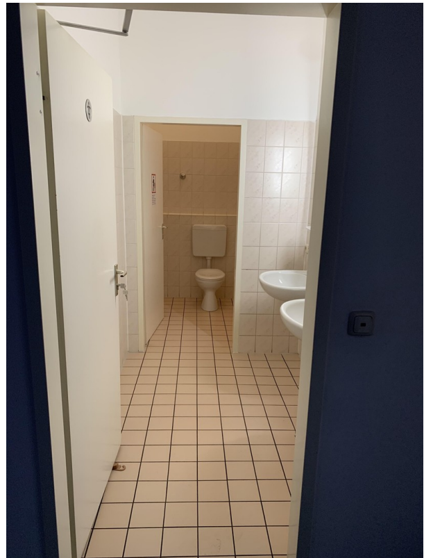
1. Stock WC Damen