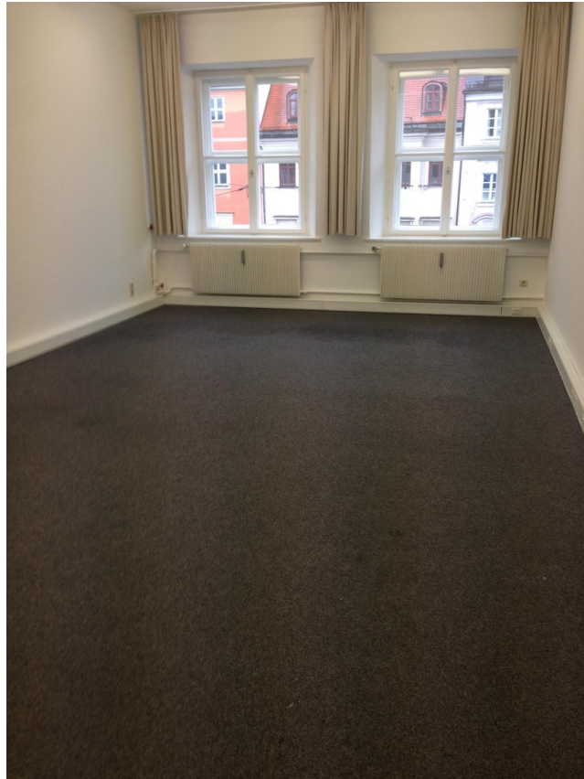
2. Stock Raum3