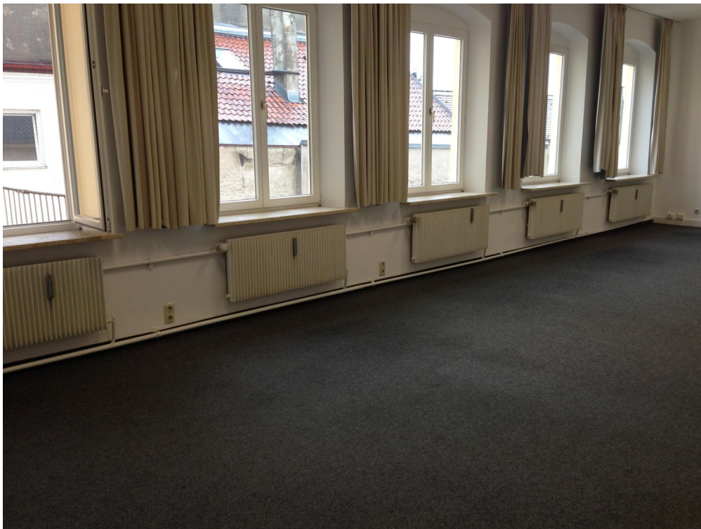
2. Stock Raum 4