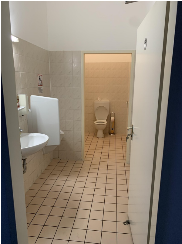
1. Stock WC Herren