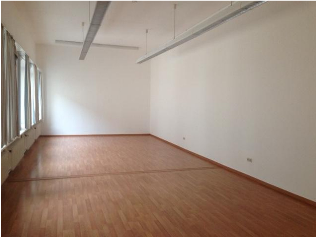
1. Stock Raum 4