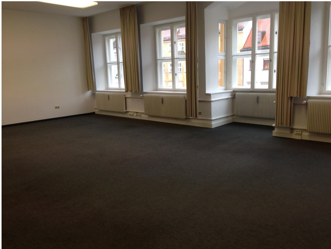
2. Stock Raum 2