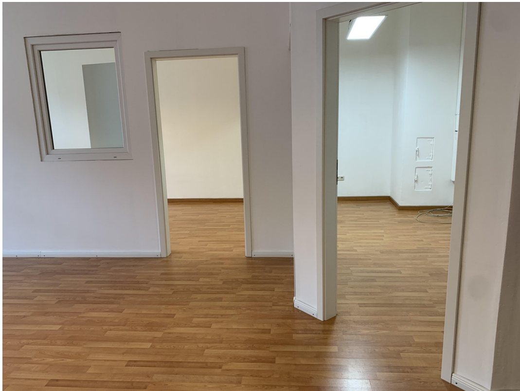
Besprechung/Eingang Raum 2