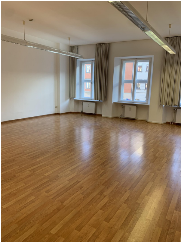
Raum 3 ohne Einrichtung