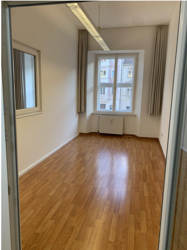
Raum 2 ohne Einrichtung