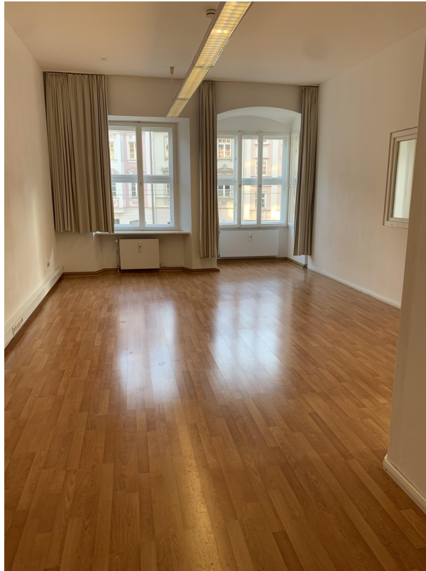
Raum 5 ohne Einrichtung