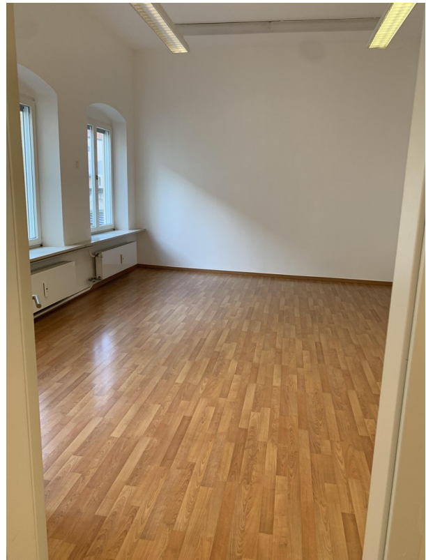
Raum 4 ohne Einrichtung