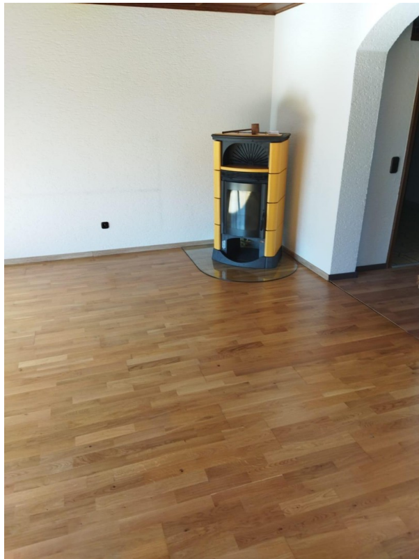
Wohzimmer und Ofen