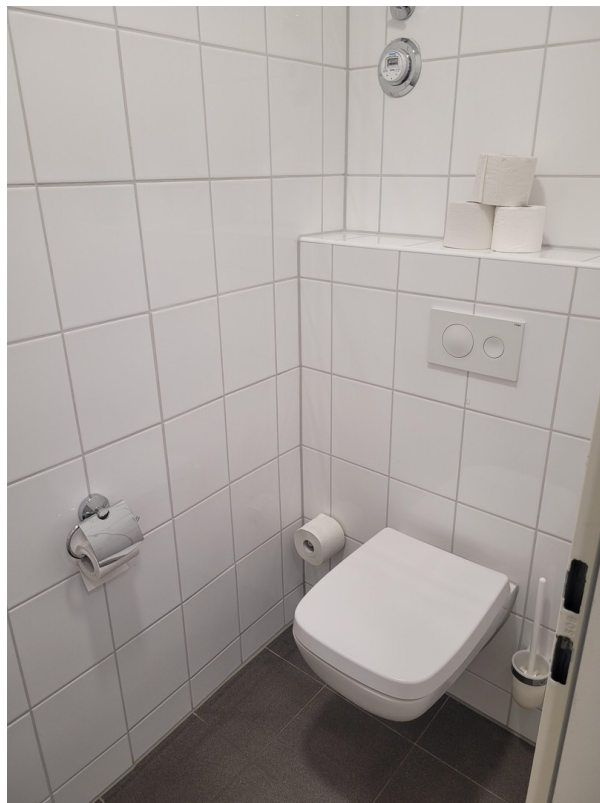
WC Ansicht 2