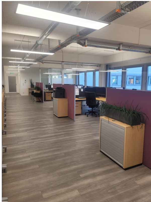
Großraum Sicht 3