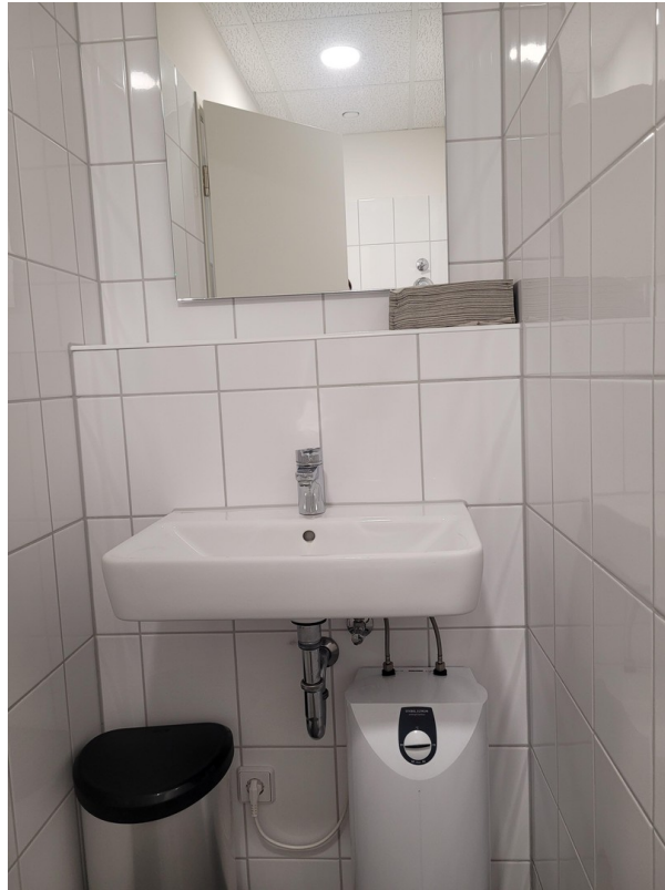
WC Ansicht 1