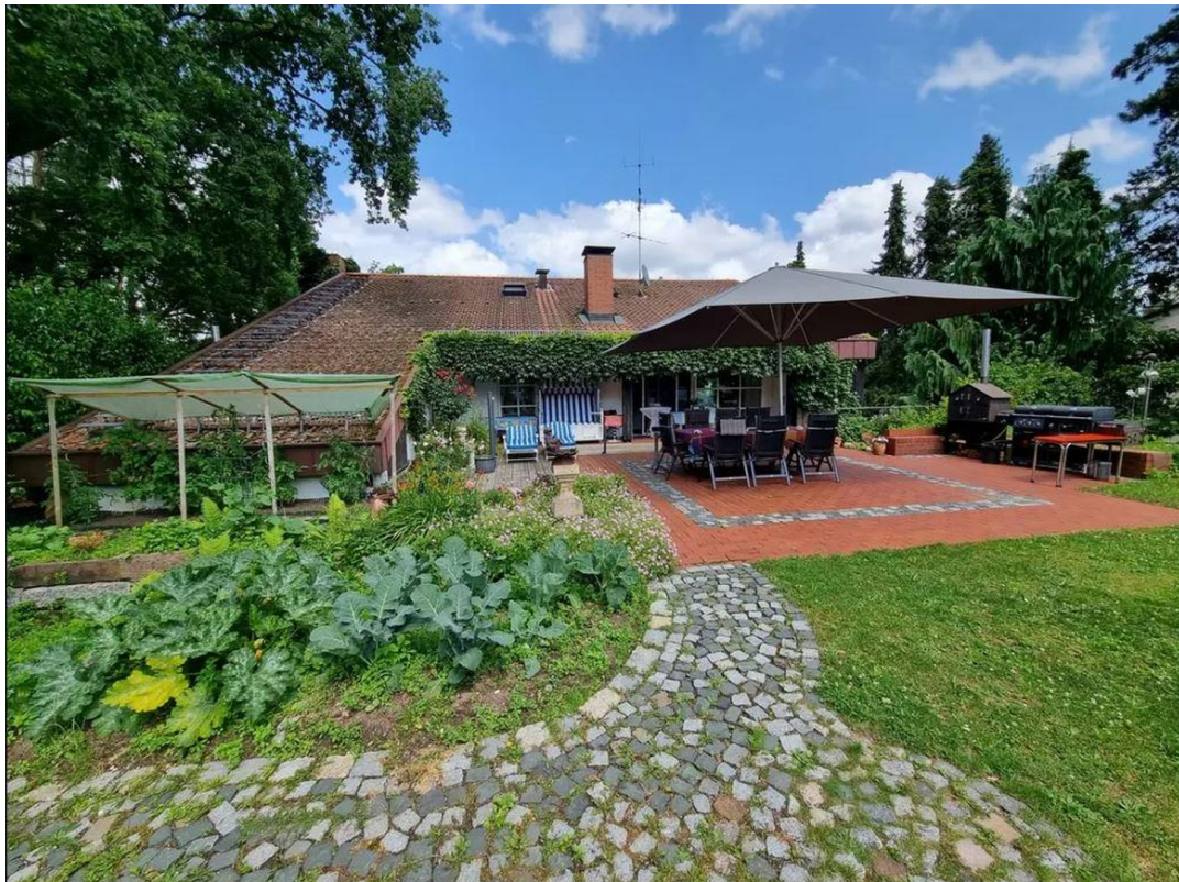
Blick auf Terrasse