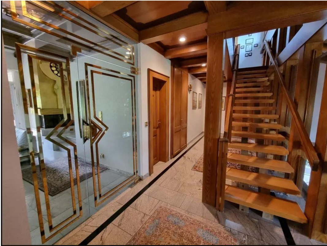
Flurbereich 3 Ebene