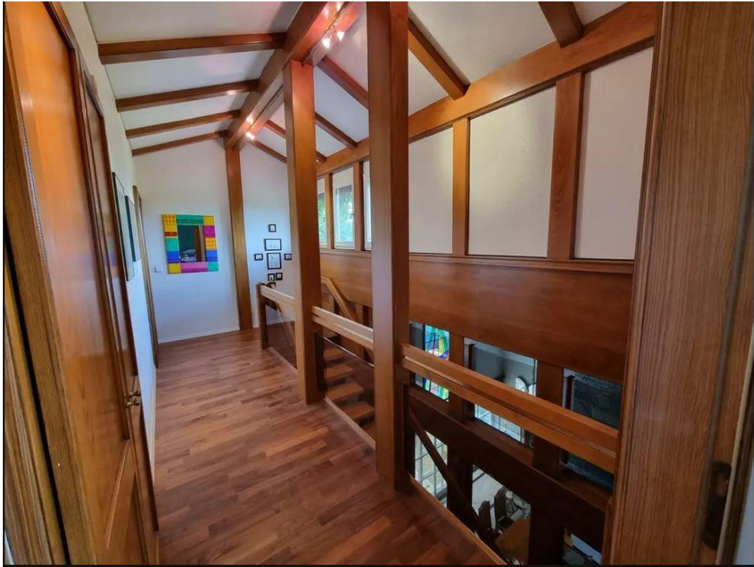
Flurbereich 4 Ebene