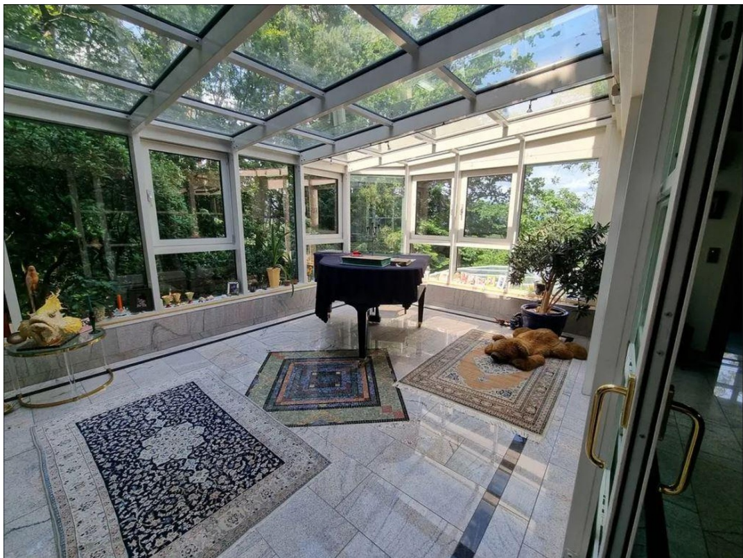
Wintergarten / Musikzimmer