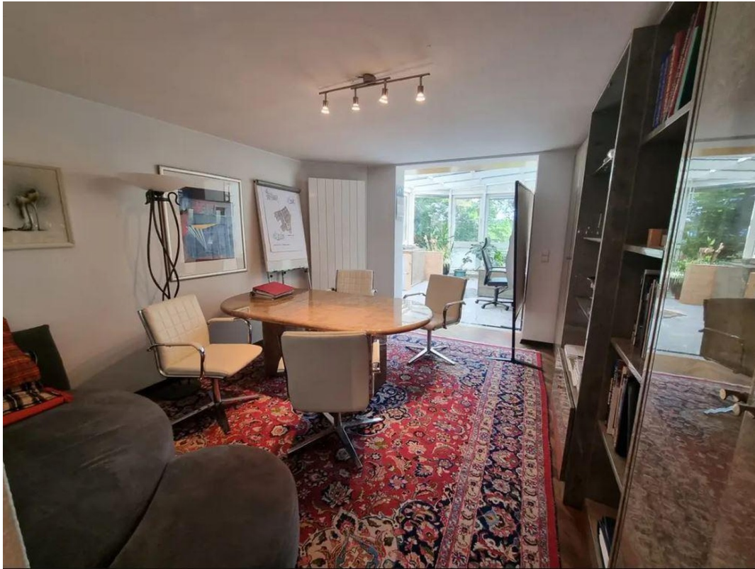
Einliegerwohnung / Büro