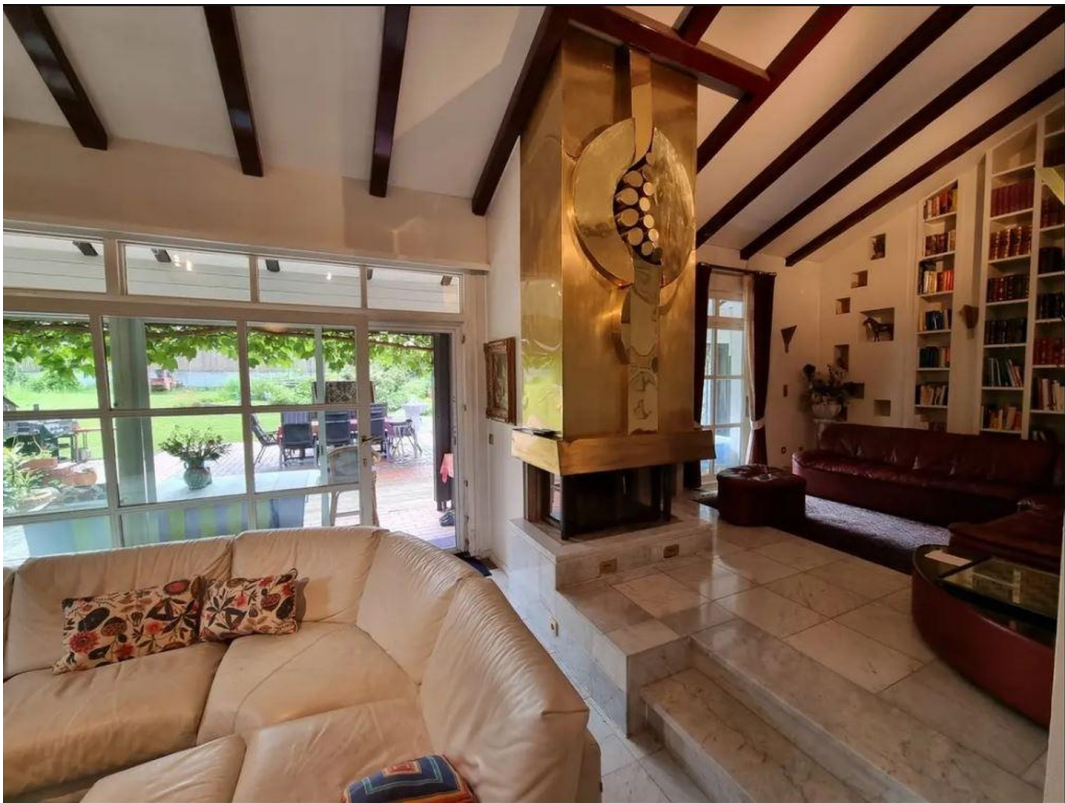
Kaminzimmer 3 Ebene