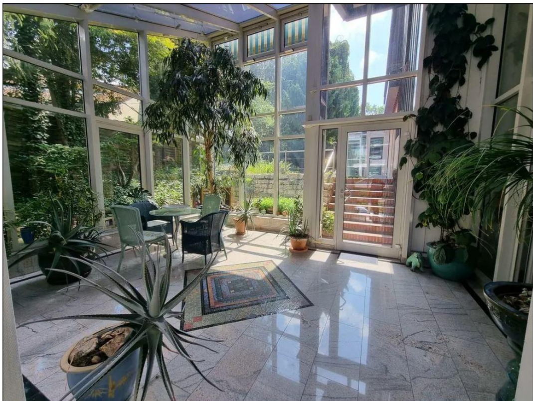
Wintergarten 2 Ebene