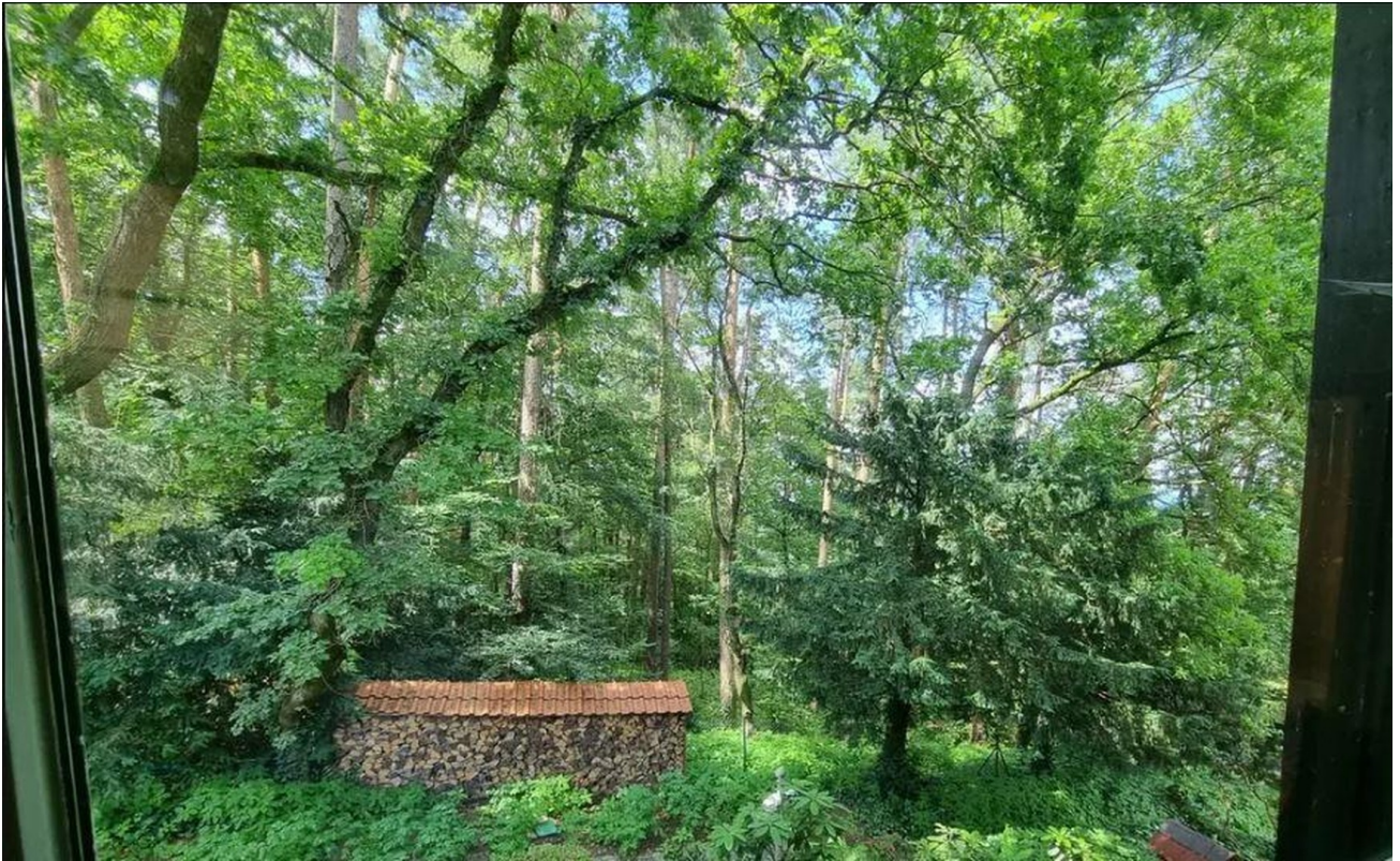
Blick aus dem Schlafzimmer