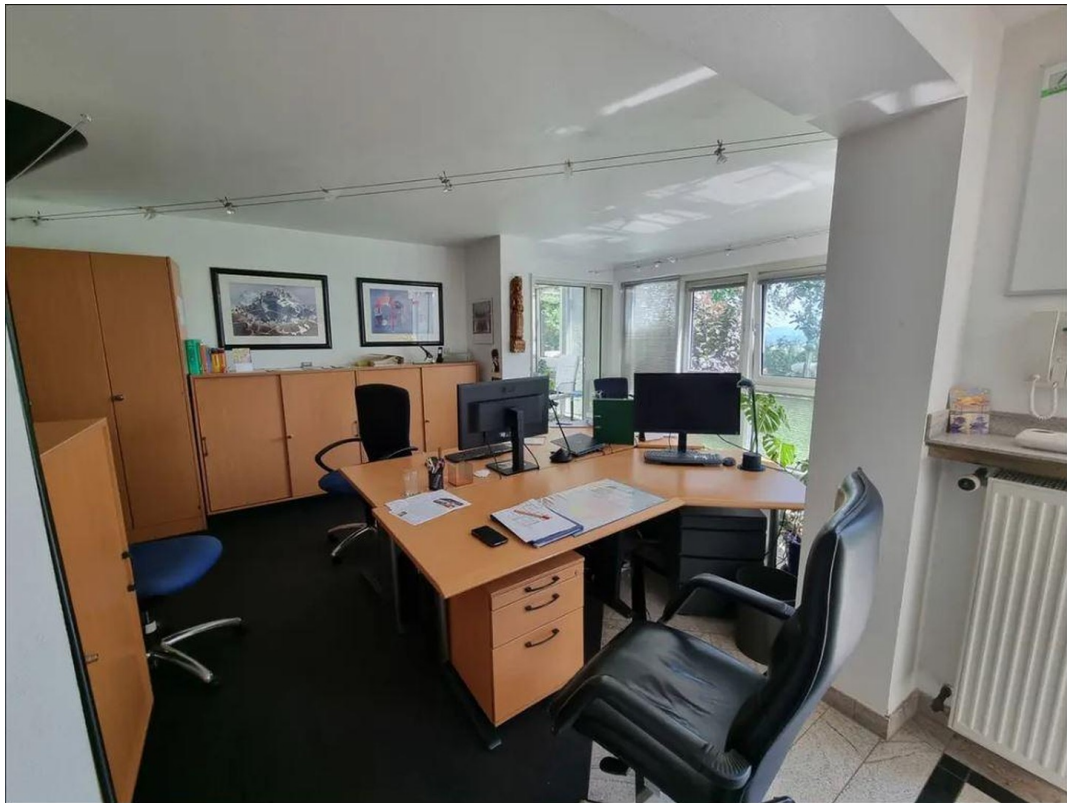
Einliegerwohnung / Büro