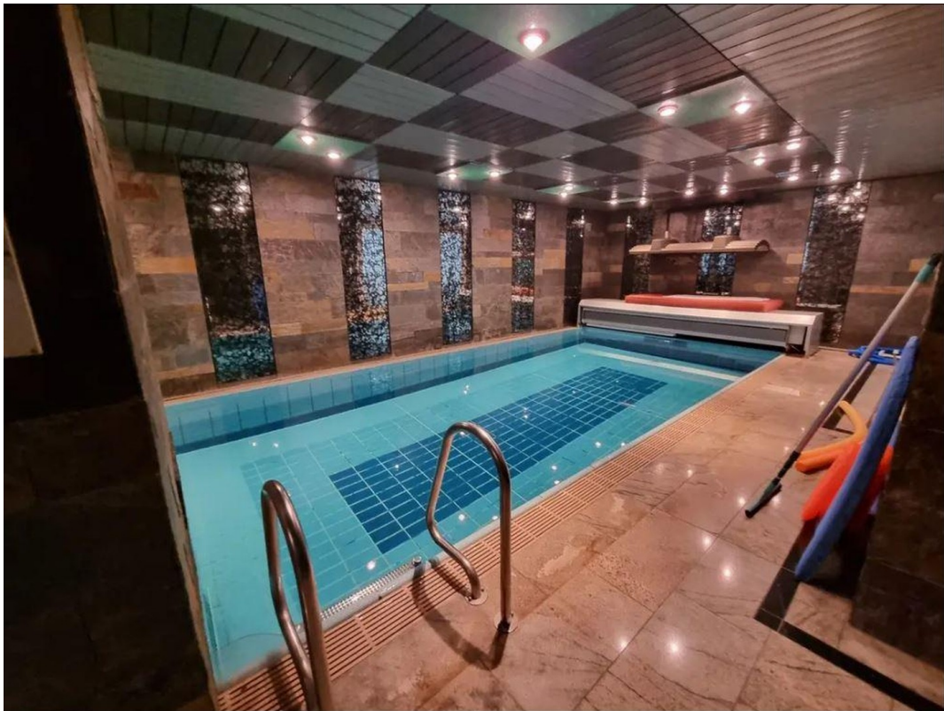
Schwimmhalle mit Saunabereich