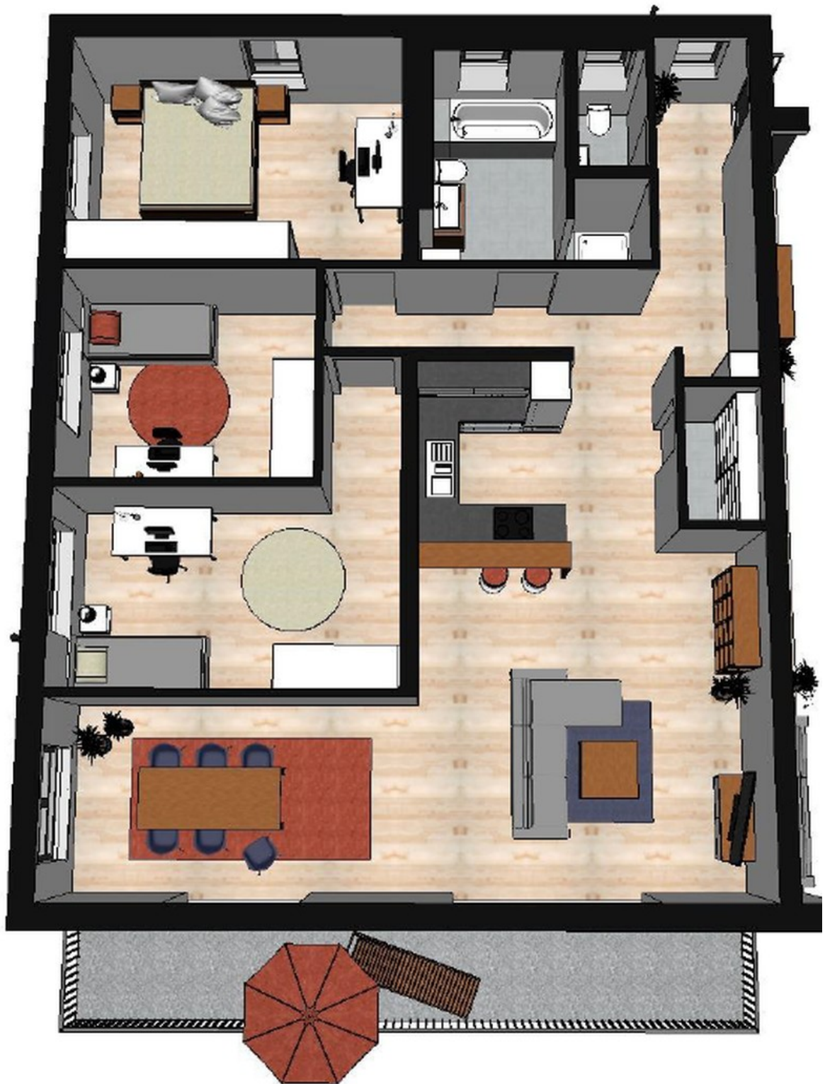
Grundriss Beispiel B