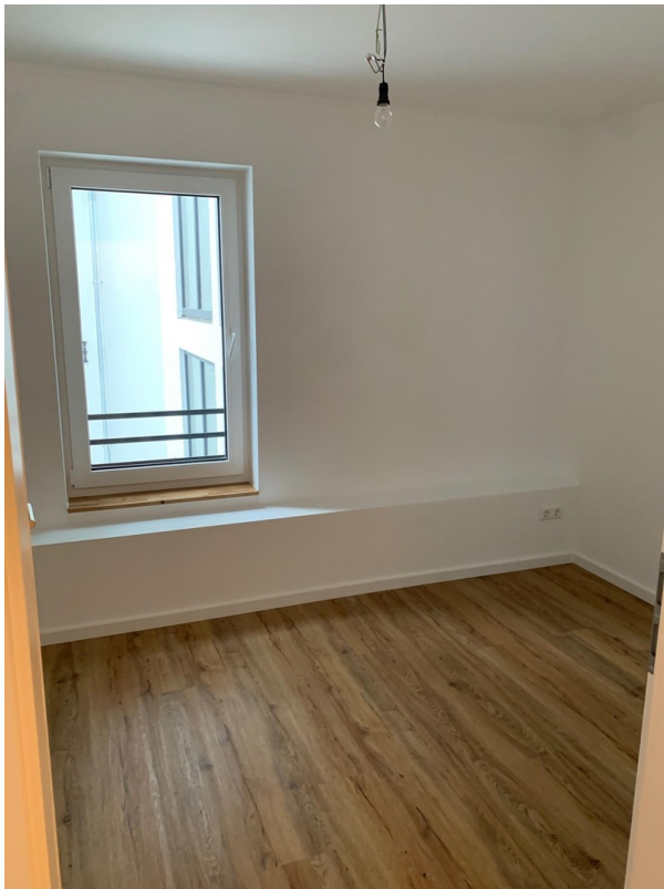
Beispiel Zimmer 1