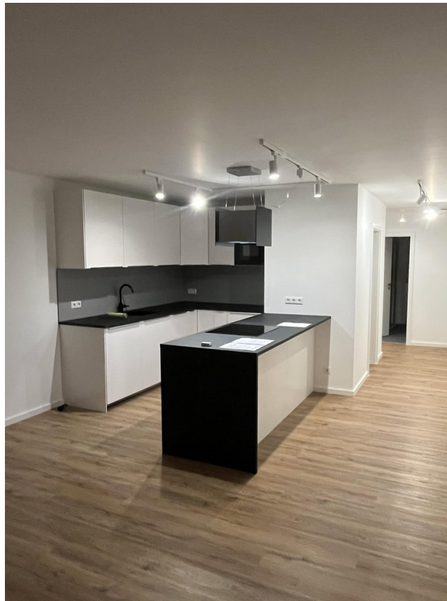
Beispiel Küche 2