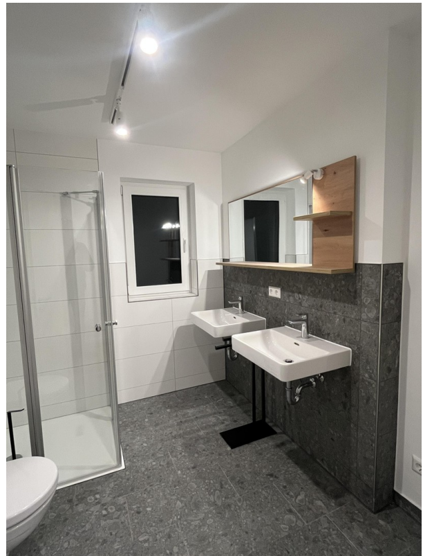
Beispiel Bad 1