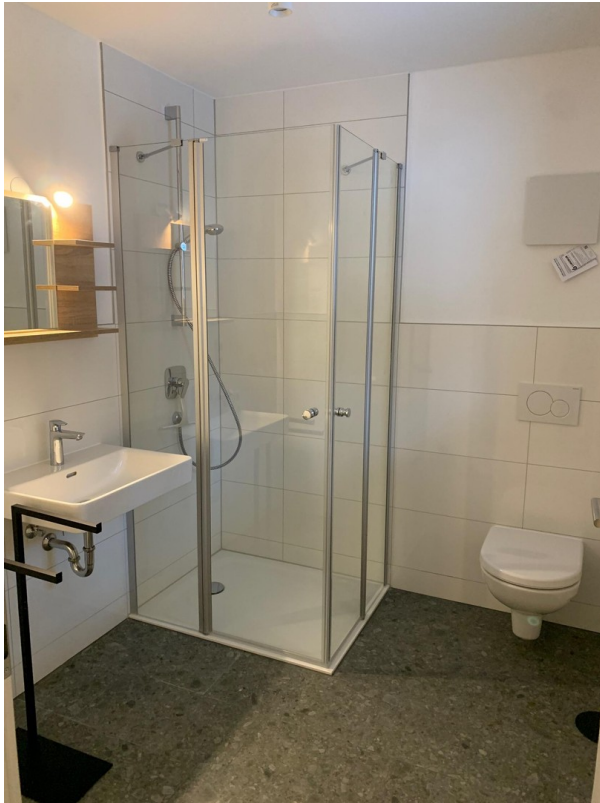
Beispiel Bad 2