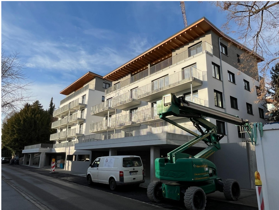
Aussenansicht von Osten