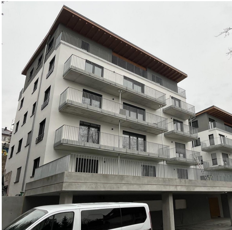
Aussenansicht von Westen