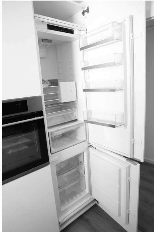
Küche - Kühlschrank