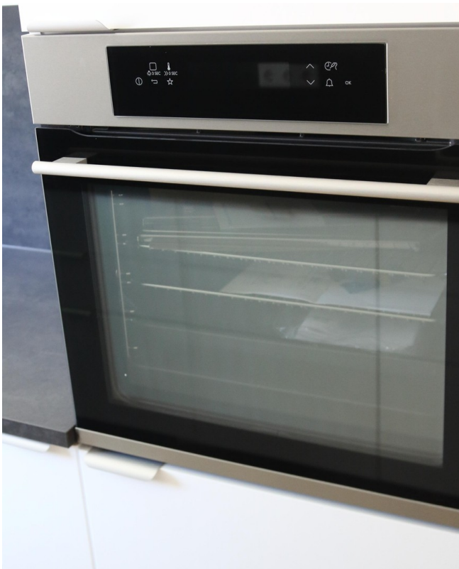
Küche - Ofen