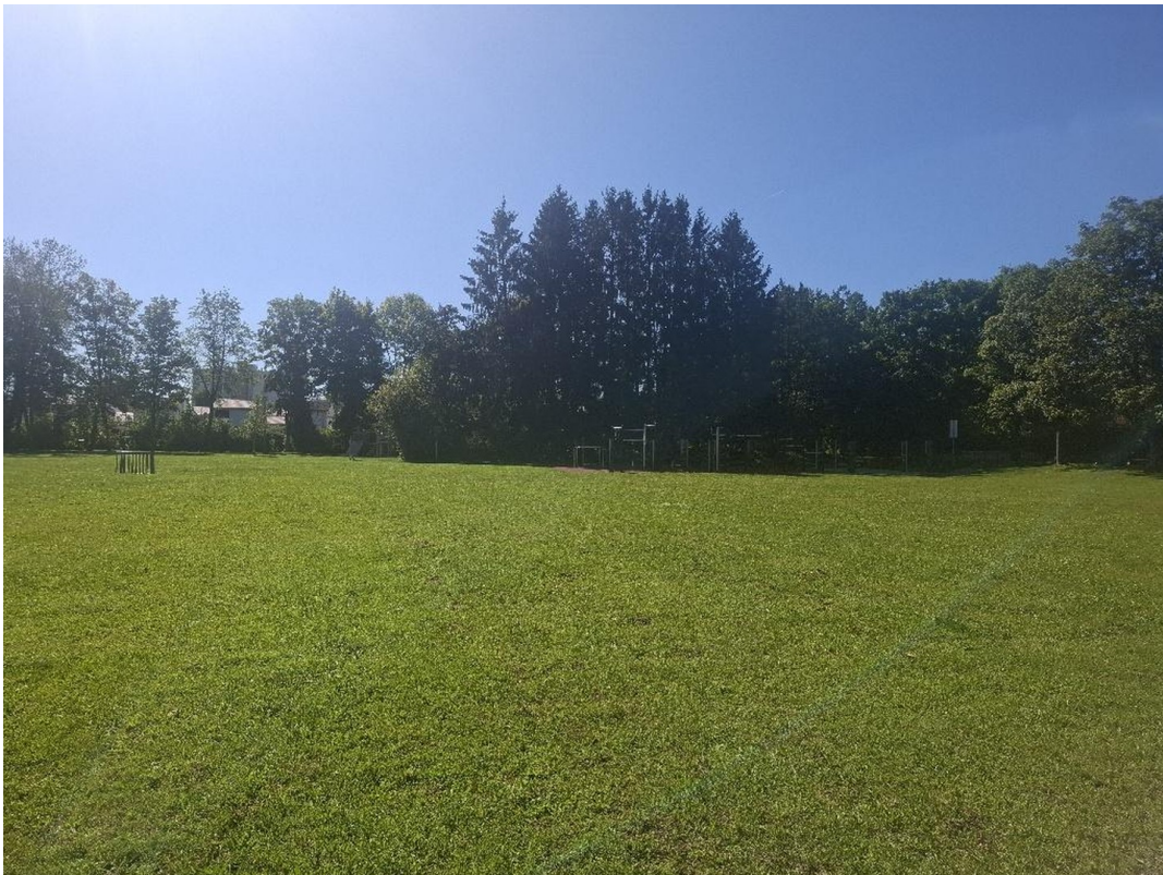
Erholungsgebiet ehem. Flugfeld