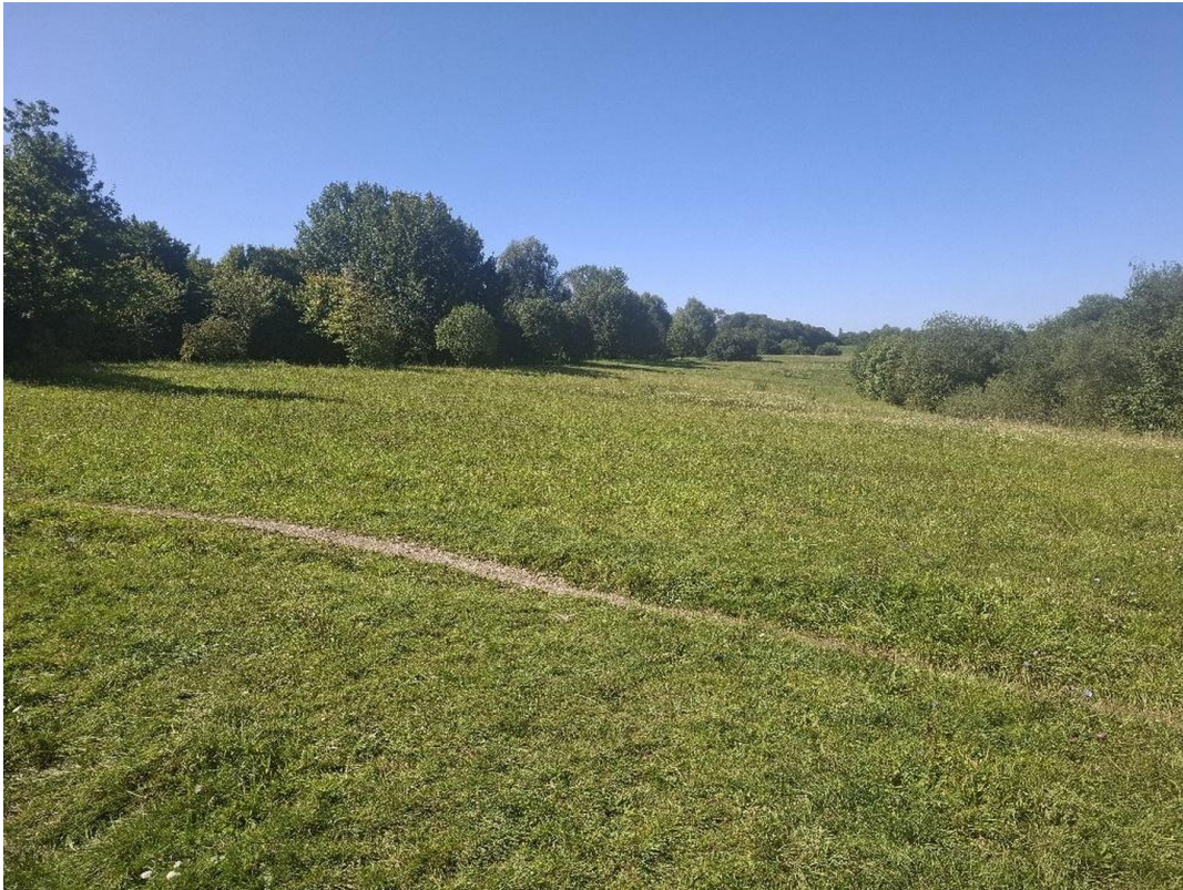
Erholungsgebiet ehem. Flugfeld