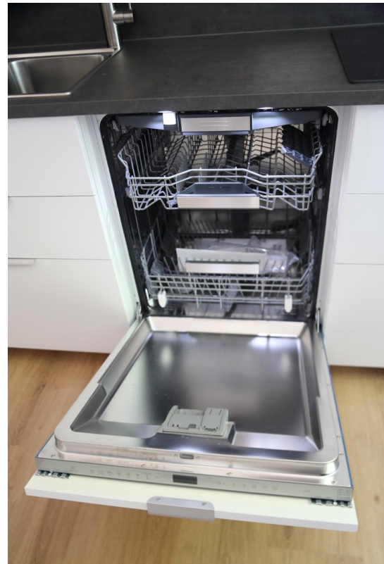
Küche - Spülmaschine