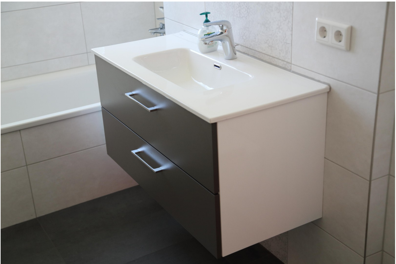
Bad - Waschb. mit Unterschrank