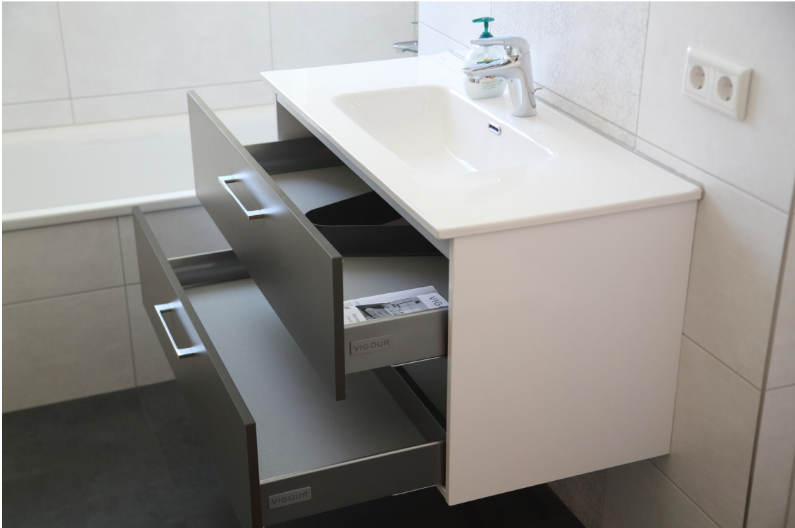
Bad - Waschb. mit Unterschrank