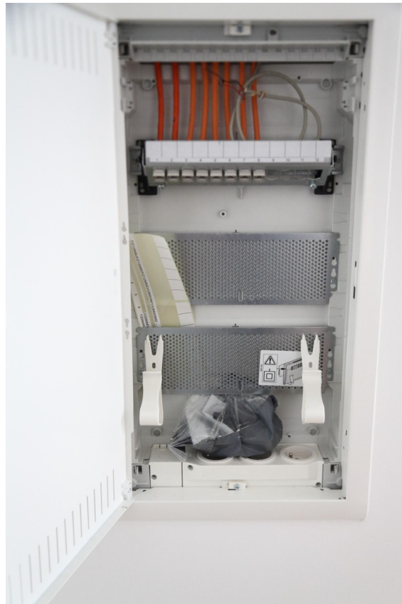
separater Medienschränk LAN