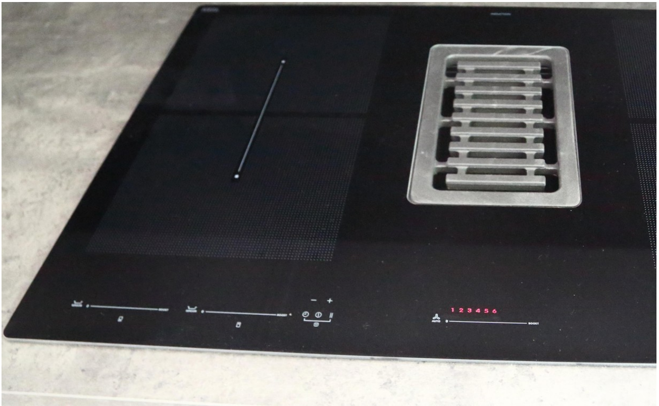
Ceranfeld mit Dunstabzug