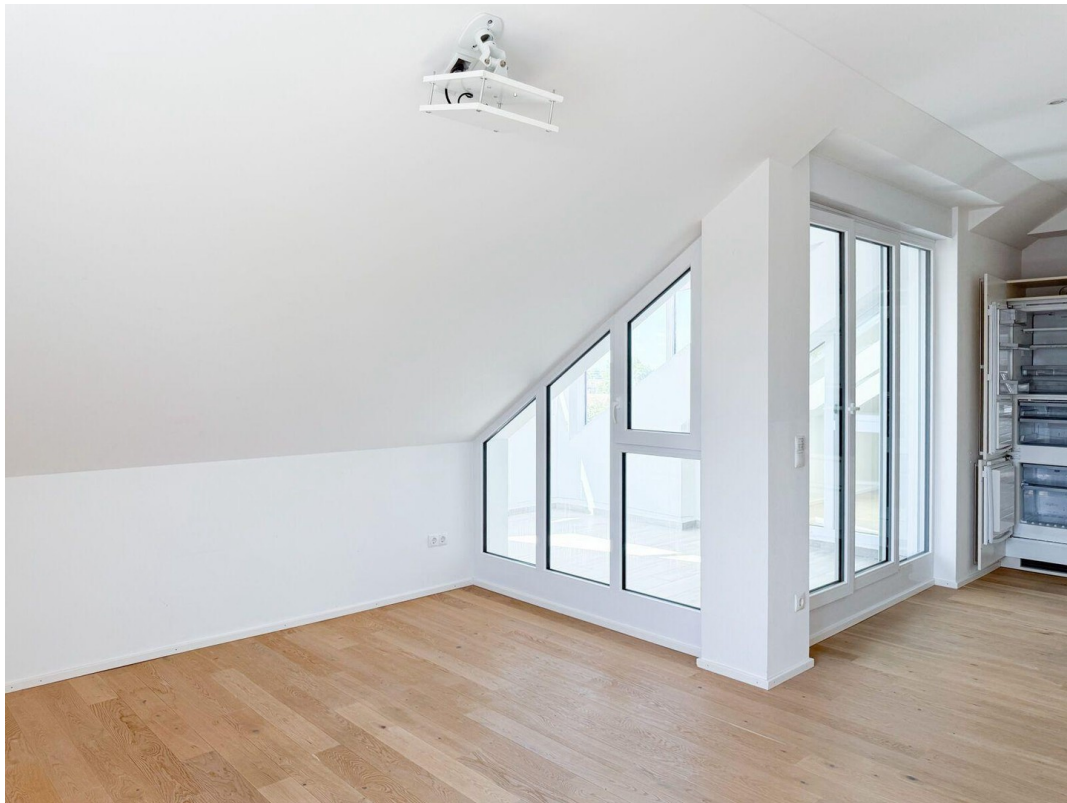
Wohnen, Essen, Küche, Loggia