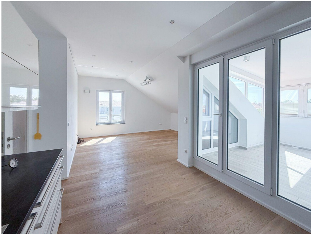
Küche, Essen, Wohnen, Loggia