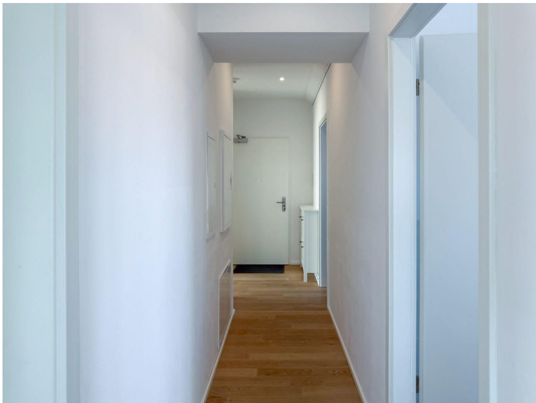
Blick nach Norden