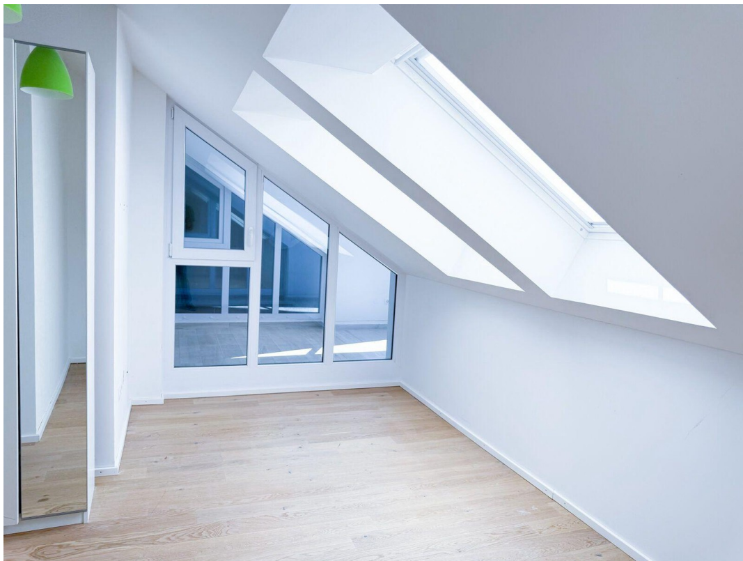
Kind 1 - Blick Loggia