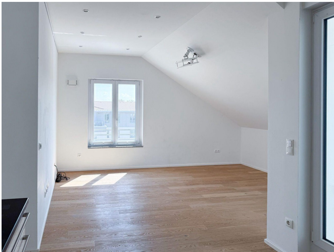
Wohnen, Blick nach Süden