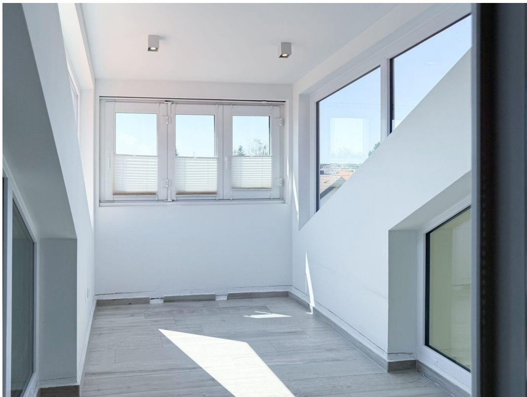
Loggia Blick nach Westen