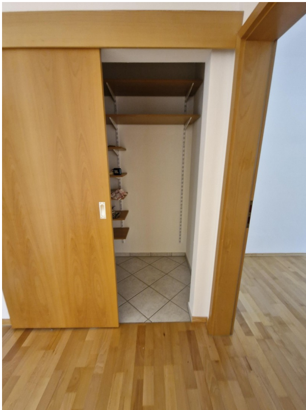
Abstellraum mit Wandregalen