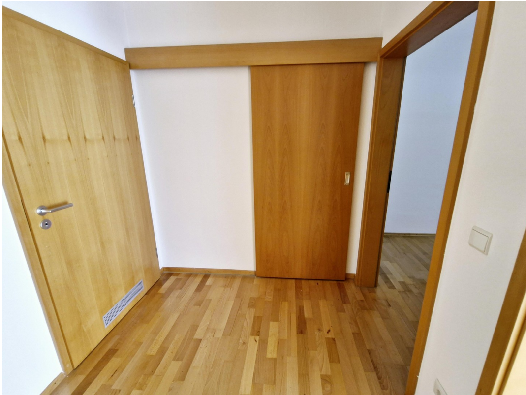
Flur Schiebetür z. Abstellraum