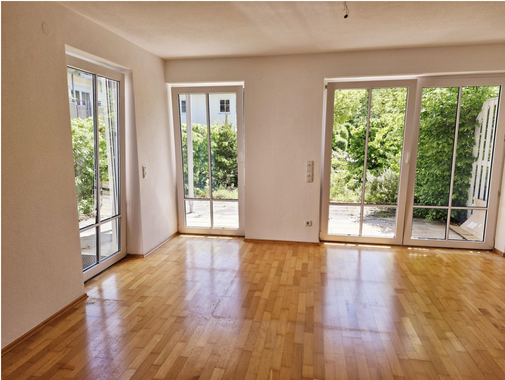
Fensterfront S/O el. Jalousien