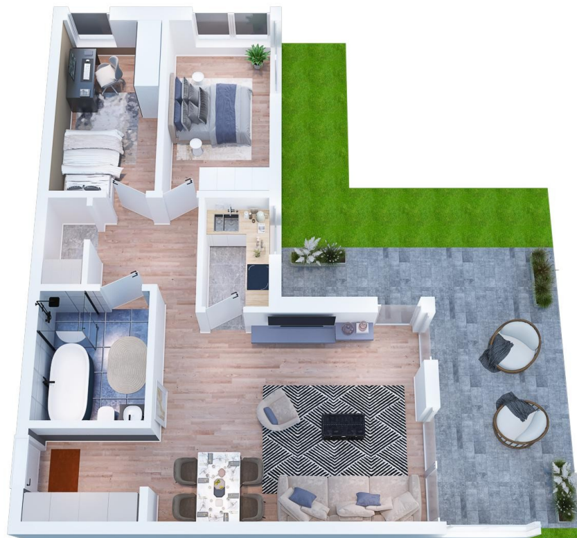
3D Einrichtungsplaner Grundris