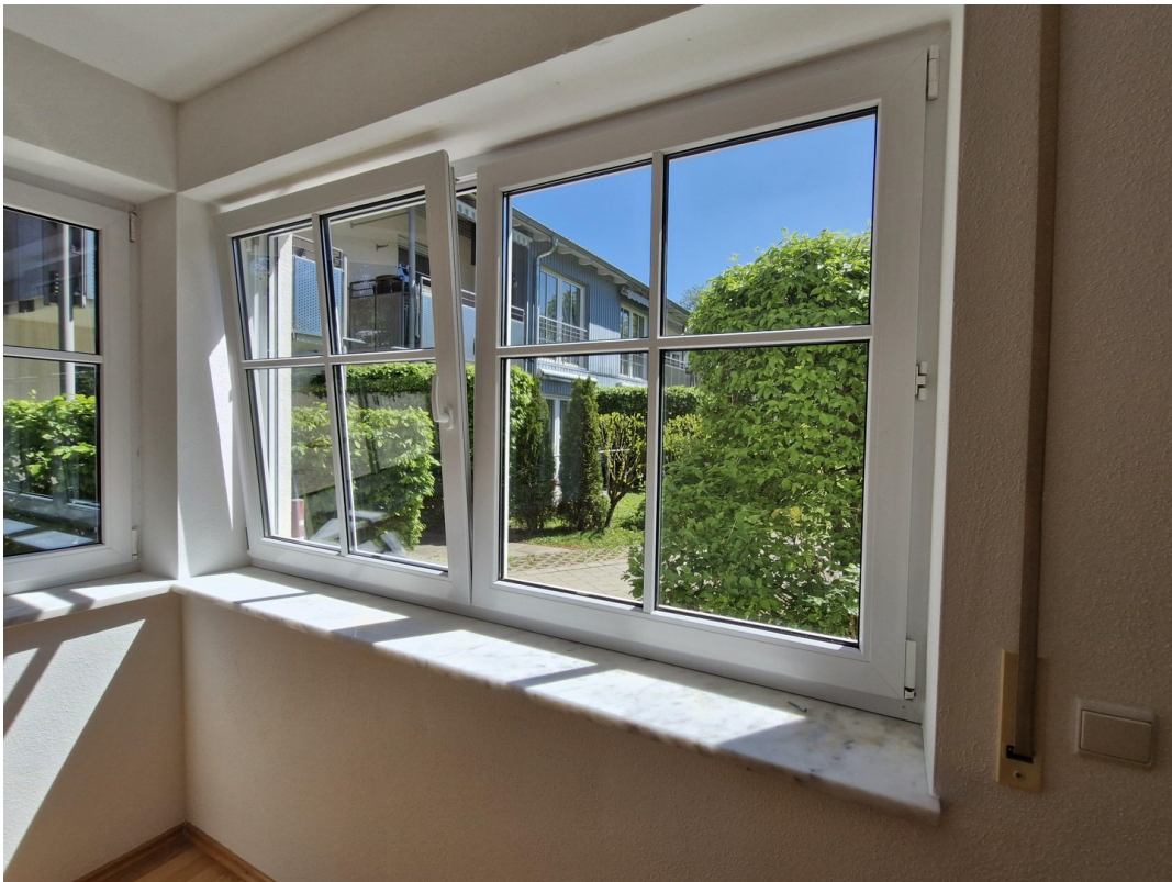
Aussicht vom Schlafzimmer