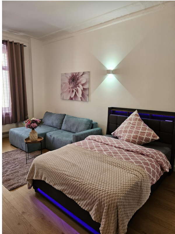
Zimmer 2 / Room 2