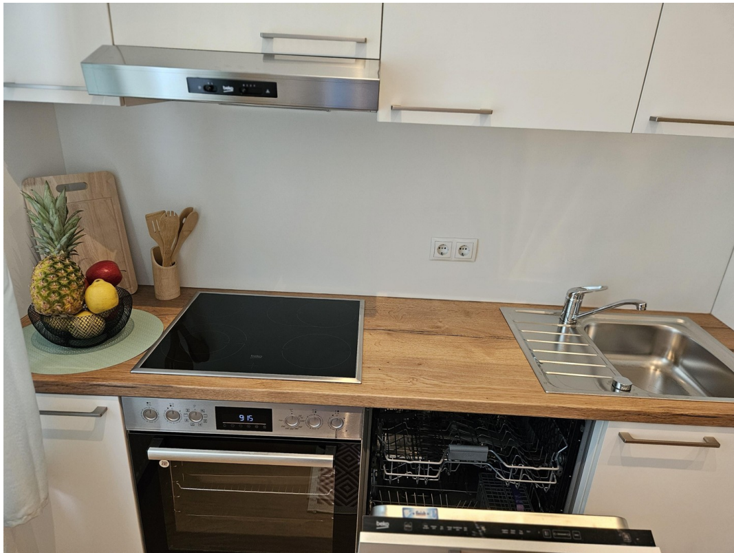
Küche / Kitchen