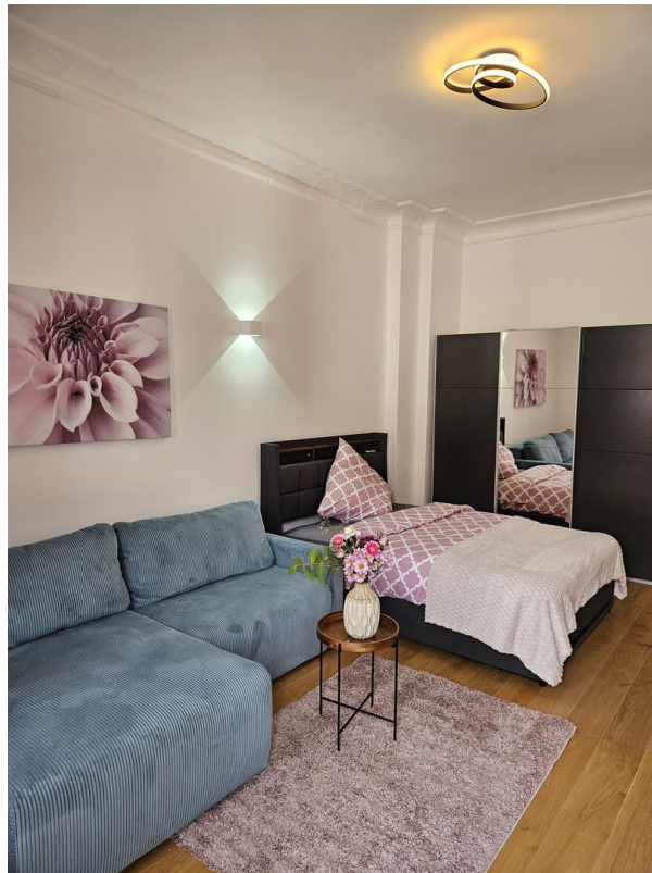
Zimmer 2 / Room 2