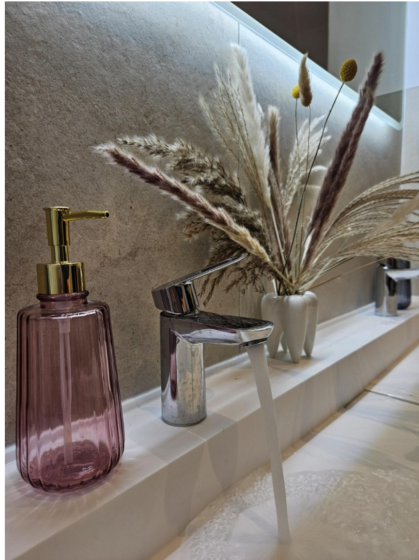
Badezimmer / Bathroom