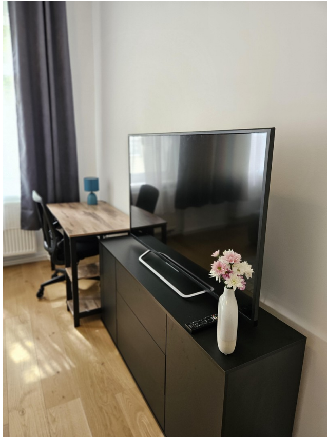
Zimmer 1 / Room 1