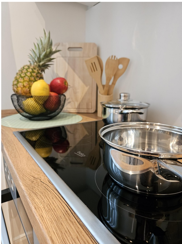
Küche / Kitchen