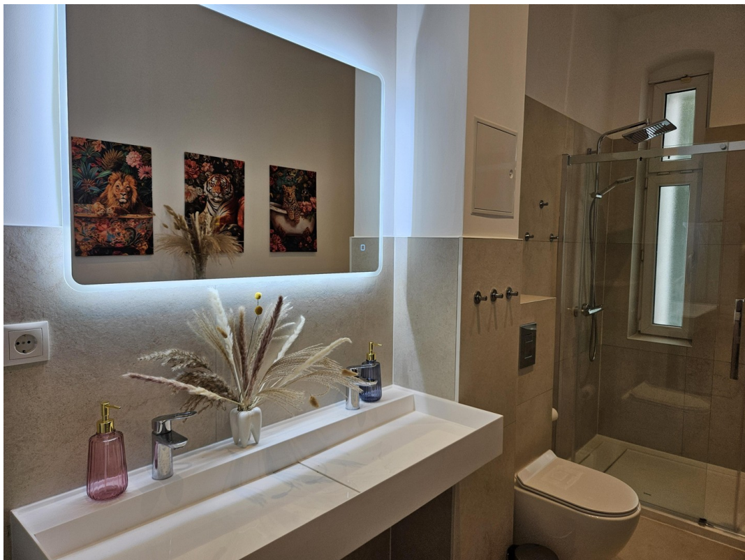
Badezimmer / Bathroom