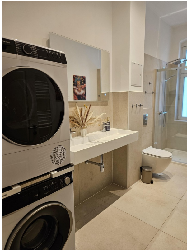
Badezimmer / Bathroom