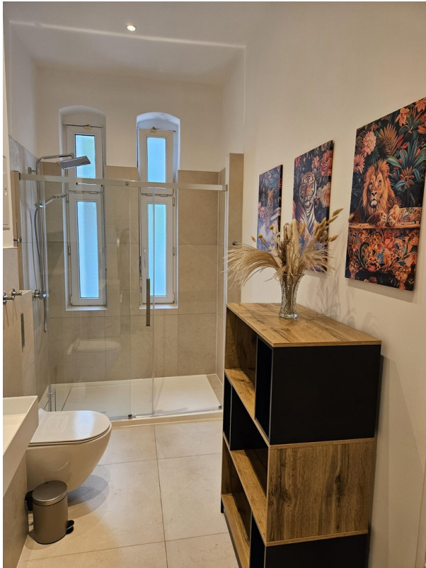
Badezimmer / Bathroom