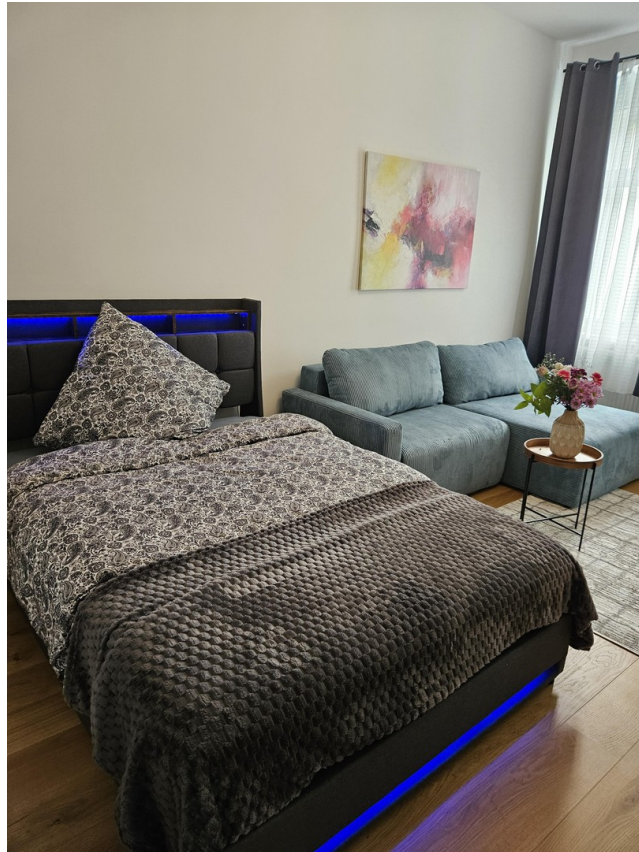
Zimmer 1 / Room 1