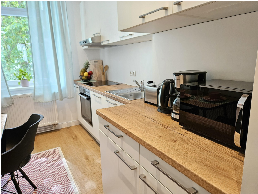
Küche / Kitchen