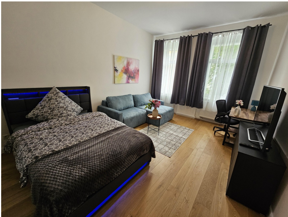
Zimmer 1 / Room 1