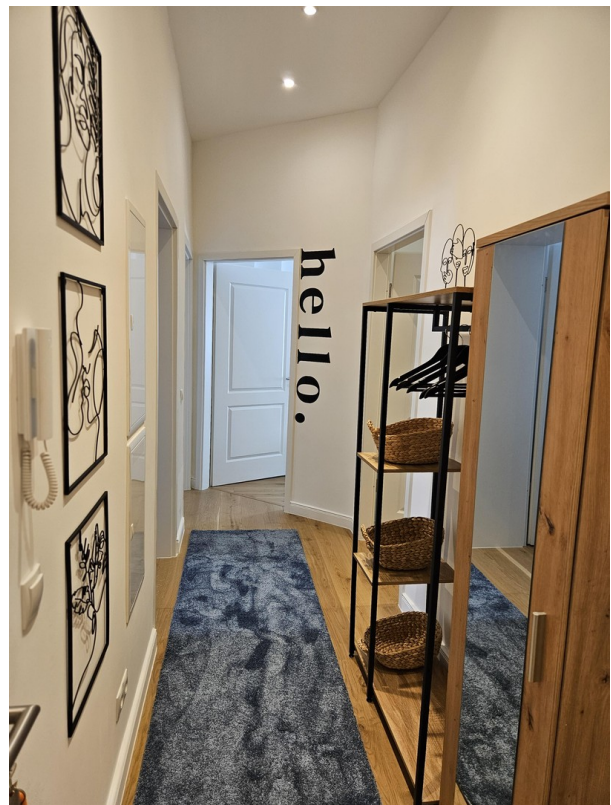
Flur / Hallway