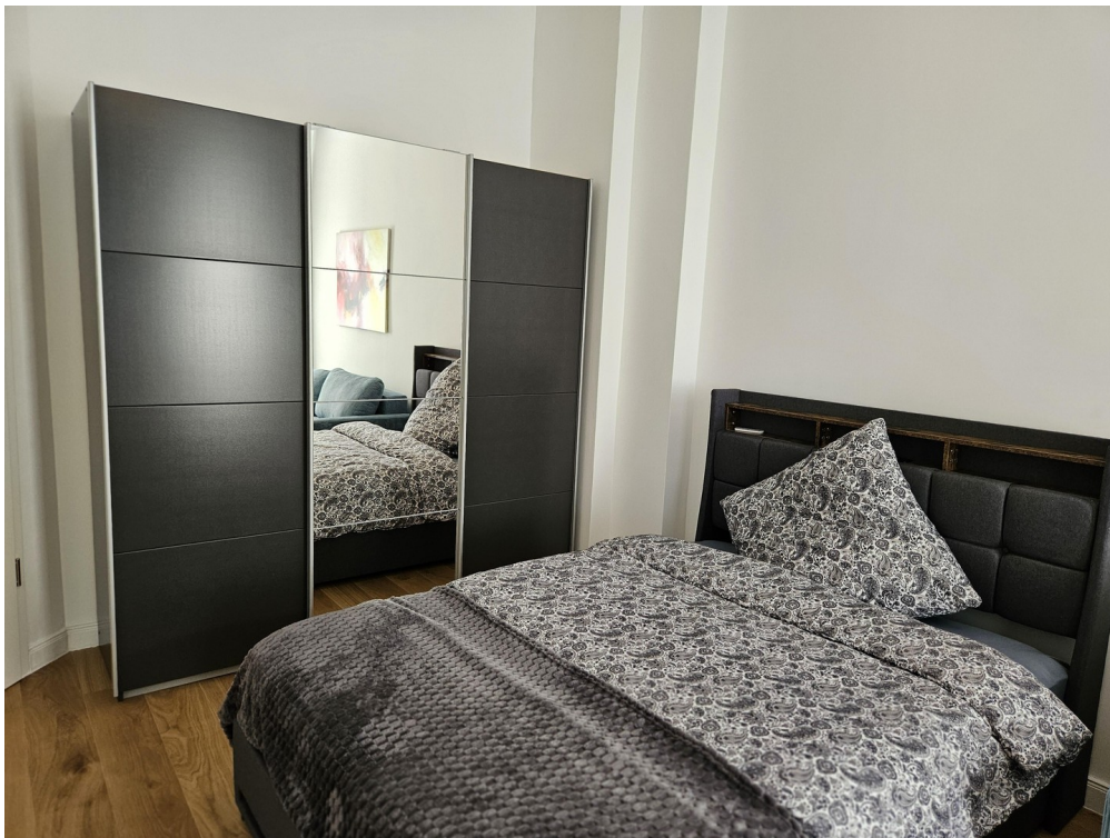
Zimmer 1 / Room 1