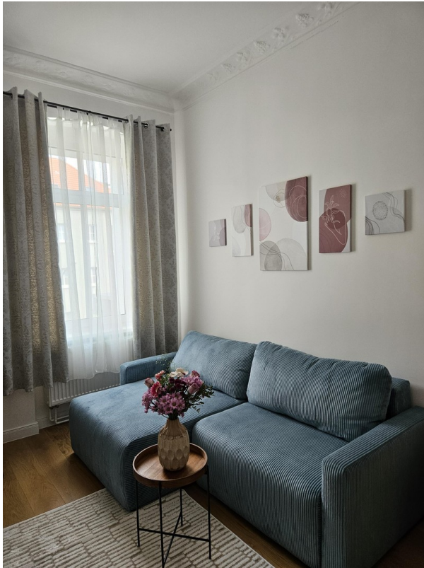
Zimmer 3 / Room 3