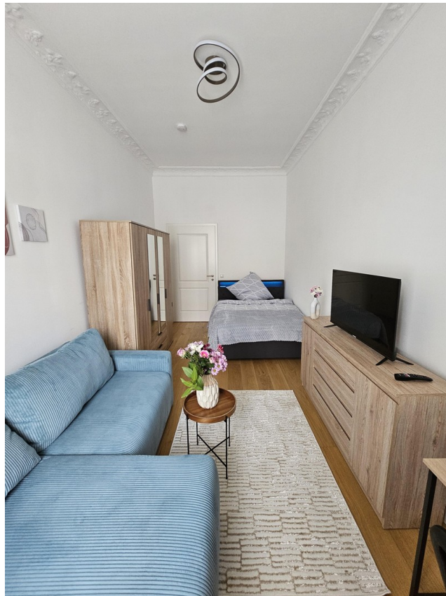
Zimmer 3 / Room 3