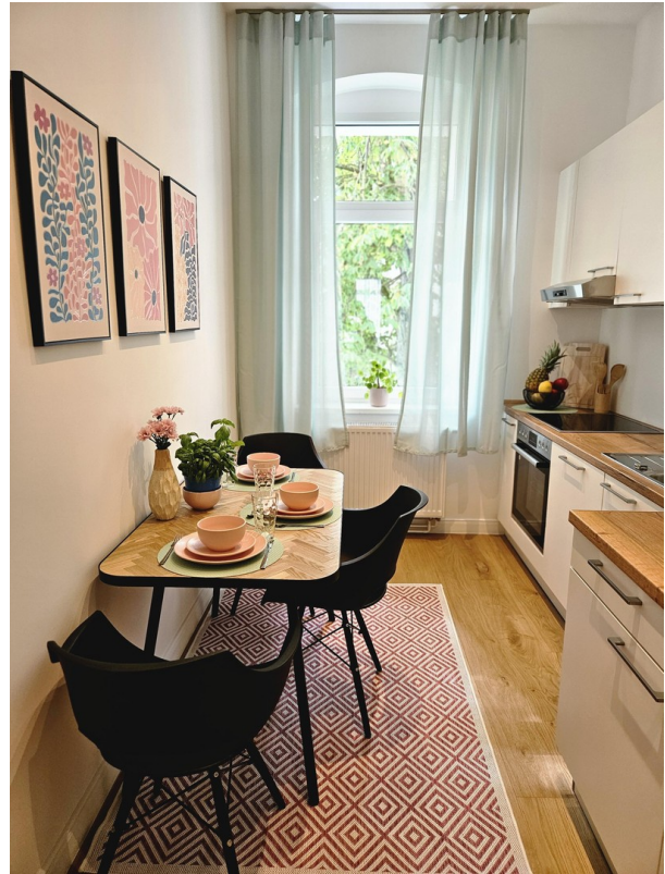
Küche / Kitchen