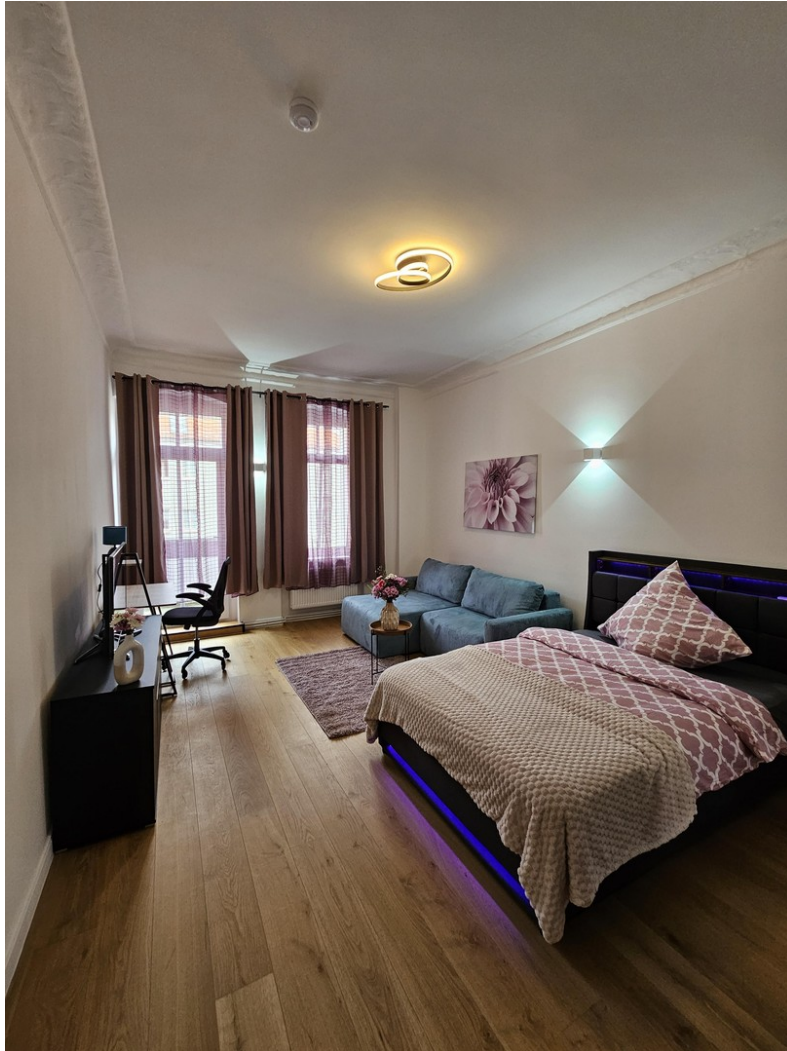
Zimmer 2 / Room 2