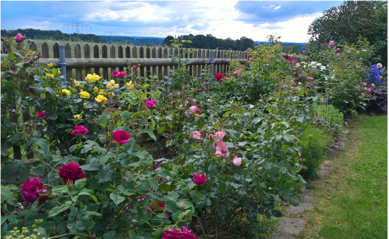
Blick von der Terrasse