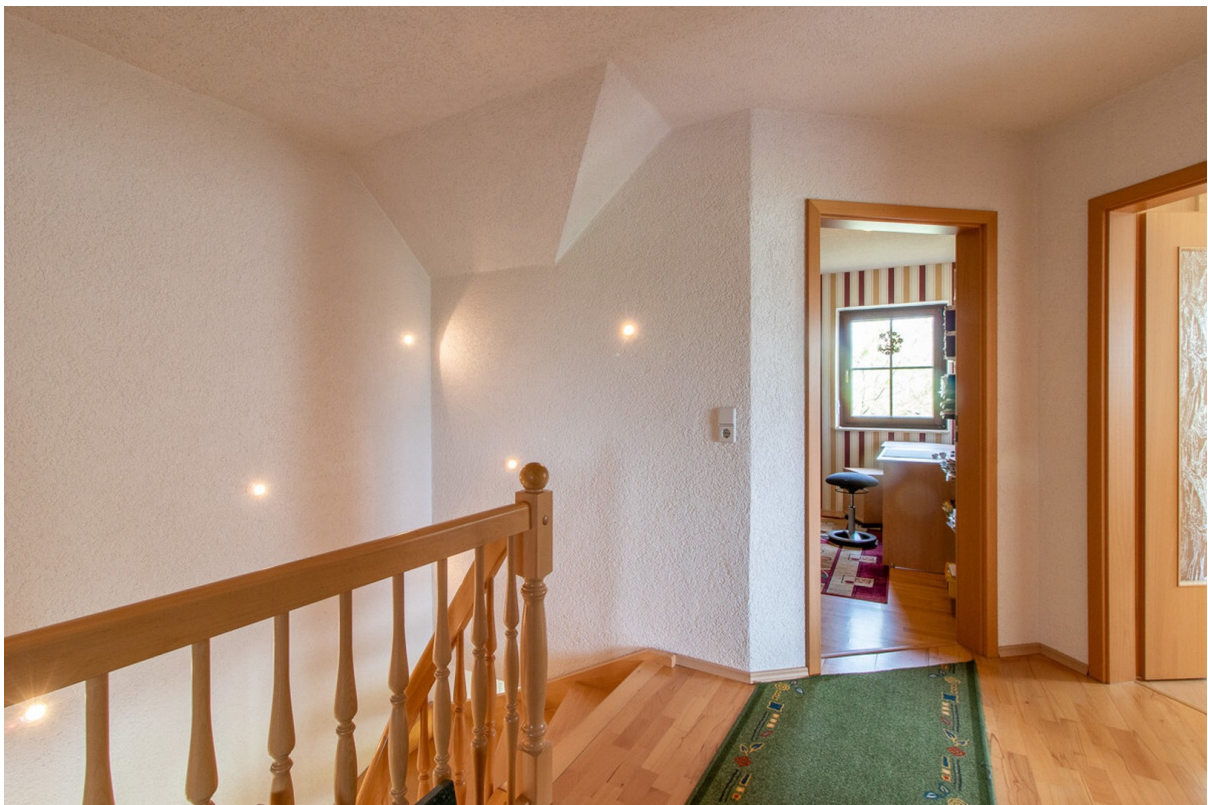
großzügige Treppe in's OG