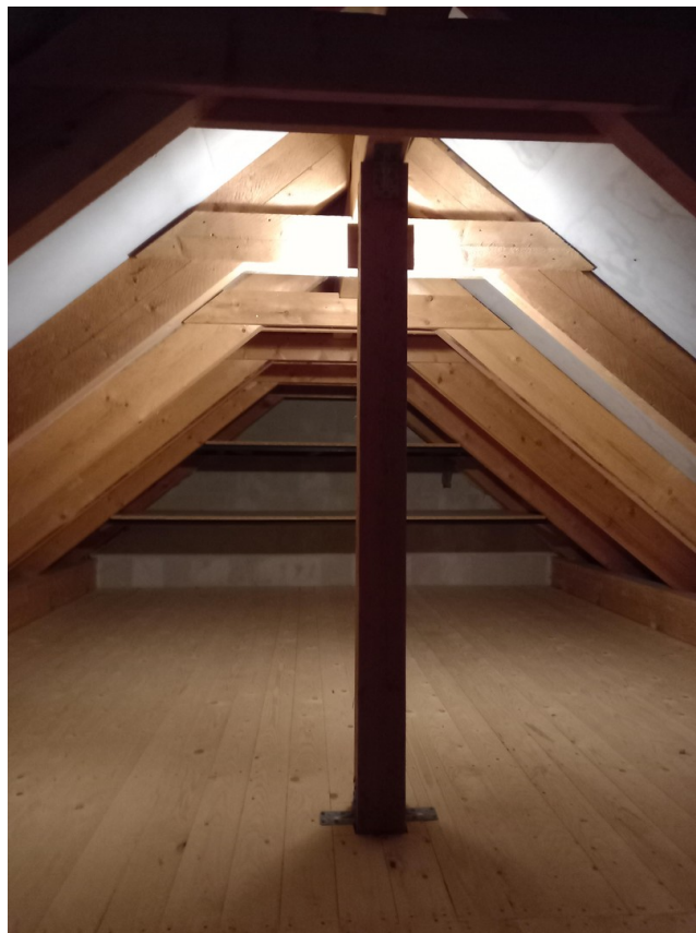
Dachboden mit großem Stauraum