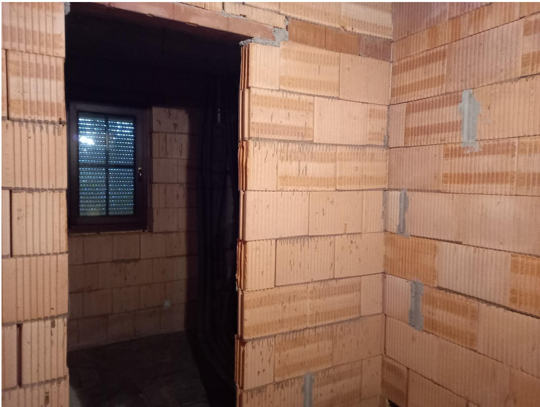
ELW N° 1: Ausbaureserve