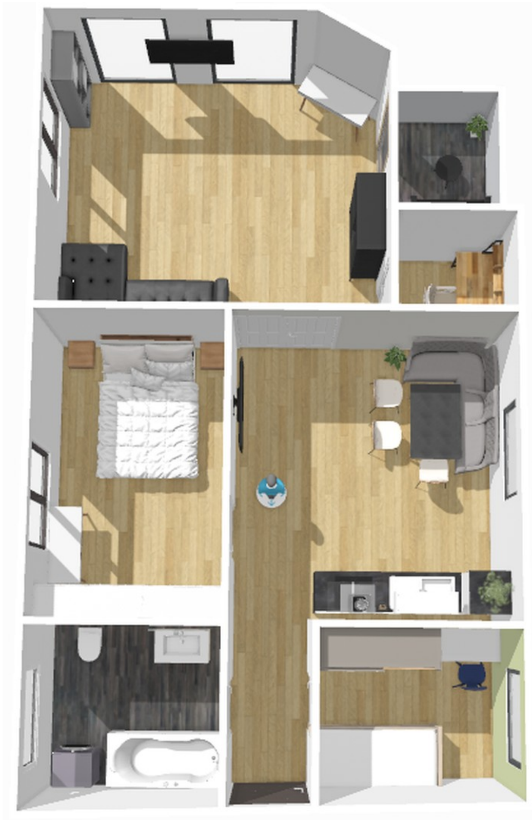
Esszimmer, mit als Wohnzimmer