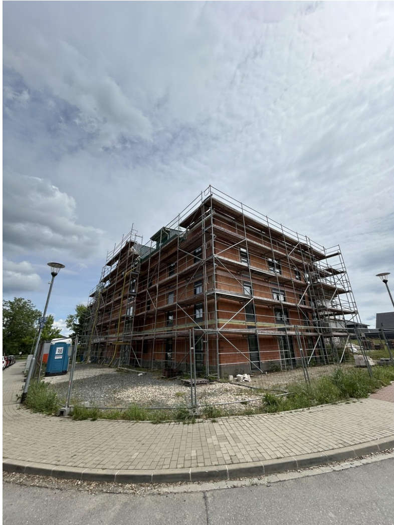
aktueller Zustand seitlich