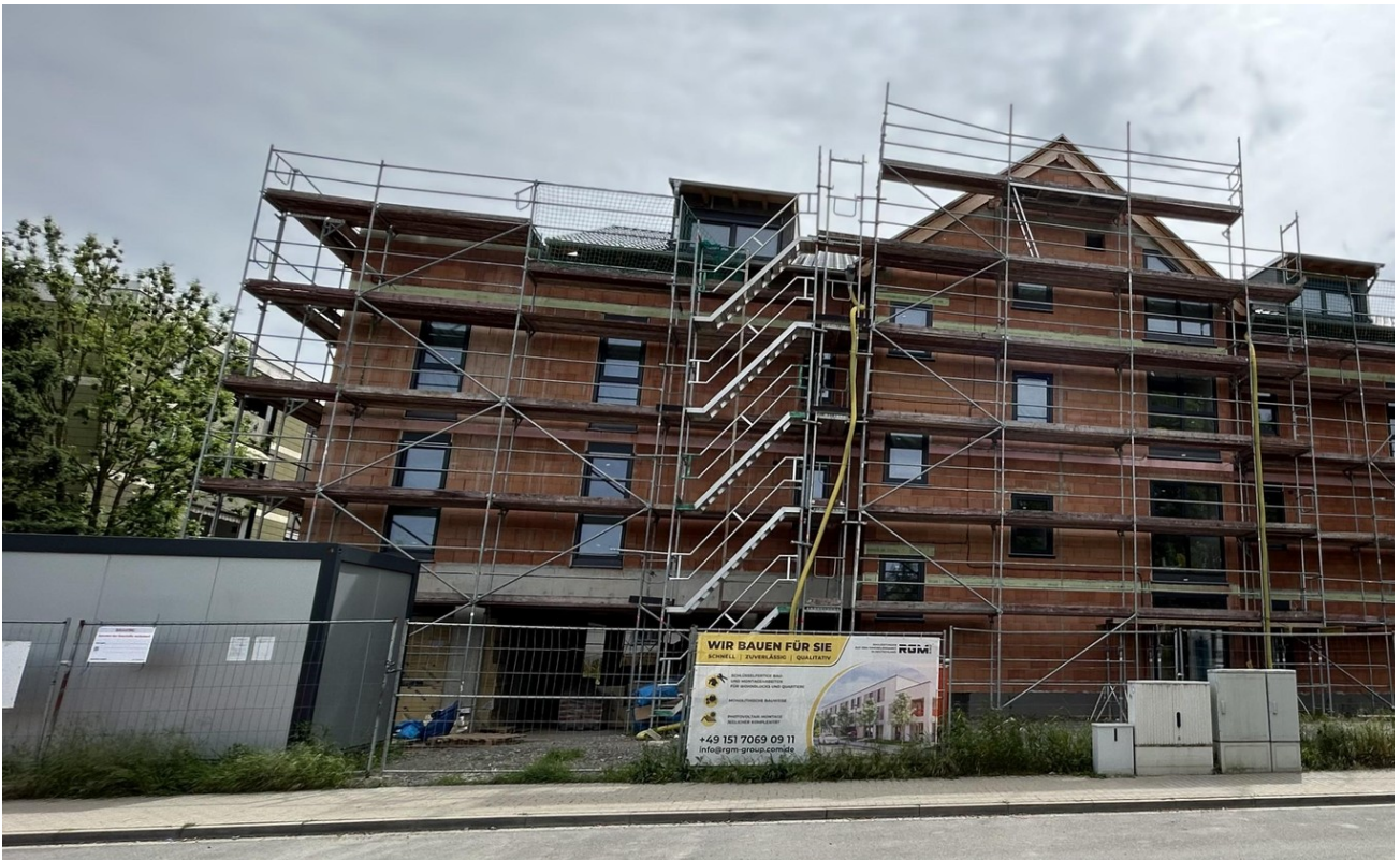
aktueller Zustand vorne