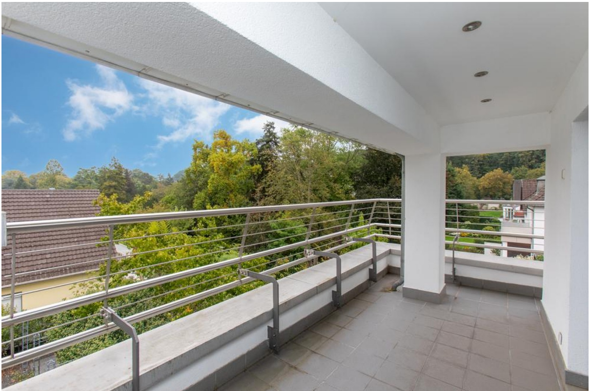
Panorama Balkon Penthouse