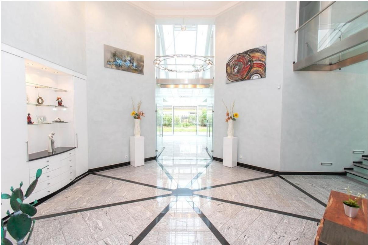
Empore des Haus im Haus