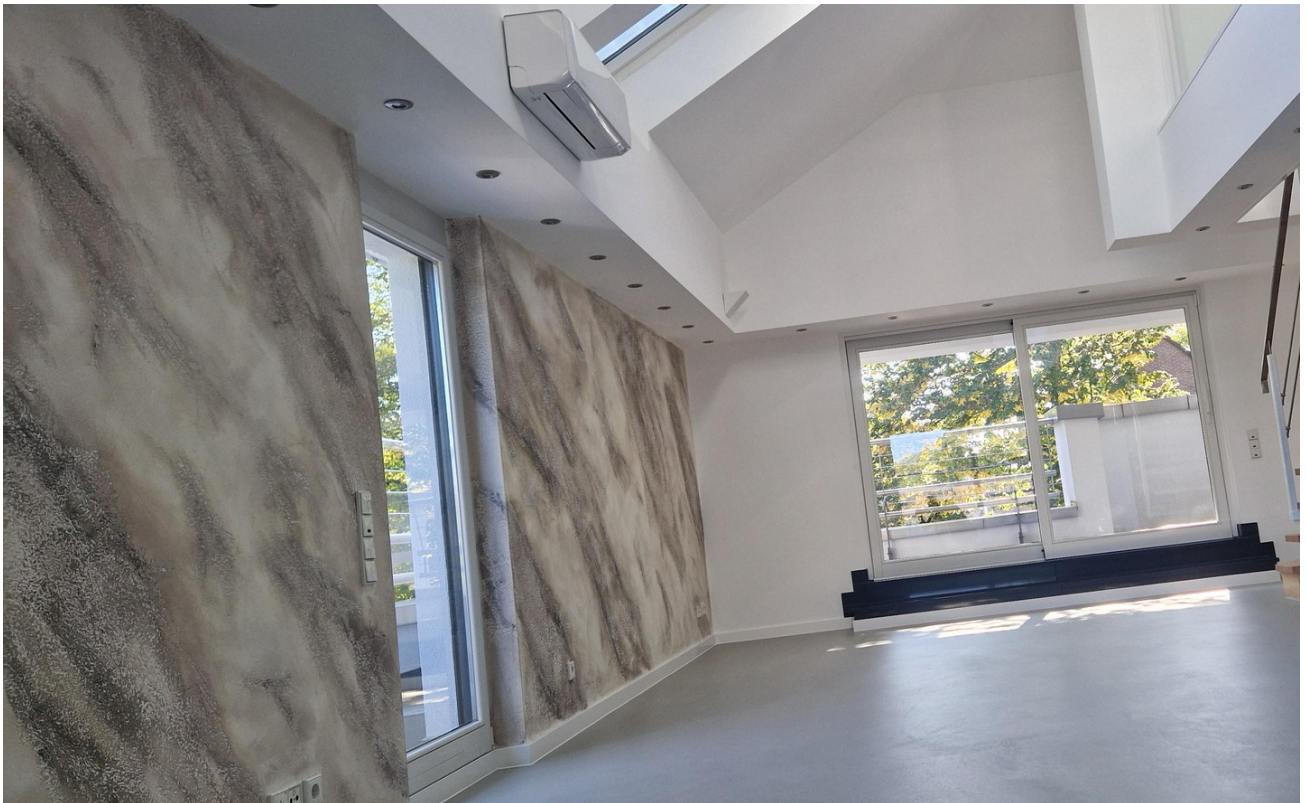
Wohnzimmer Penthouse 1.Etage