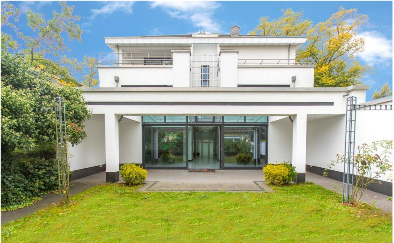
Rückansicht mit Garten