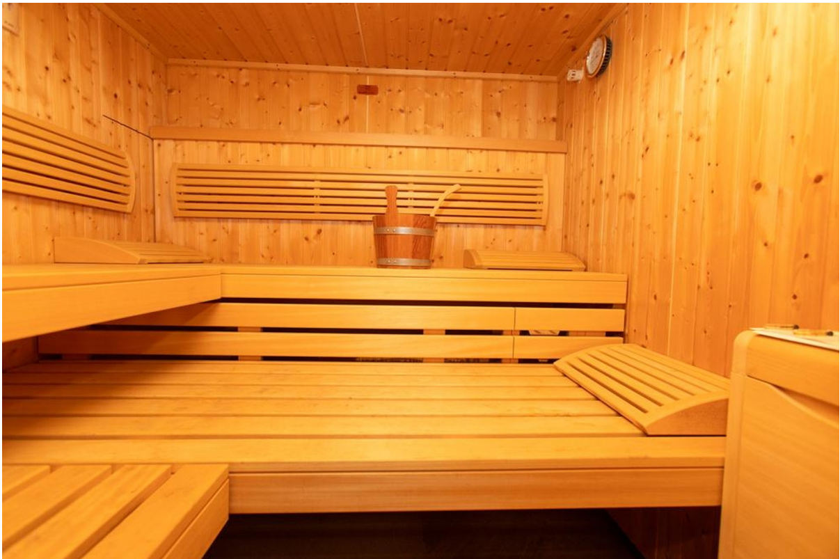
Wellness mit Sauna