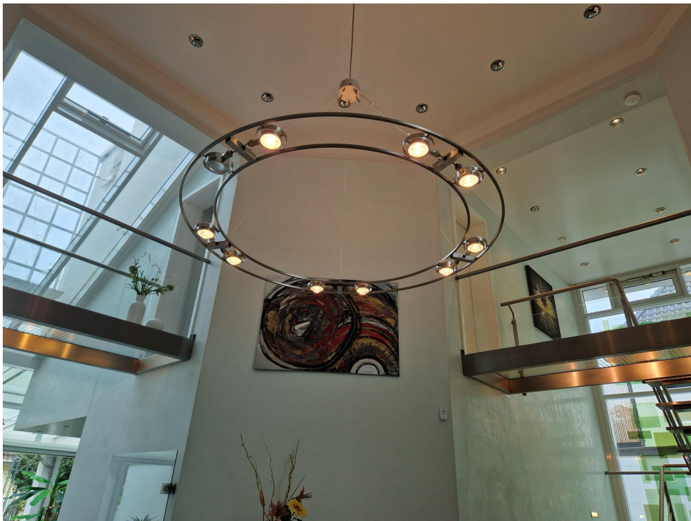
Edel-Entre mit Kronleuchter