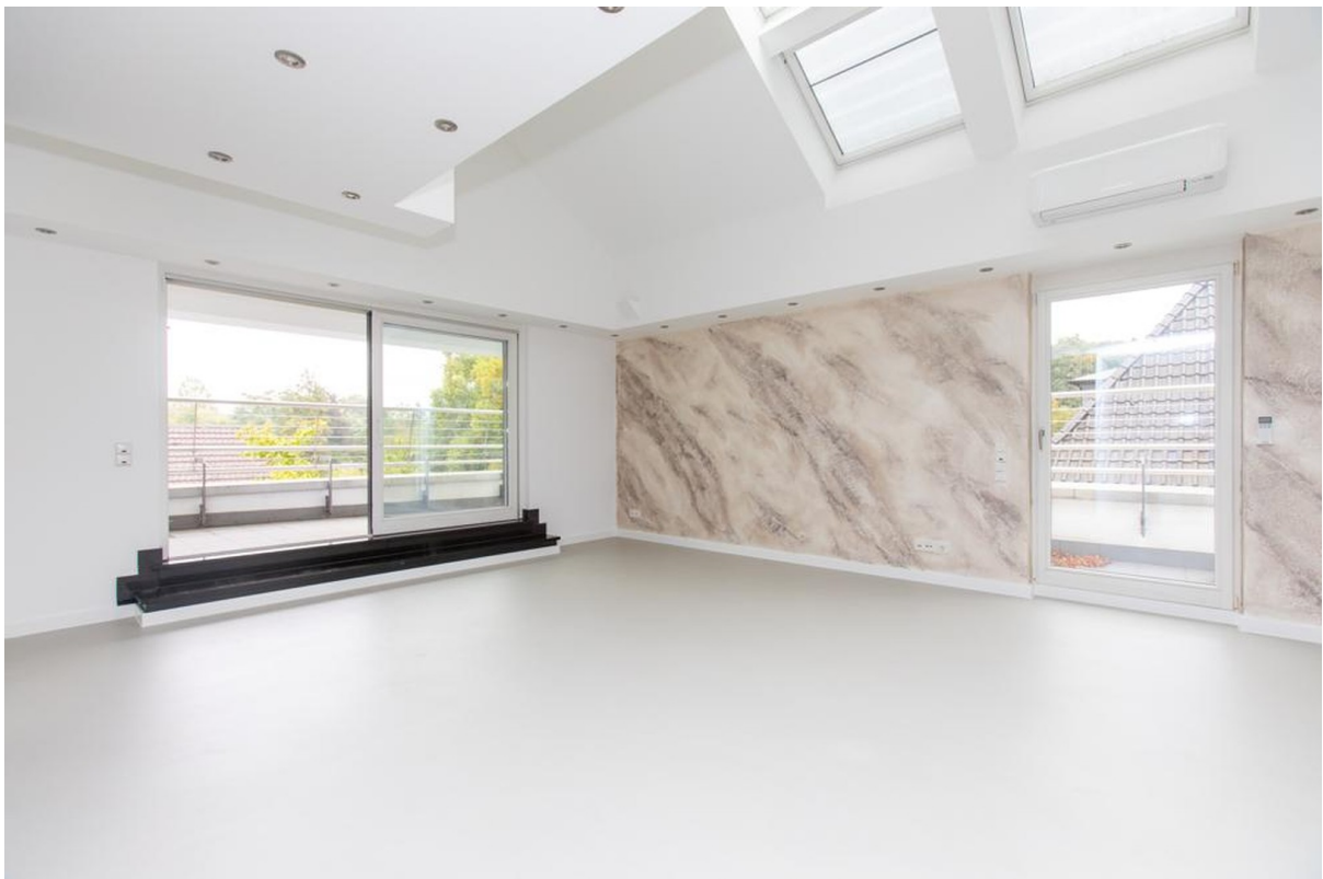
Wohnzimmer Penthouse 1.Etage