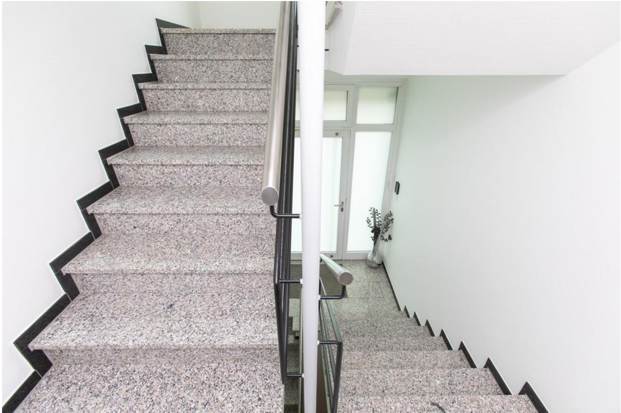
separates Treppenhaus zum Ph.