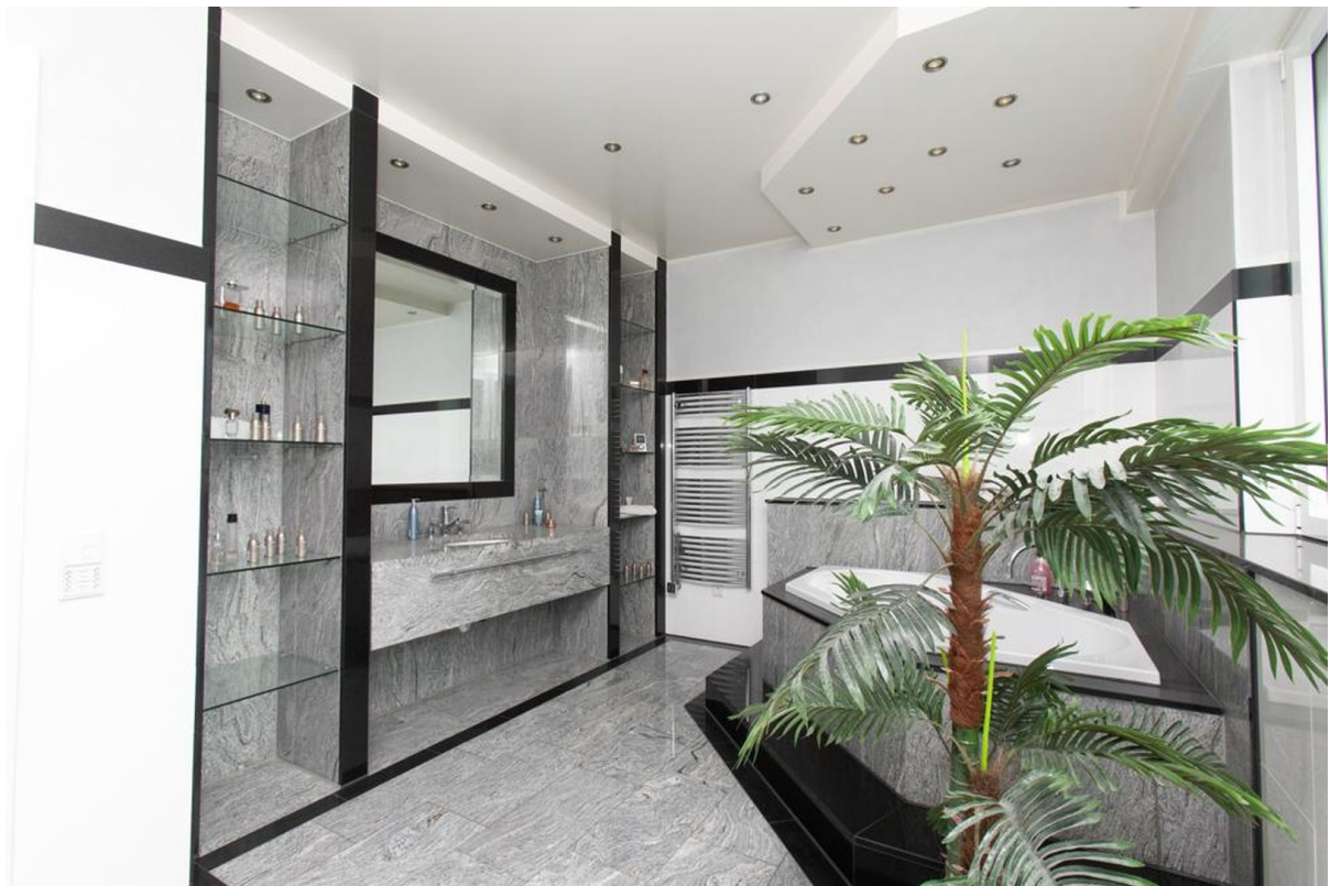
Bad 1 Haus im Haus