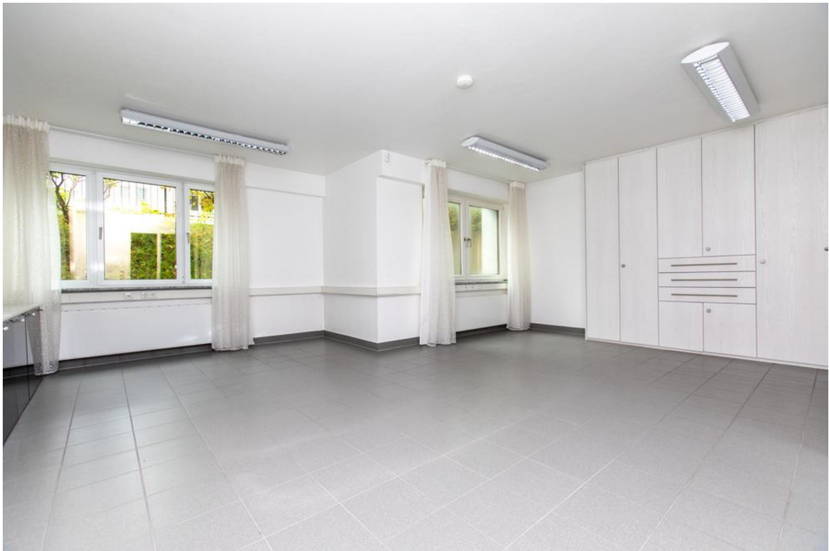
Souterrain Raum 2