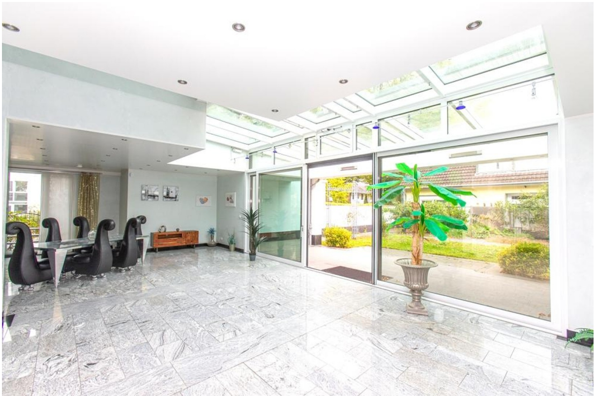
WZ. im Haus im Haus