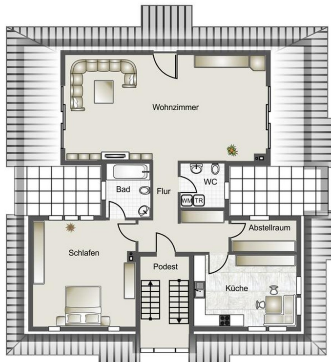
Penthouse 1. Etage