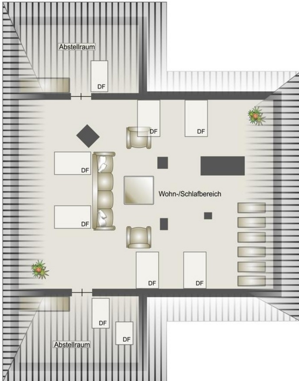
Penthouse 2. Etage