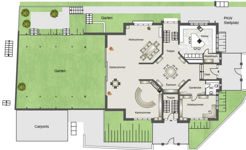
Erdgeschoss Haus im Haus