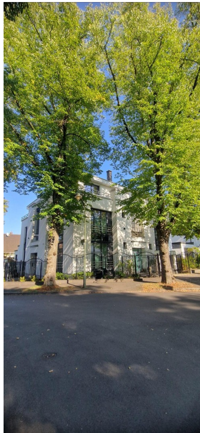
Baujahr 2001 Architekten-Villa