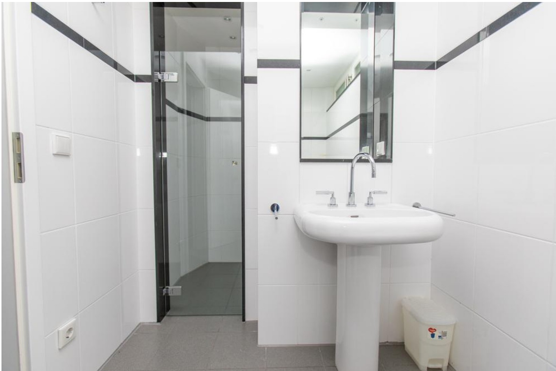
Souterrain Bad mit Dusche