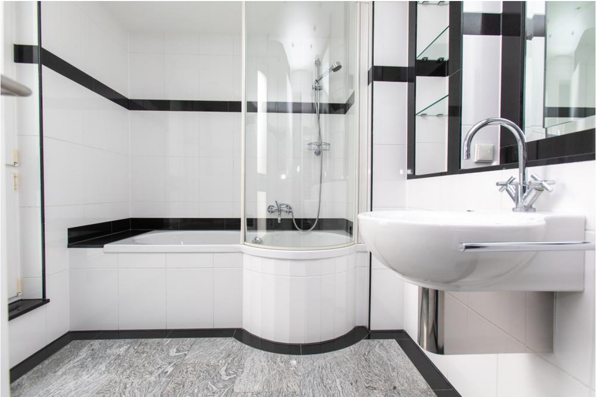
Bad 1 Penthouse