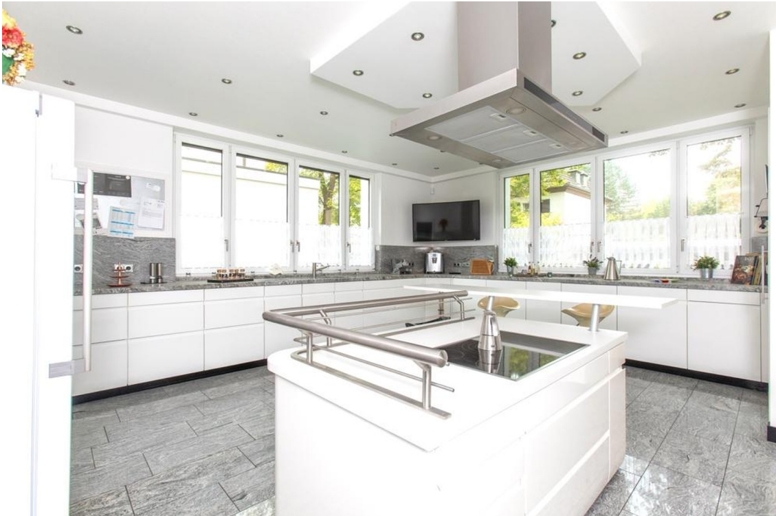
Küche Haus im Haus