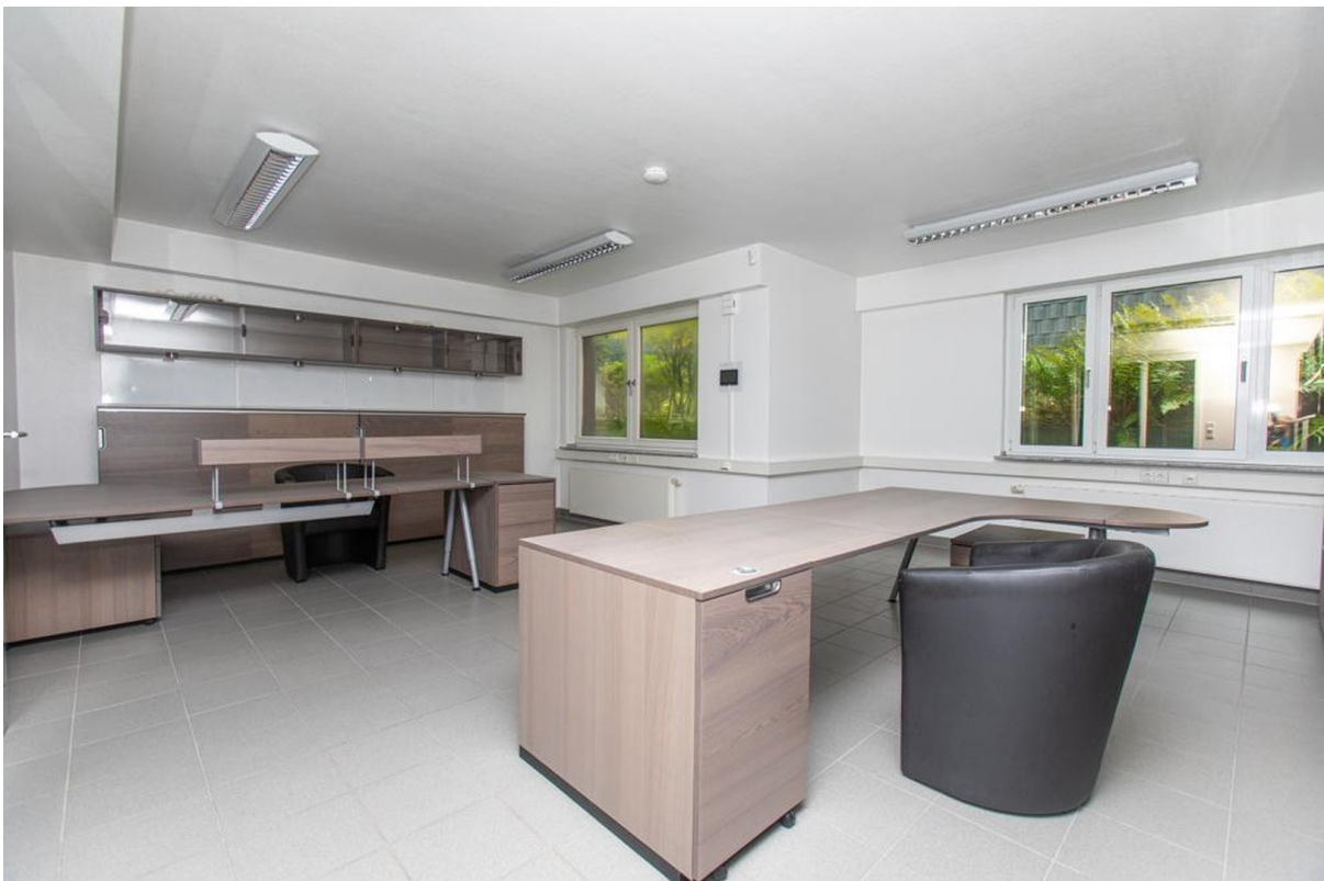
Souterrain Raum 1