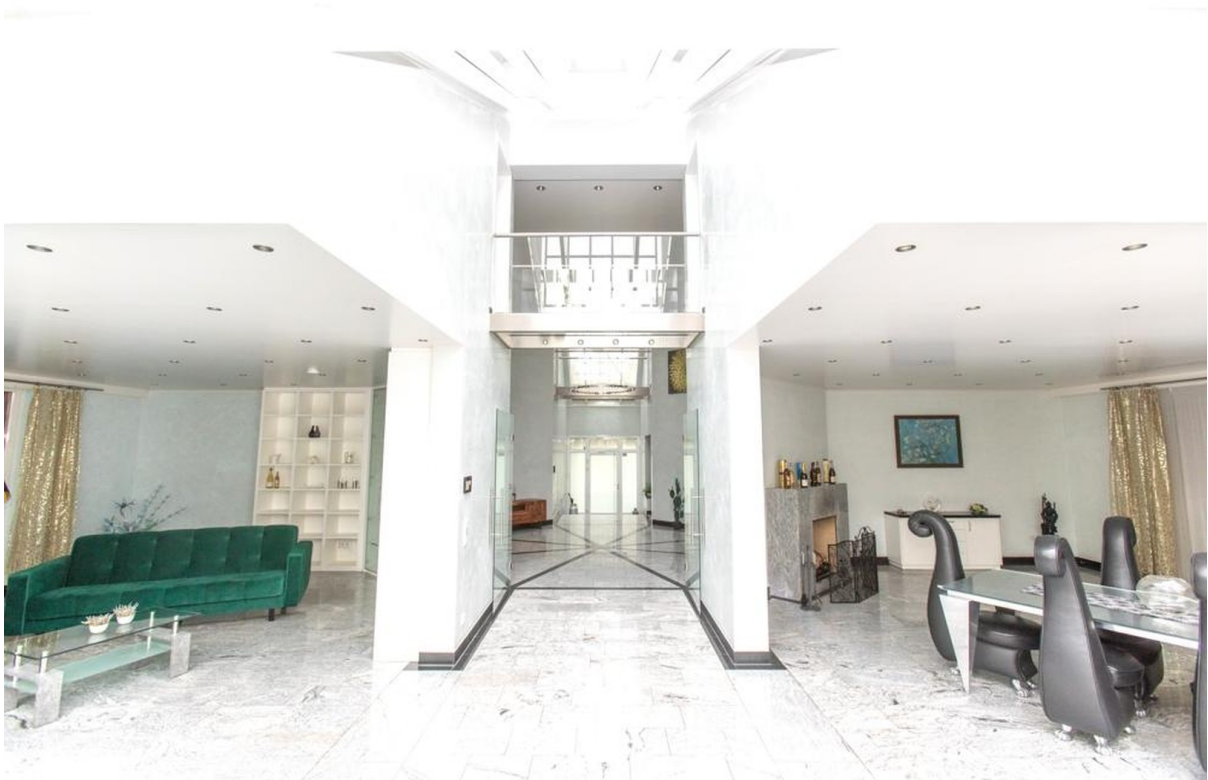
Wohnzimmer im Haus im Haus