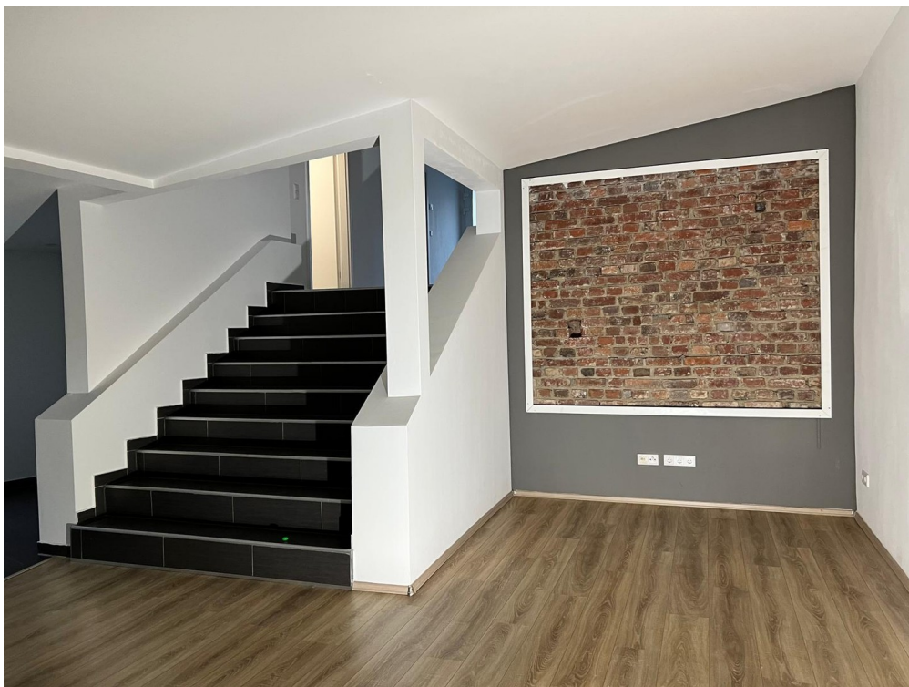
Treppenaufgang zum Eingang