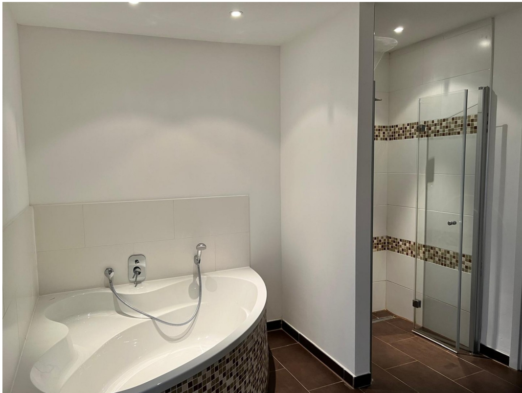
Großes Bad 1