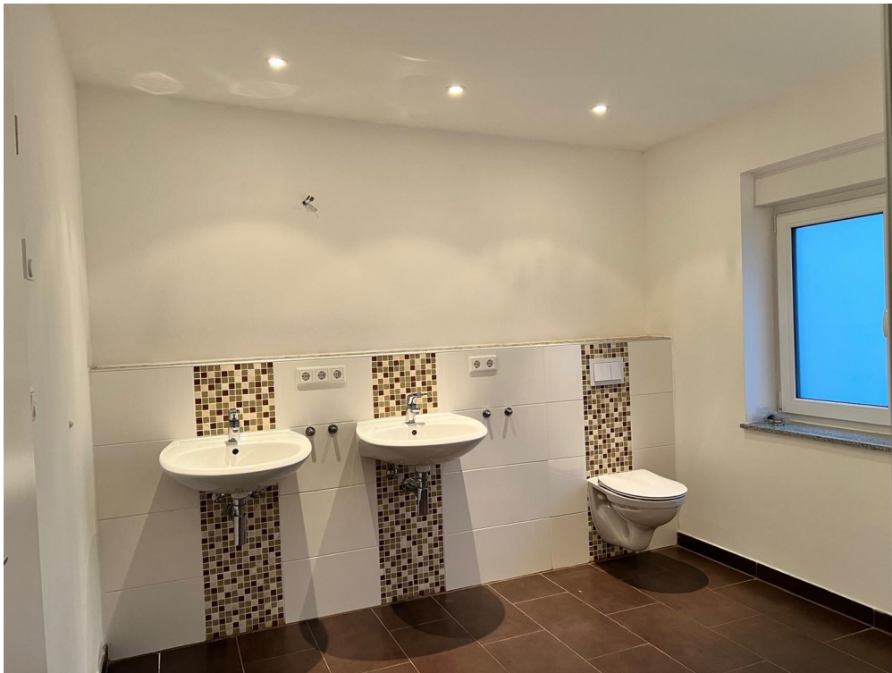
Großes Bad 2