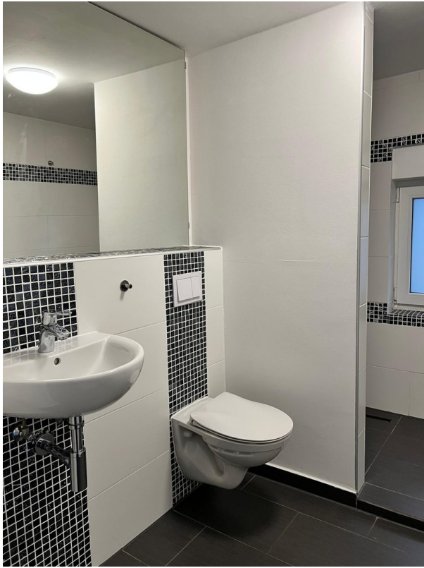
Kleines Bad / Gäste WC 1