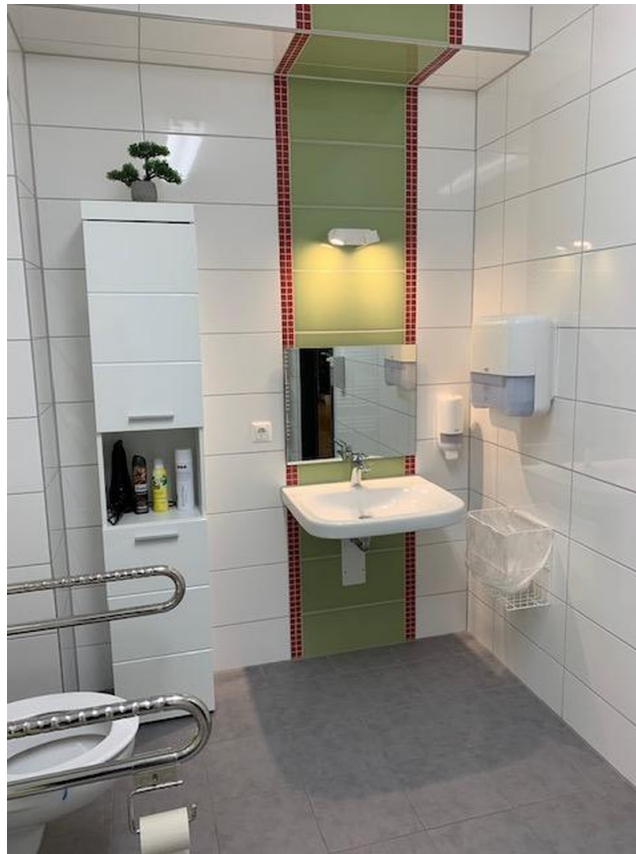
Hinterhaus sanitäre Anlagen