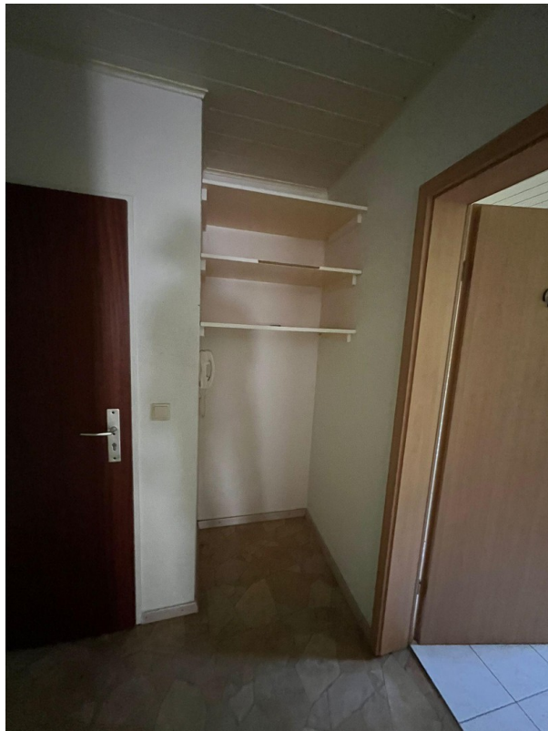
Einbauregal im Flur