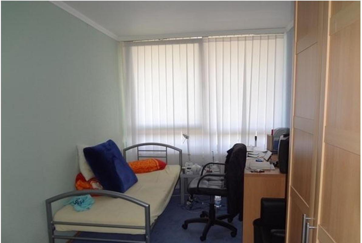
4 kleines Zimmer