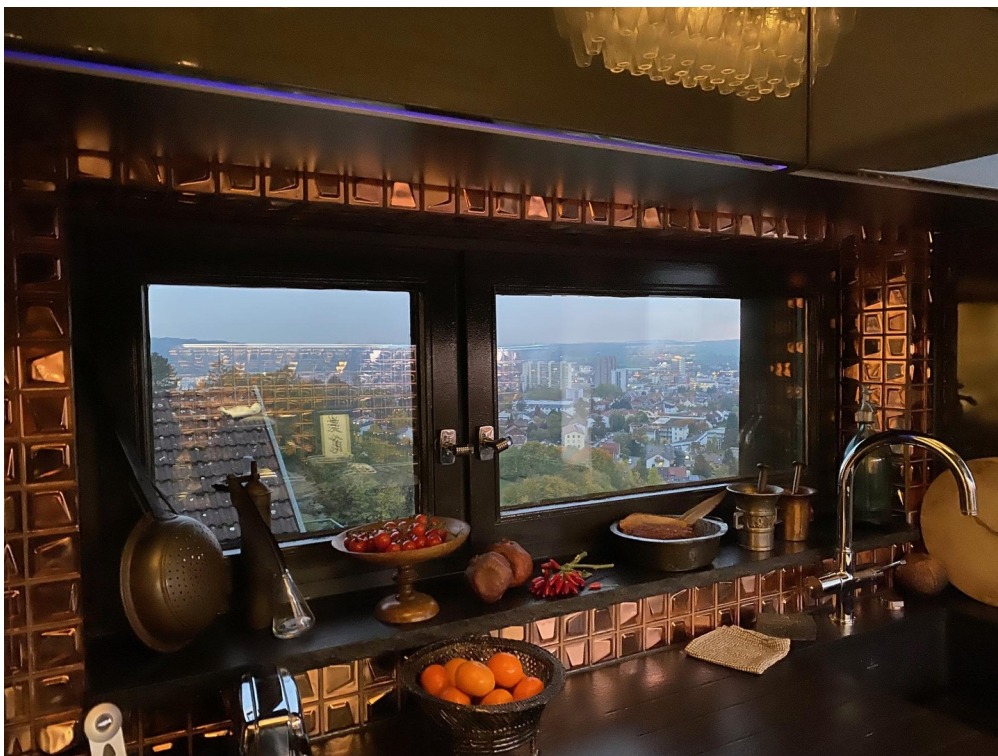
Kochen mit Aussicht