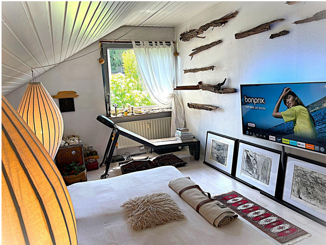
Fernseh-/Gästezimmer/ Kind 2