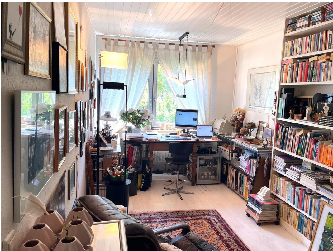
Bibliothek, Kinder oder Arbeit