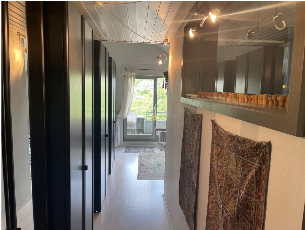
6,30 m Stauraum-Deluxe