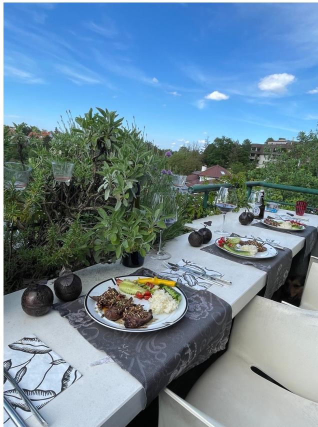
Dinner über den Dächern