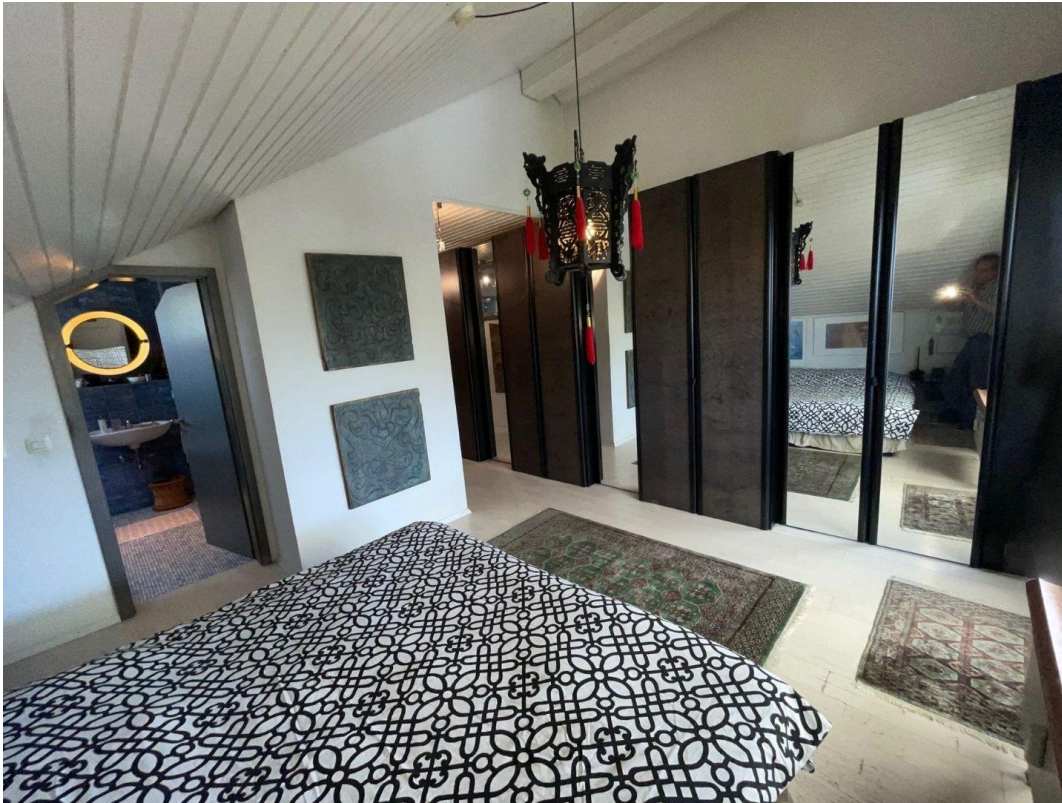
Schlafzimmer – direkt zum Bad