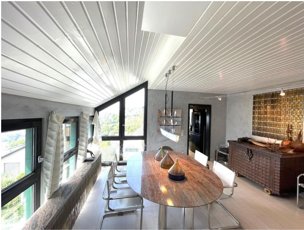
Dining Room am Tag