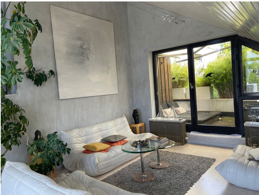
Wohnzimmer zum chillen