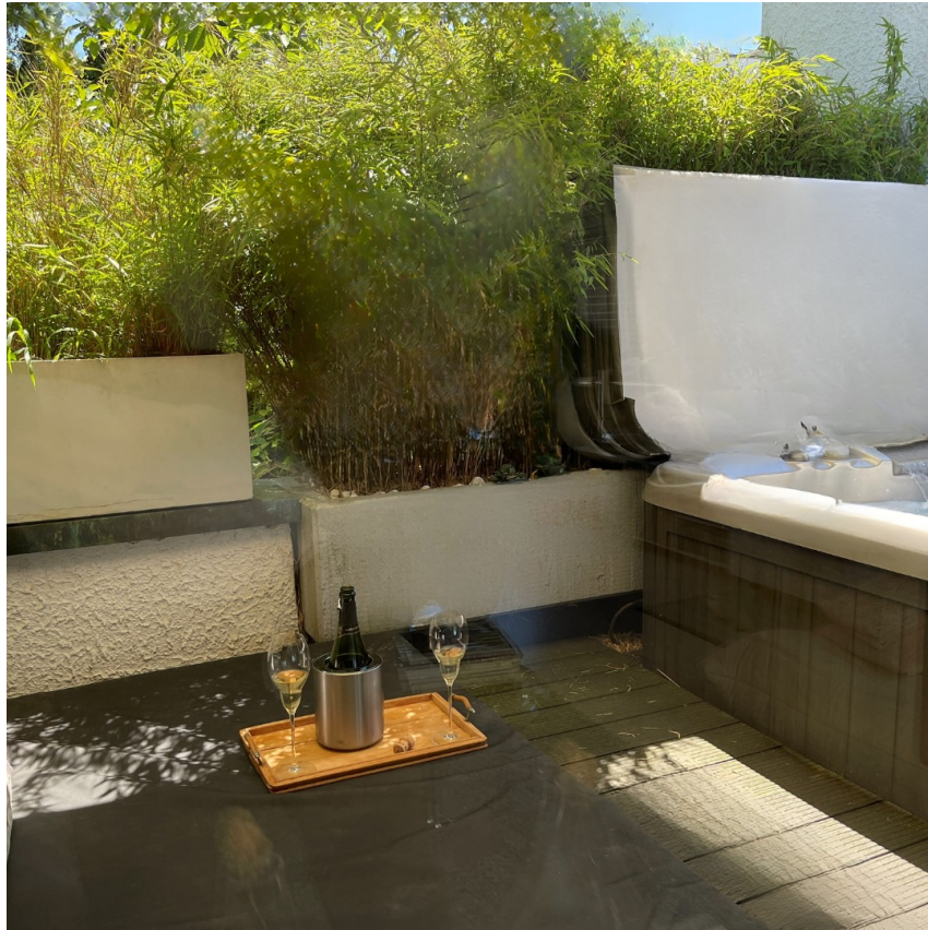
Wellness -ganzjährig - privat