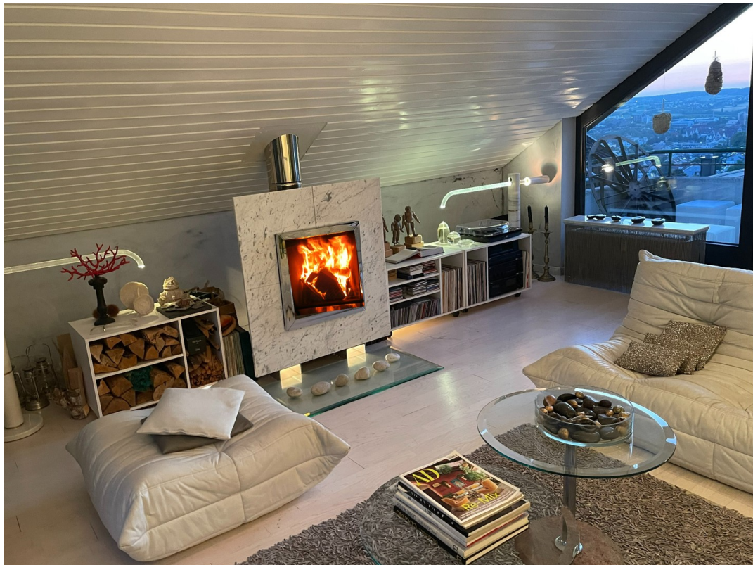
Wenn es draußen kalt ist