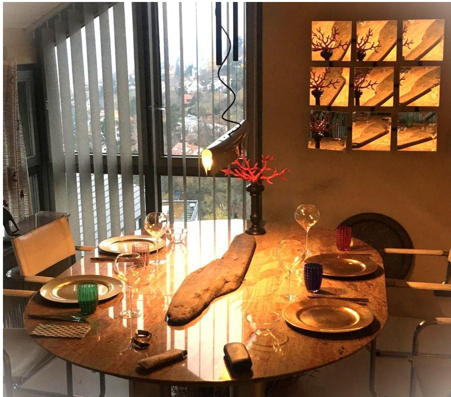
Essen mit Stil