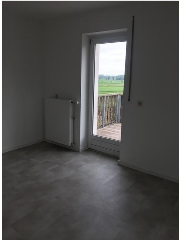
Wohnküche mit Blick auf den Ba