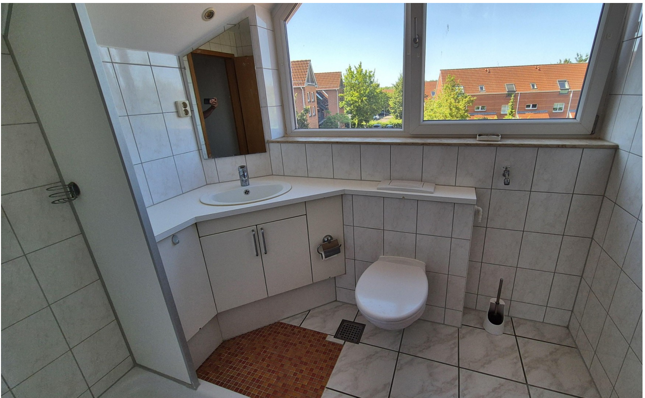
Badezimmer + Waschmasch. Ansch