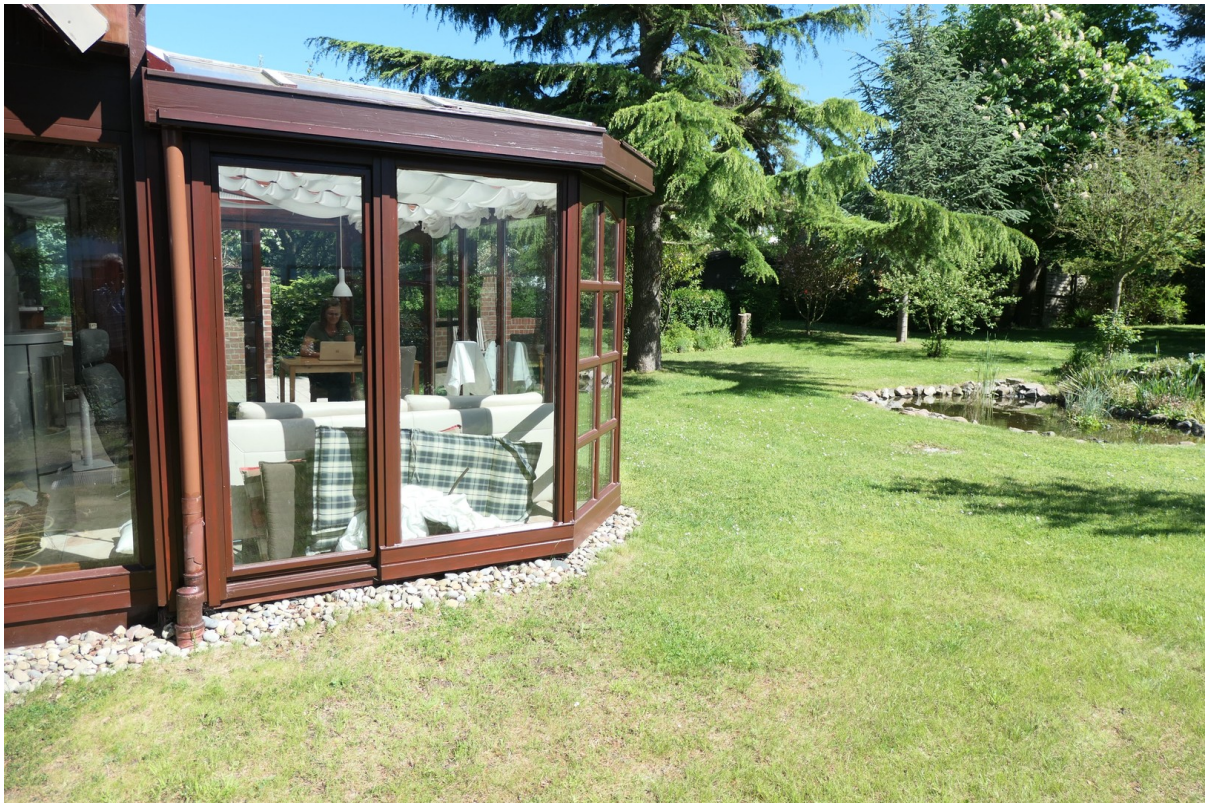
Wintergarten und Große Zeder