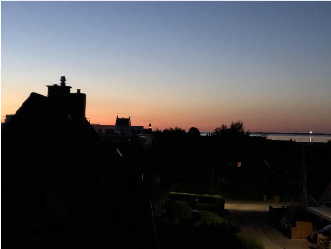
Blick zum Leuchtturm Fehmarn