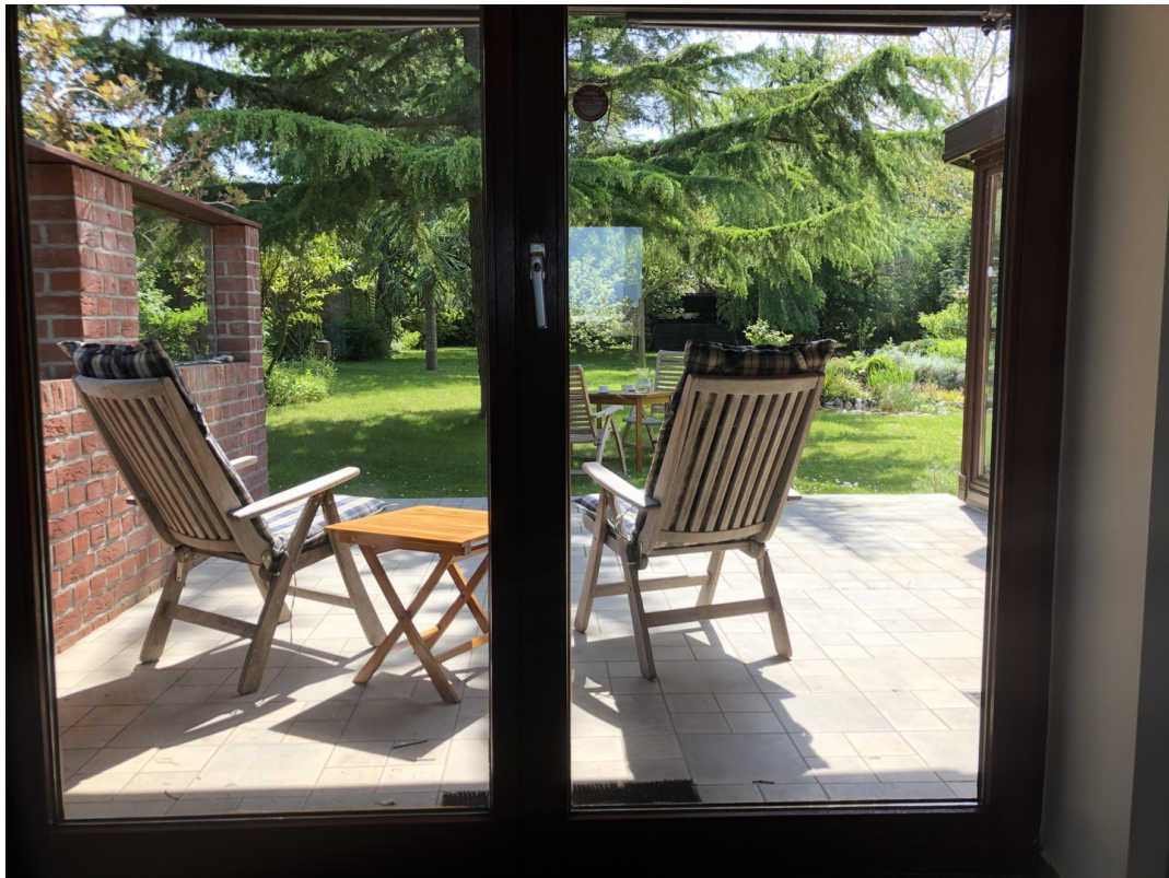
Blick aus der Wohnküche