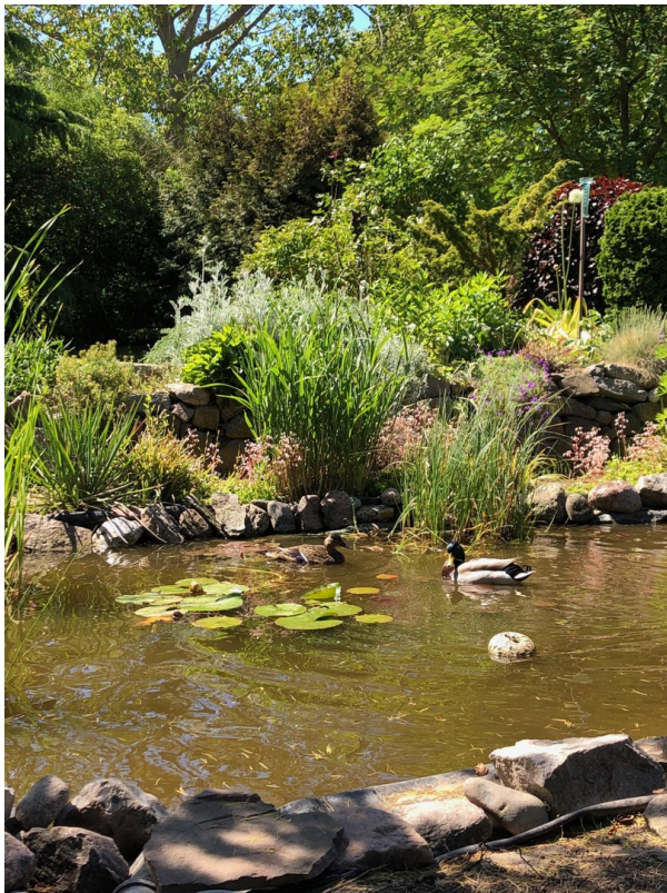
Enten kommen uns besuchen