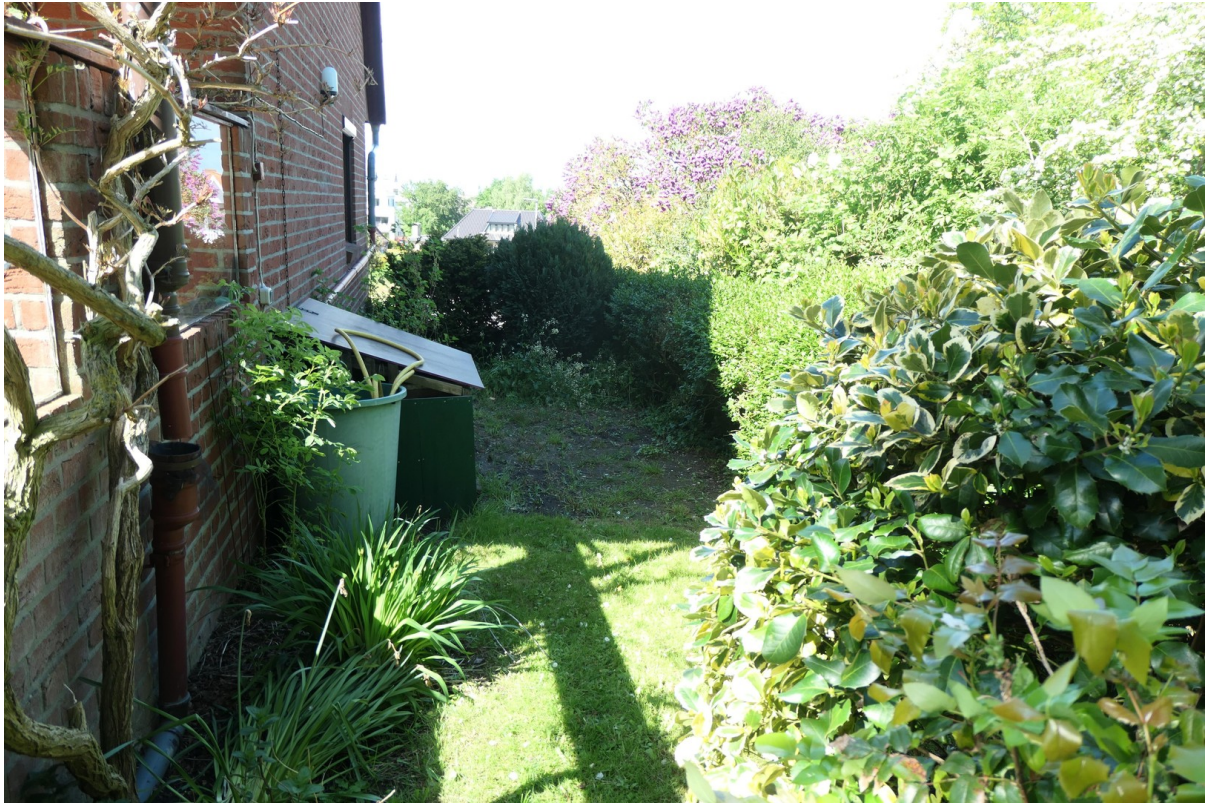
Gemüsegarten im Osten