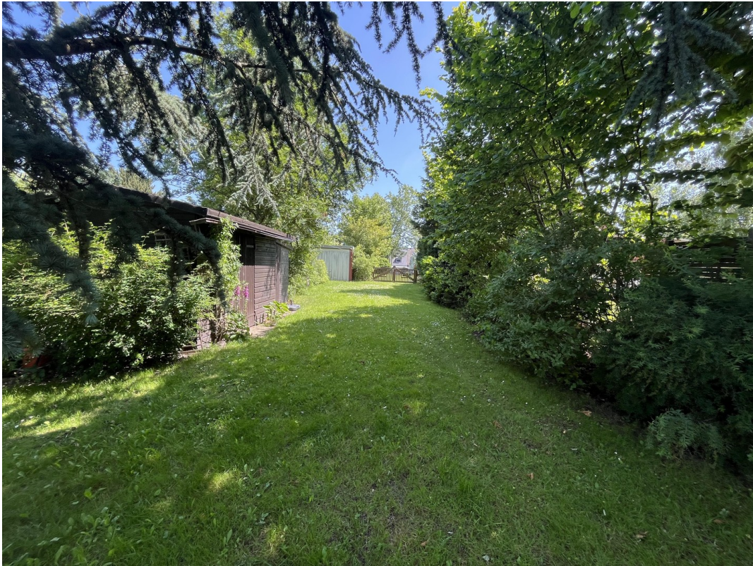
Garten, seitlicher Zugang