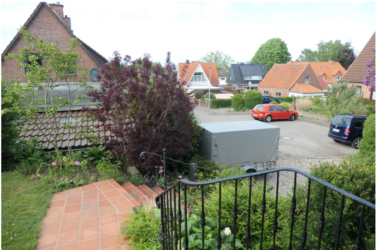
Ausblick vom Eingang