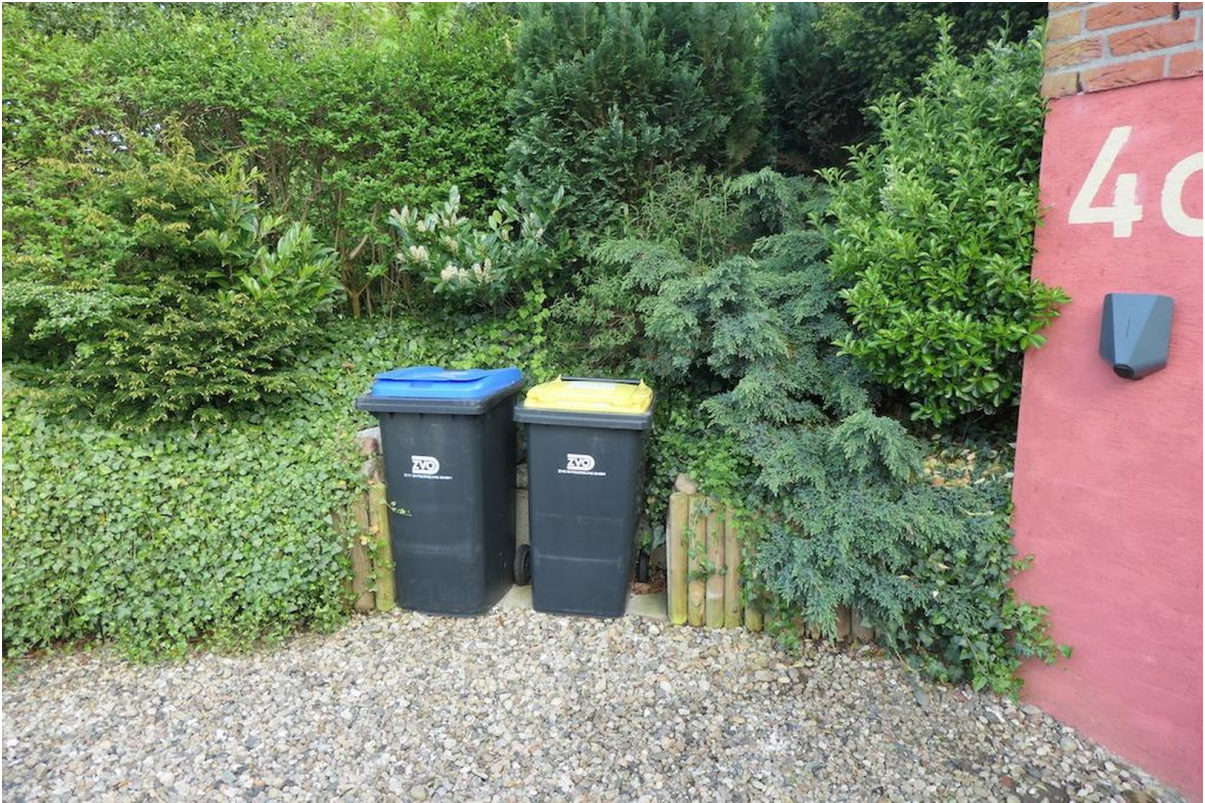
Mülltrennung und Wallbox