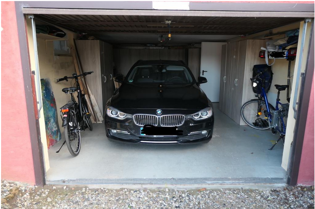
Garage für PKW und Fahrräder