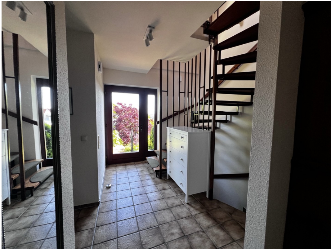
Flur im EG