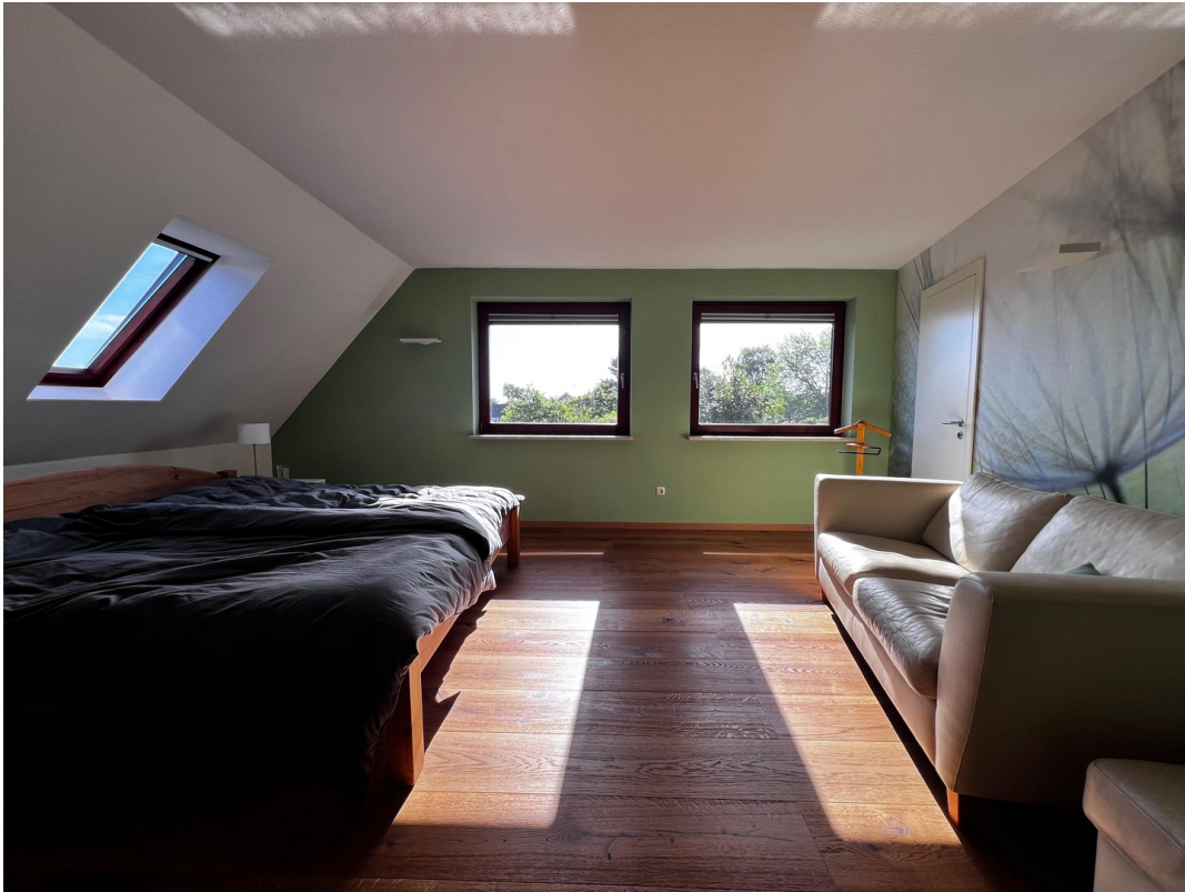
Großes Schlafzimmer im OG