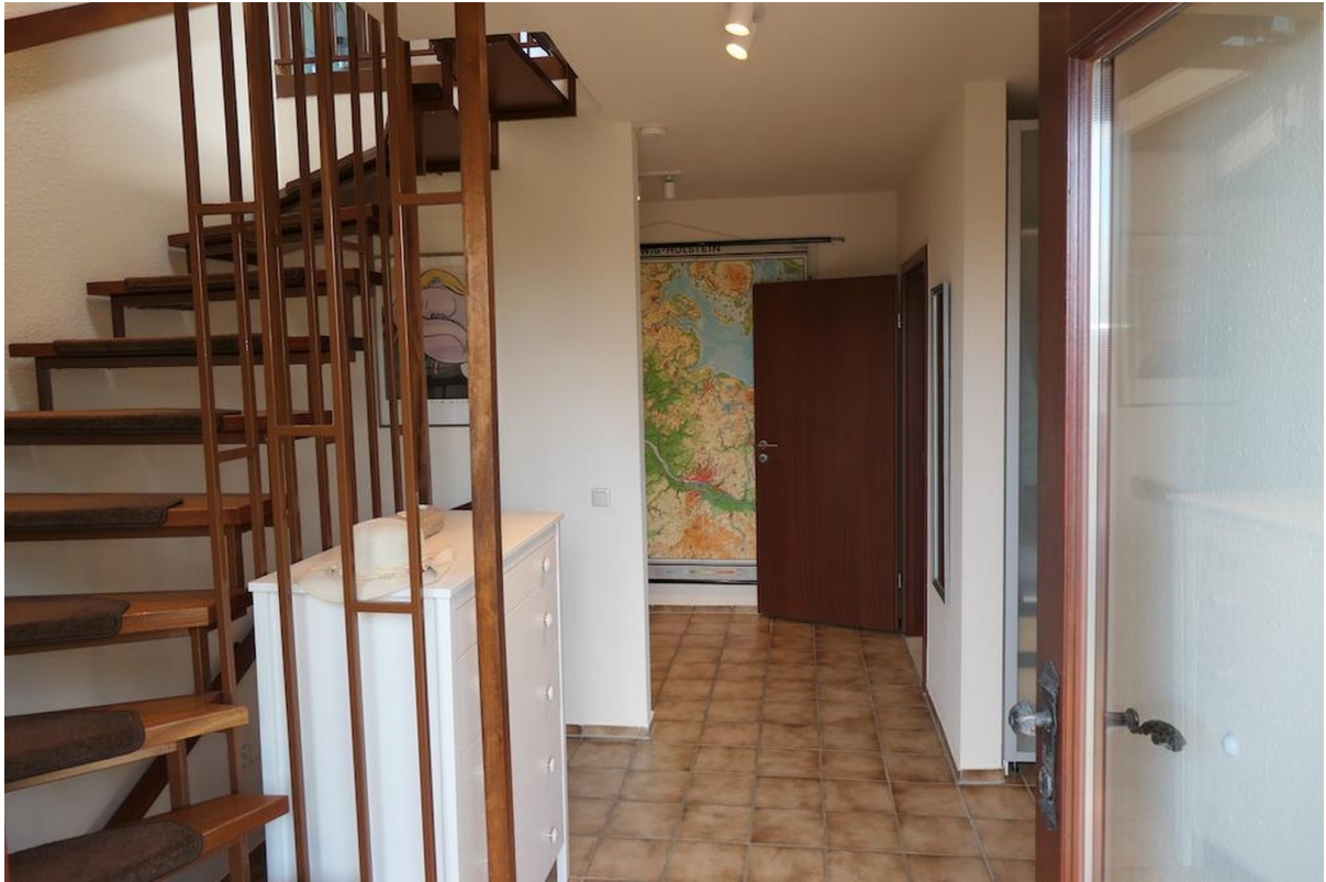
Diele mit Treppenhaus