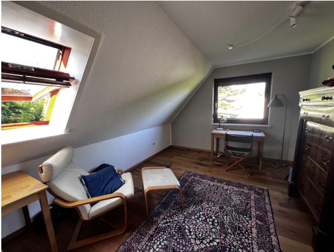
2. Schlafzimmer im OG