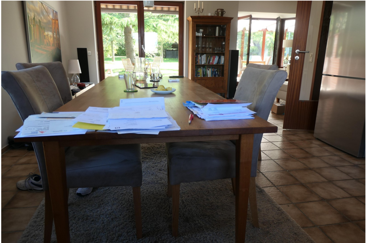
Essbereich in der Wohnküche