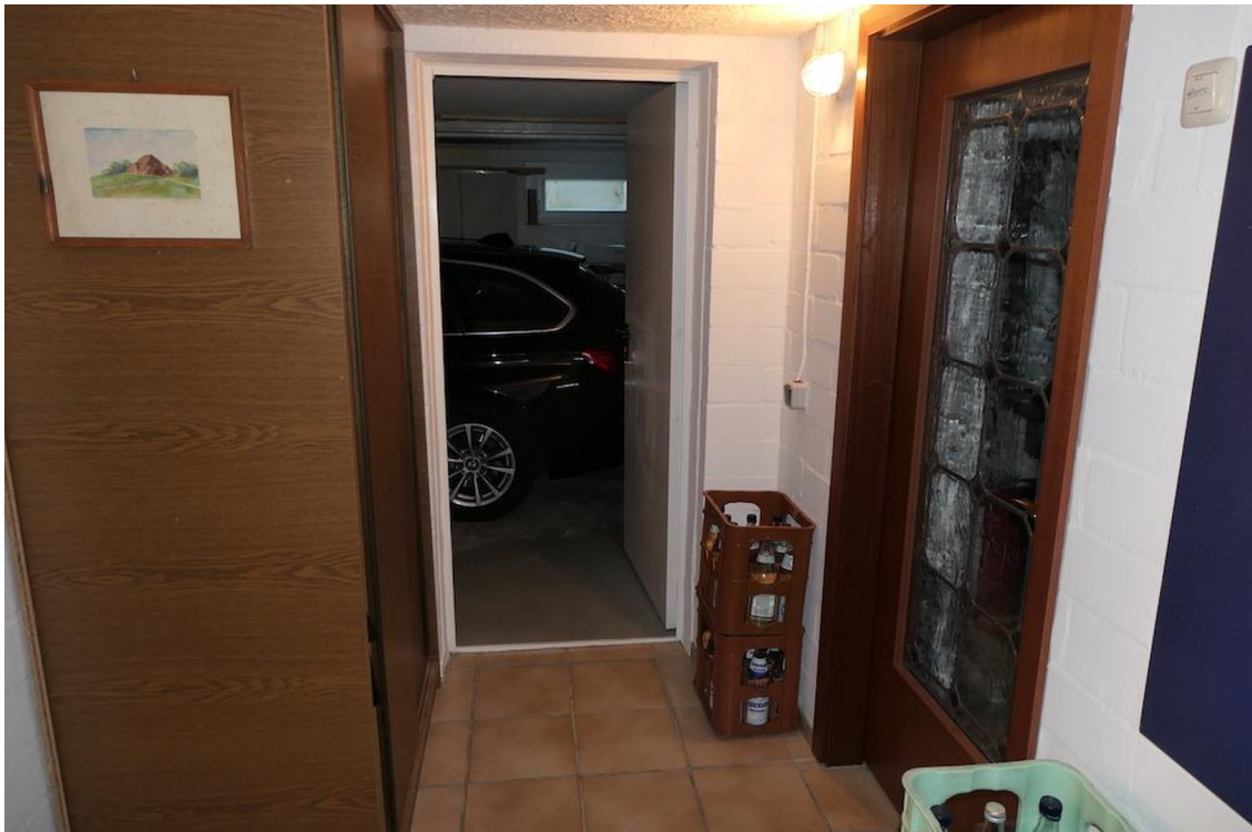
Kellerflur, Zugang zur Garage