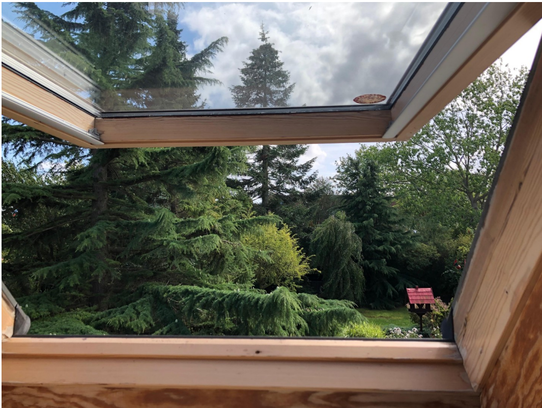
Blick aus dem 2. Schlafzimmer