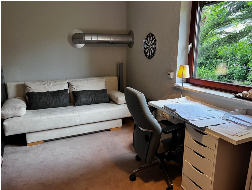
Büro und Gästezimmer im EG