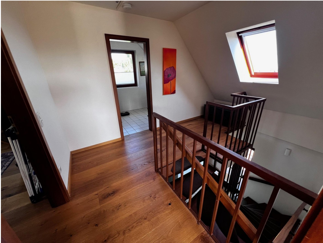
Flur im Obergeschoss