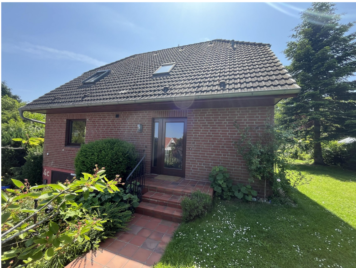
Eingangsbereich Nord Ansicht