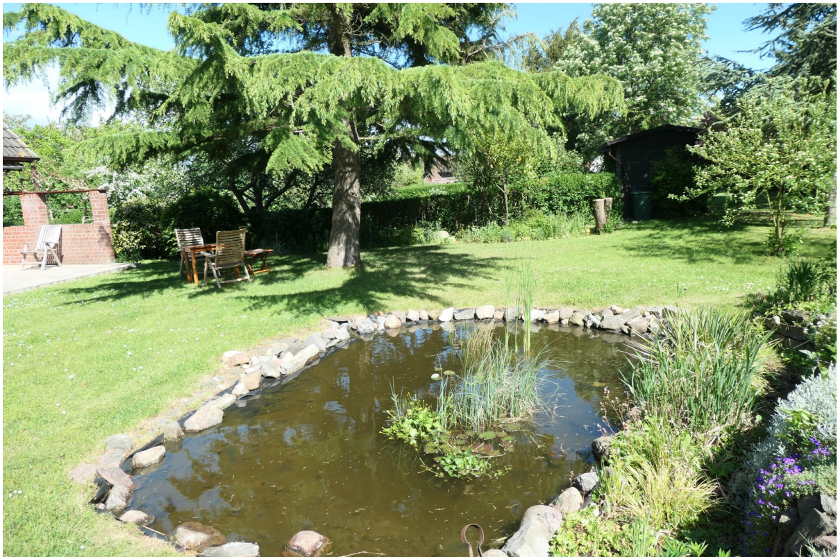
Garten mit Teich