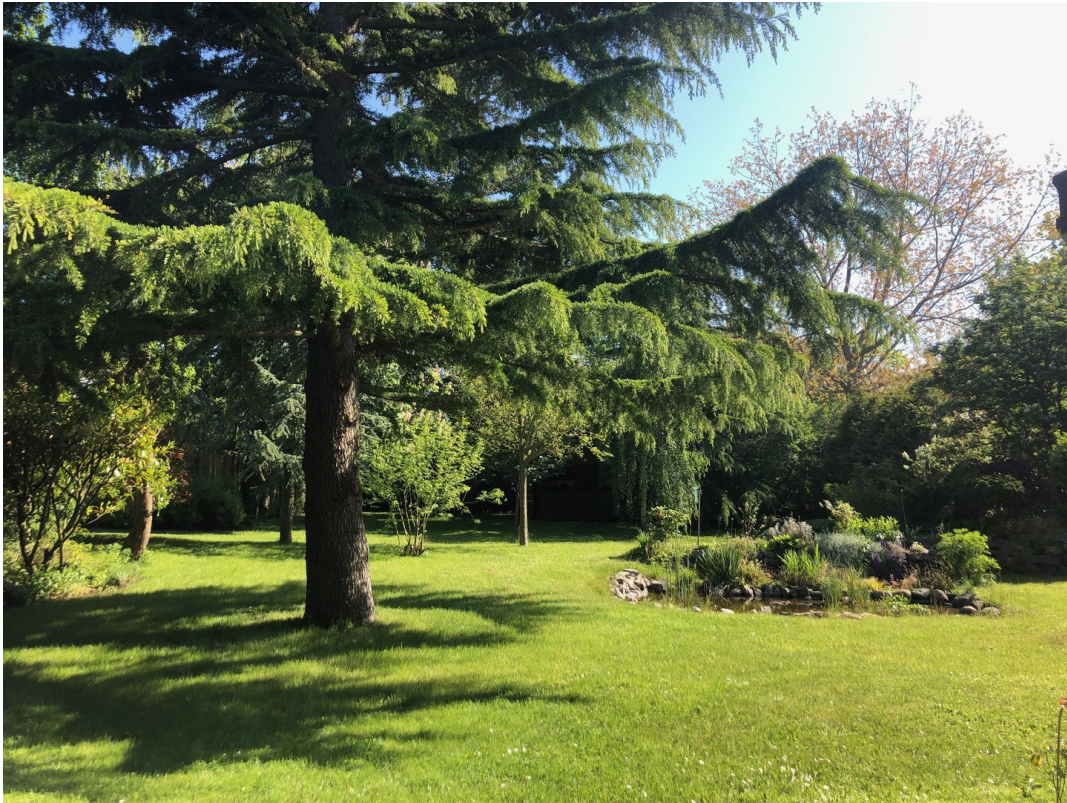
Garten mit wertvollen Bäumen