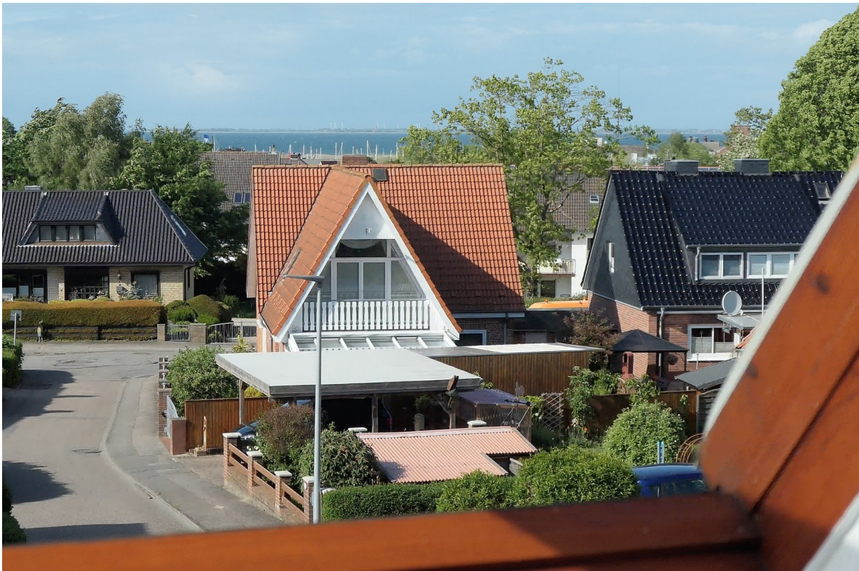
Blick aus dem OG