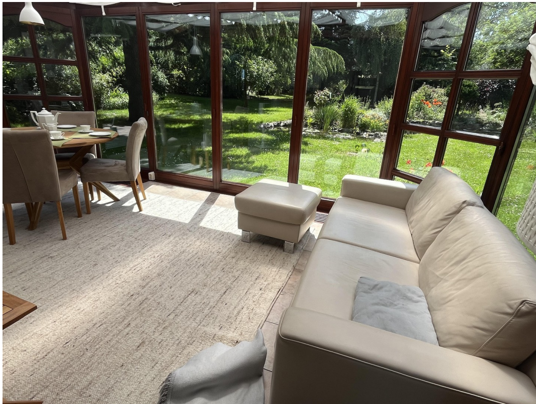
Wintergarten als Wohnzimmer