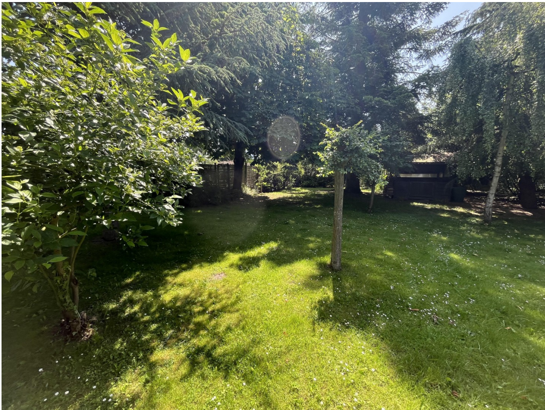
Garten mit zweitem Gartenhaus