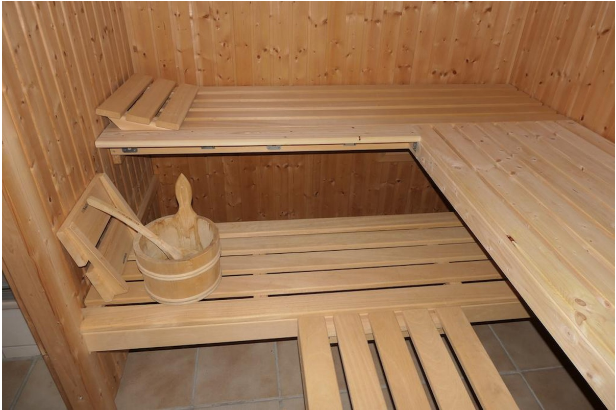
5 Personen Sauna im Keller