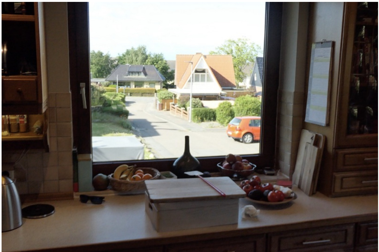
Blick aus der Wohnküche