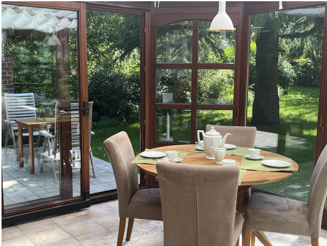
Durchgang zur Terrasse