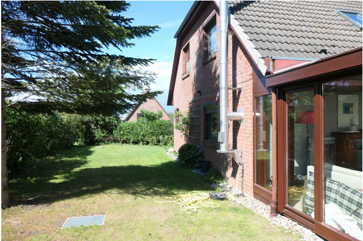
Kaminschornstein aus 2023