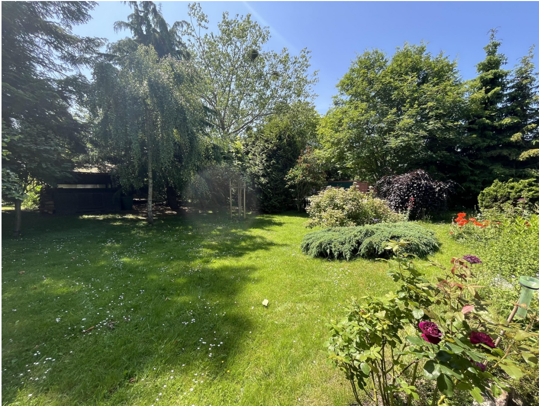
Garten mit erstem Gartenhaus