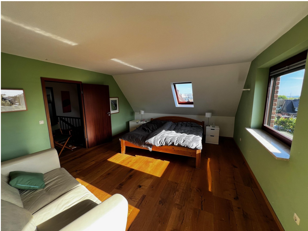
Großes Schlafzimmer im OG