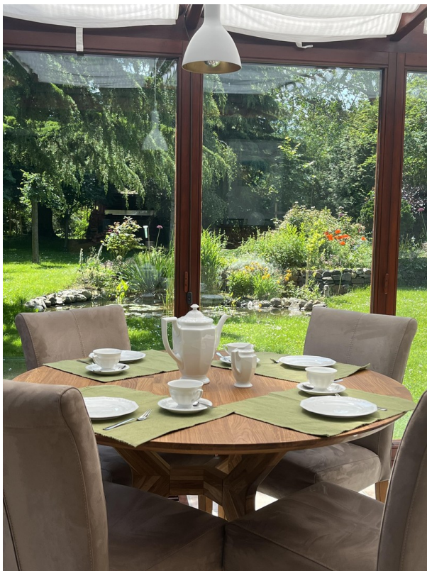
2. Essplatz im Wintergarten