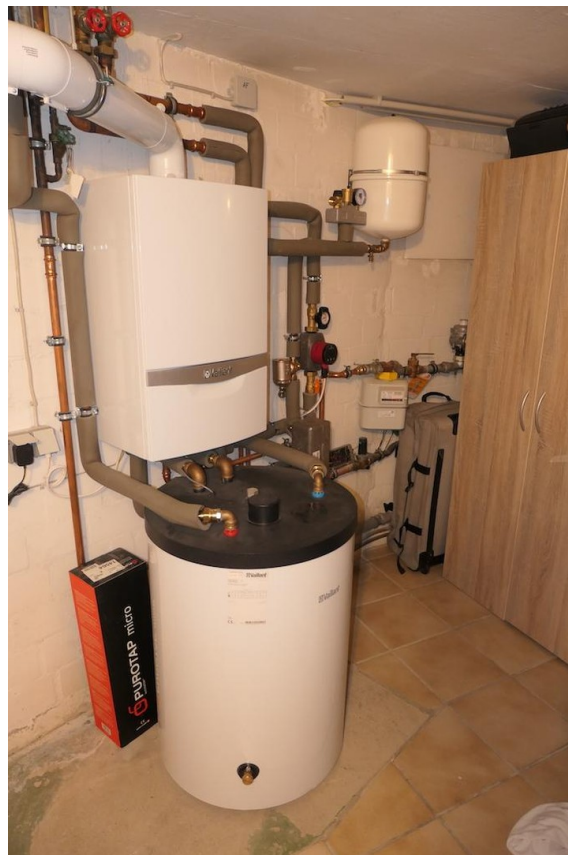
Brennwerttherme aus 2023