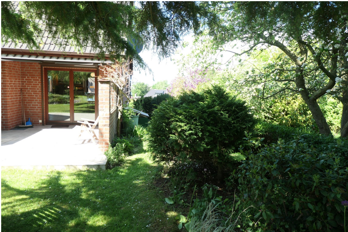
Ostseite des Gartens