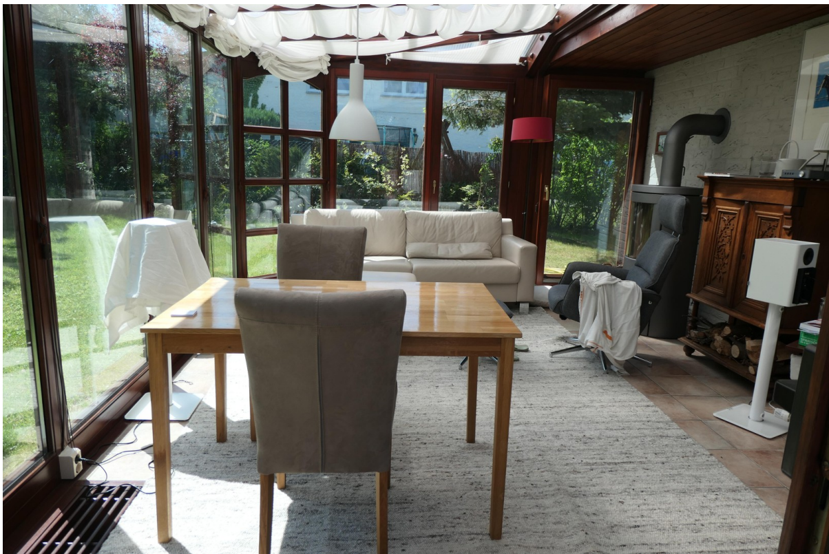
Wintergarten mit Kaminofen