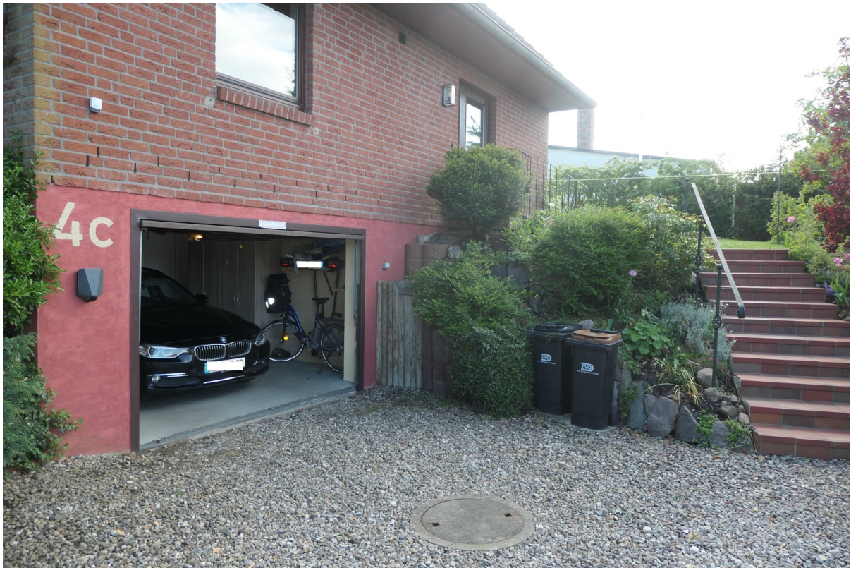
Vorplatz mit Tiefgarage