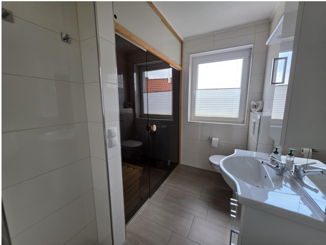
Bad / Sauna OG