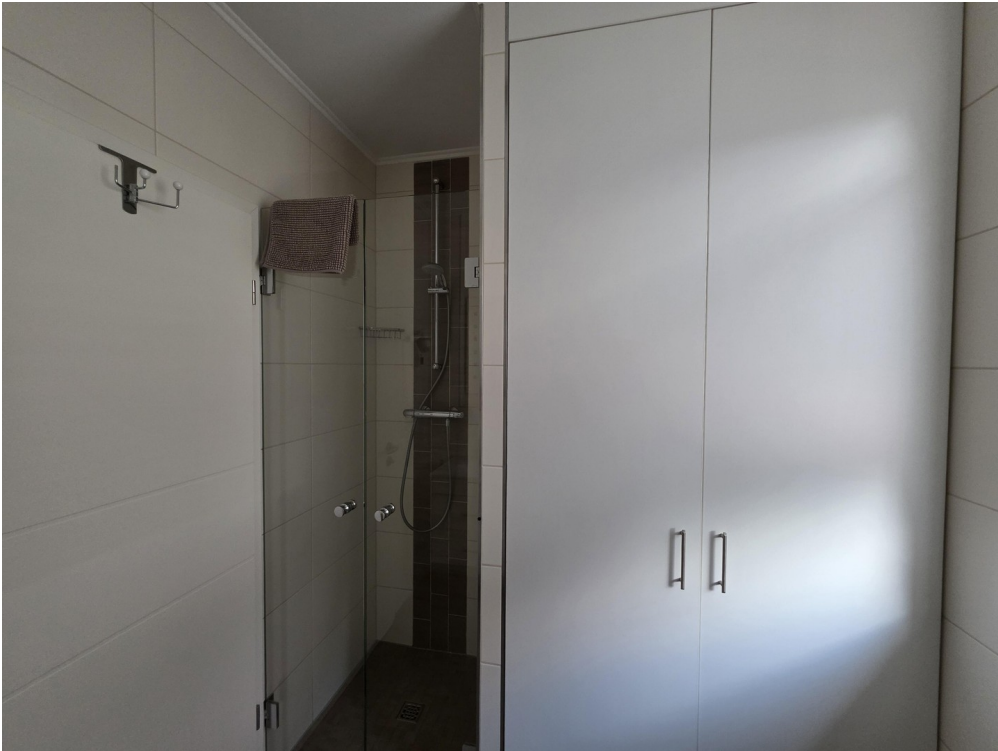
Bad EG/ Dusche, Geräteschrank