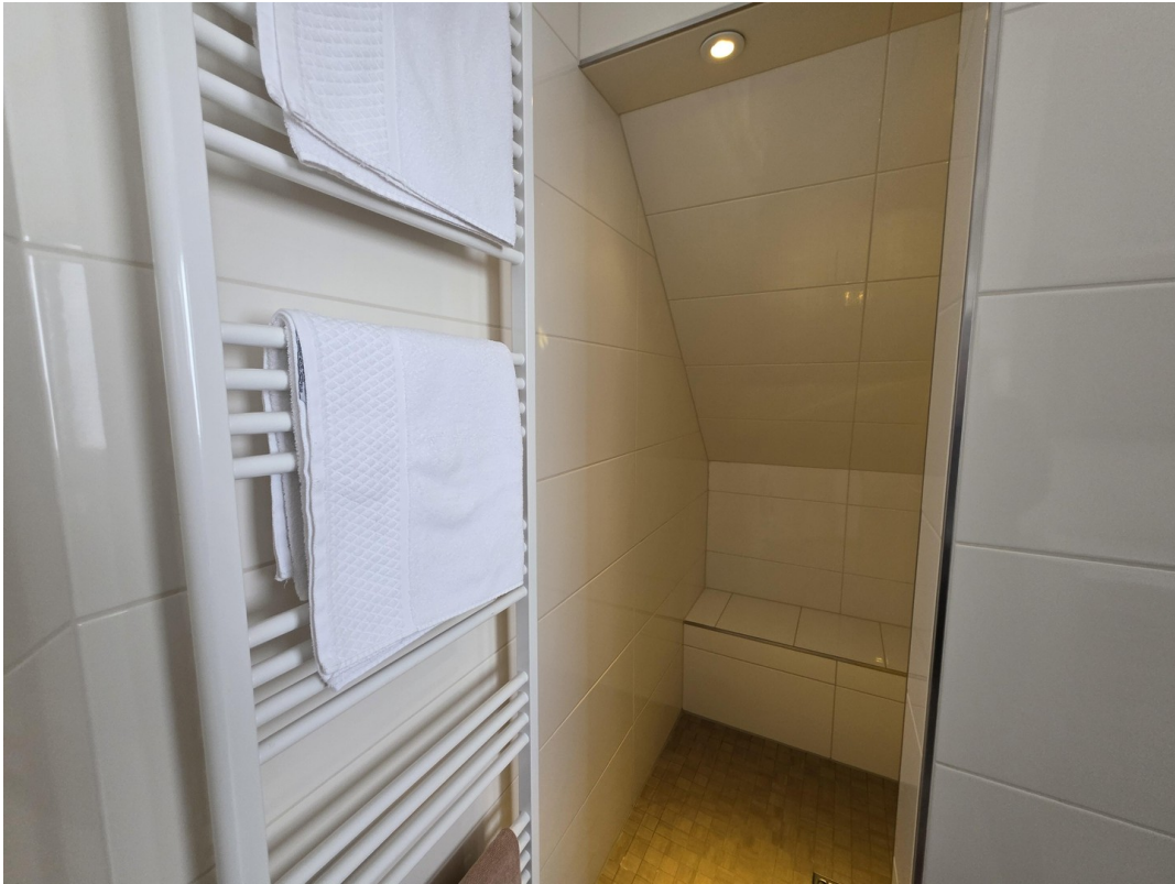
Bad OG / Dusche