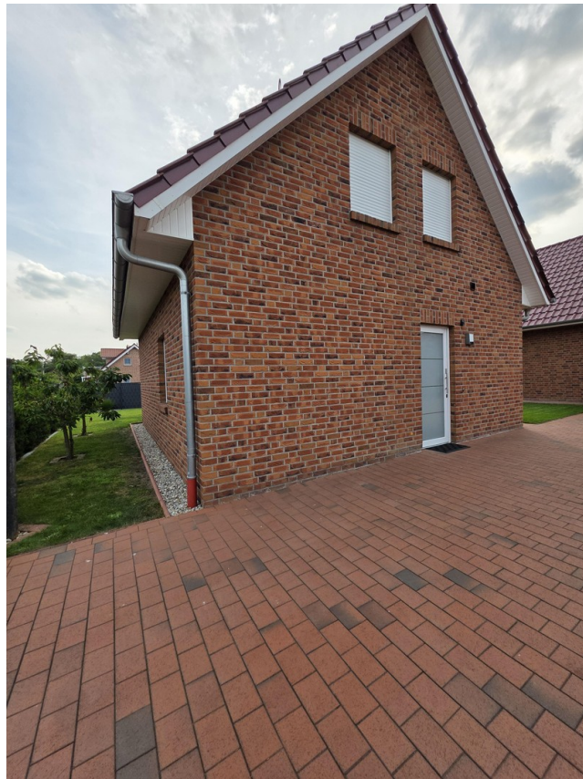
Haus vorne an der Straße